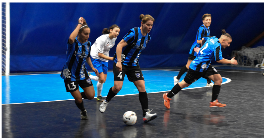
Una fase di gioco di Littoriana-Marandola

In tandem - Littoriana Futsal e Club Sport Roma guardano tutti dall'alto verso il basso: le pontine rifilano un 8-0 senza storia allo Sporting Club Maranola e calano il tris di successi al pari delle capitoline, che regolano 5-1 tra le mura amiche l'Atletico Civitavecchia. Prima frenata per l'AMB Frosinone, che impatta 3-3 contro la Virtus Fondi e si ritrova a -2 dalla vetta della classifica, ai box