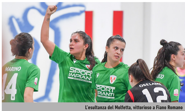
L'esultanza del Molfetta, vittorioso a Fiano Romano

8 ottobre, le biancocelesti sono cadute fragorosamente - ancora una volta a Fiano - sotto i colpi del Molfetta, capace di espugnare 6-3 il PalaPertini e di incamerare, così, i suoi storici primi tre punti in Serie A. Per il Rovigo Orange, invece, è arrivato il terzo pareggio su altrettante gare disputate: è stata la rete di Guti, di fatto, a fissare il definitivo 2-2 tra le venete e le pugliesi dell'Italcave Real Statte. Il Bitonto, nel Saturday night, ha dimostrato di aver digerito senza conseguenze il kappào interno incassato per mano delle campionesse d'Italia in carica: 10-0 è il punteggio con cui le leonesse neroverdi si sono sbarazzate della matricola Irpinia. Nel pomeriggio seguente, l'Audace ha capitalizzato il fattore casalingo e regolato 3-0 la Vis Fondi. Kick Off e Vip si sono equivalse 2-2, con le milanesi, dal canto loro, capaci di rimontare il doppio svantaggio nella seconda metà della ripresa. Dopo l'incontro tra le marchigiane del patron Marco Bramucci e le toscane di Beniero Fanfani è andato in scena il derby abruzzese in PPV tra il TikiTaka Planet e il Pescara, che ha chiuso il weekend della categoria regina con il terzo 2-2 maturato nel medesimo turno: i gol di Eva Ortega e Aline Elpidio hanno risposto alle iniziali