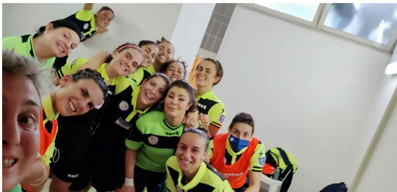
L'esultanza del Progetto Futsal dopo il primo successo nel nazionale