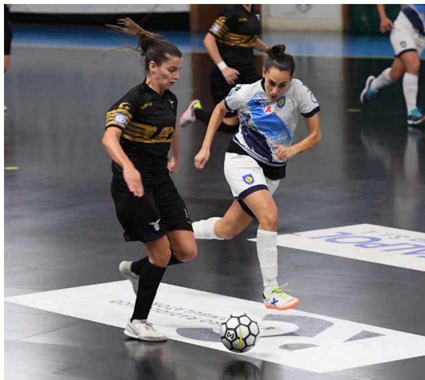
Una fase di gioco di Lazio-Montesilvano