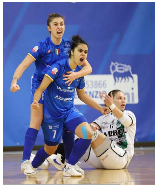
L'esultanza del Falconara nel big match con il Bitonto