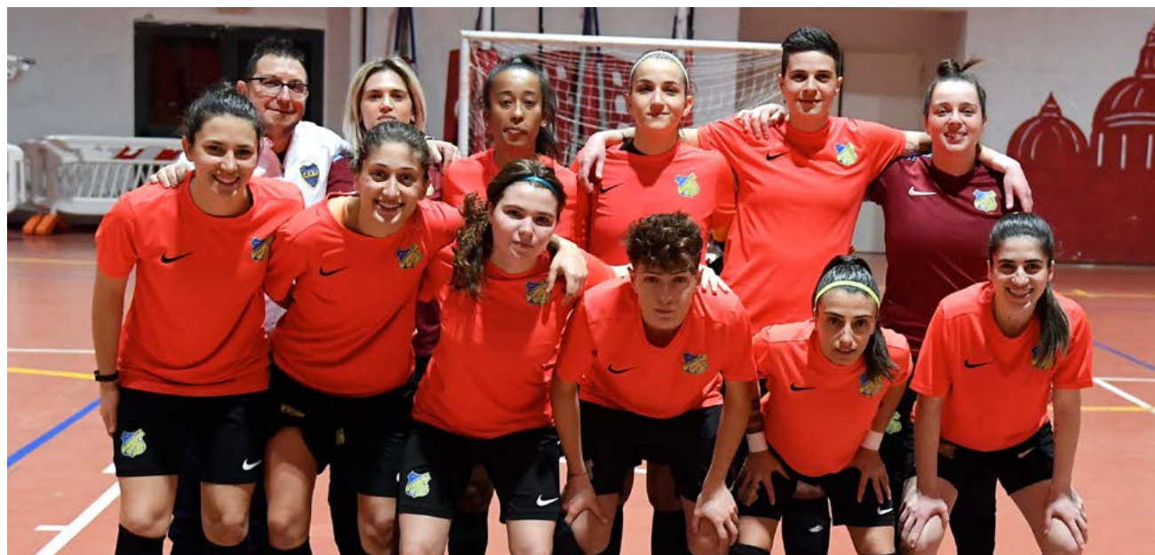
La formazione del Frosinone

LE CIOCIARE CONQUISTANO UNA BELLA VITTORIA CONTRO L'ARZACHENA E PROVANO A RISOLLEVARSI. FILIPPI: "SUCCESSO MERITATO. PER NOI È FONDAMENTALE CONFRONTARCI E AIUTARCI SEMPRE. IL FINALE DI STAGIONE? LOTTEREMO PER OTTENERE RISULTATI POSITIVI"