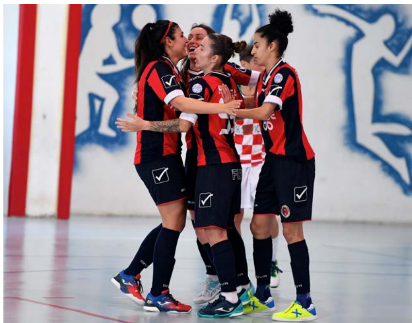
L'esultanza del Real Statte, vittorioso nel doppio confronto con il Cagliari