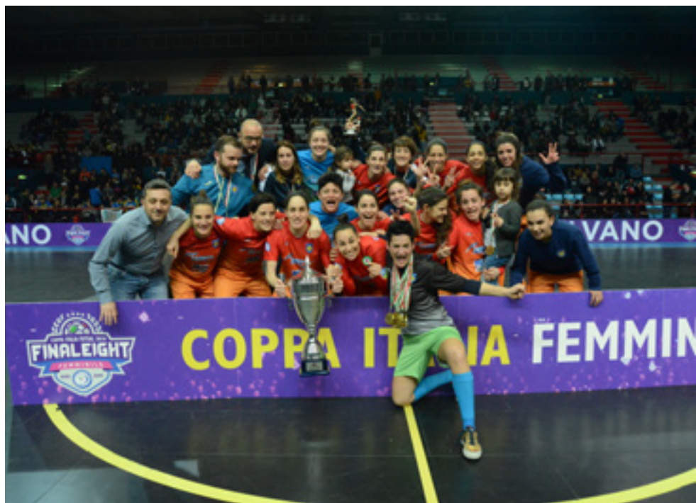
Il Montesilvano vincitore dell'edizione 2018

Dal successo della settimana del futsal in rosa barese, all'edizione "on the road" di quest'anno: è di nuovo tempo di Final Eight per la massima serie del futsal femminile. Si ritorna alla vecchia - ma vincente - formula di qualche anno fa: l'intera kermesse di Coppa Italia raggrupperà la competizione femminile con le due maschili di A ed U19. Una vecchia formula, ma che saprà regalare nuove emozioni e scrivere nuove pagine di storia, in questo tour di futsal che attraverserà le bellezze della pianura padana. L'allineamento per la partenza avverrà in Emilia, con i quarti di Cavezzo, in provincia di Modena; successivamente le contese si sposteranno in Romagna, a Faenza. Ma non tutte le strade portano al PalaCattani. Soltanto quattro delle otto partecipanti riusciranno a varcare i confini ravennati per proseguire la competizione. E soltanto una, alla fine, arriverà al traguardo finale: la Coppa Italia. Teste di serie - Tra le candidate principali a prendersi la scena in quel di Faenza ci sono ovviamente le teste di serie: le quattro formazioni entrate a far parte delle magnifiche otto, dopo aver