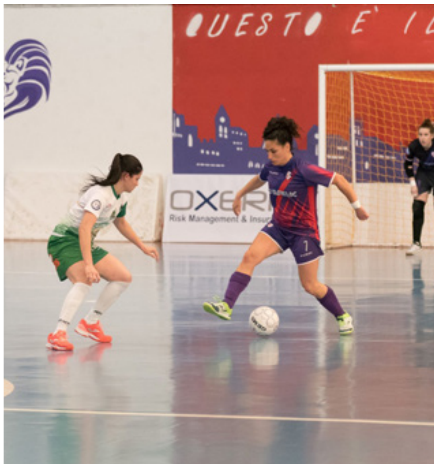
Una fase di gioco di Futsal Florentia-Lamezia

23esimo turno - Al successo esterno all'inglese della Futsal Salinis in quel di Sarcedo, risponde il Kick Off con il tennistico 6-1 di Montemesola. Non sbagliano nemmeno le inseguatrici, che rimangono a contatto con le prime due. Il Montesilvano chiude con un perentorio 9-3 la trasferta a Fano (poker di Dayane); il Futsal Florentia ha vita facile al Palasolotto contro la Royal Team Lamezia, travolto sul 7-2 grazie anche alla tripletta di Renatinha. Non perde il passo la Ternana, che chiude sul 4-1 contro il Bisceglie e aggancia il quinto posto, condiviso ora con lo Statte. Per un Bisceglie che perde colpi, c'è un