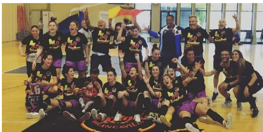
Francavilla neopromosso in Serie A