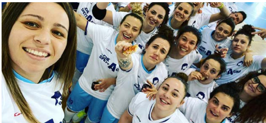
La Best neopromossa in Serie A

Scaletta, non ha approfittato del k.o. esterno per 7-5 incassato dal Rionero contro il Grottaglie; le ioniche di Vito Liotino, perciò, rimangono escluse dal treno playoff.