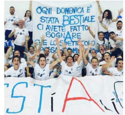
L'esultanza della Best, neopromossa in Serie A

una stagione indimenticabile. Ora ci aspetta la Final Eight, dove proveremo a dire la nostra, ma intanto ci godiamo questo meraviglioso successo".