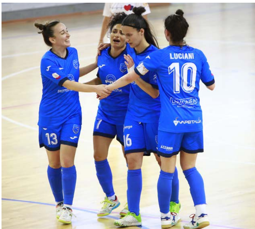
L'esultanza del Falconara vittorioso sul Cagliari