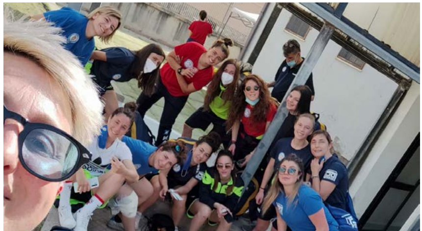
Il Progetto Futsal nella trasferta sarda