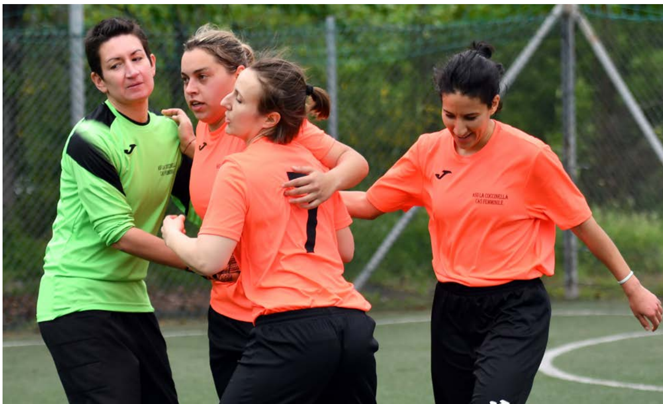
L'esultanza de La Coccinella capolista

Prossimo turno - Il tassametro corre veloce, sbagliare, dunque, diventa un'opzione non praticabile per chi aspira al salto di categoria. Nella quinta giornata, La Coccinella fa visita al Trastevere con l'obiettivo di calare il pokerissimo e compiere un ulteriore passo verso il nazionale. Vietato distrarsi, dunque, per Real Praeneste e Roma: le neroverdi sono ospiti dell'Atletico Tirrena, le giallorosse, invece, preparano il Friday Night sul campo della Littoriana. Chiude il quadro Virtus Fondi-Futsal Pontinia.