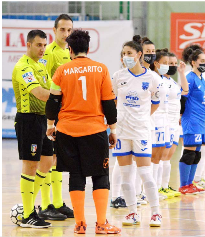
Falconara e Statte prima del fischio d'inizio di gara-1