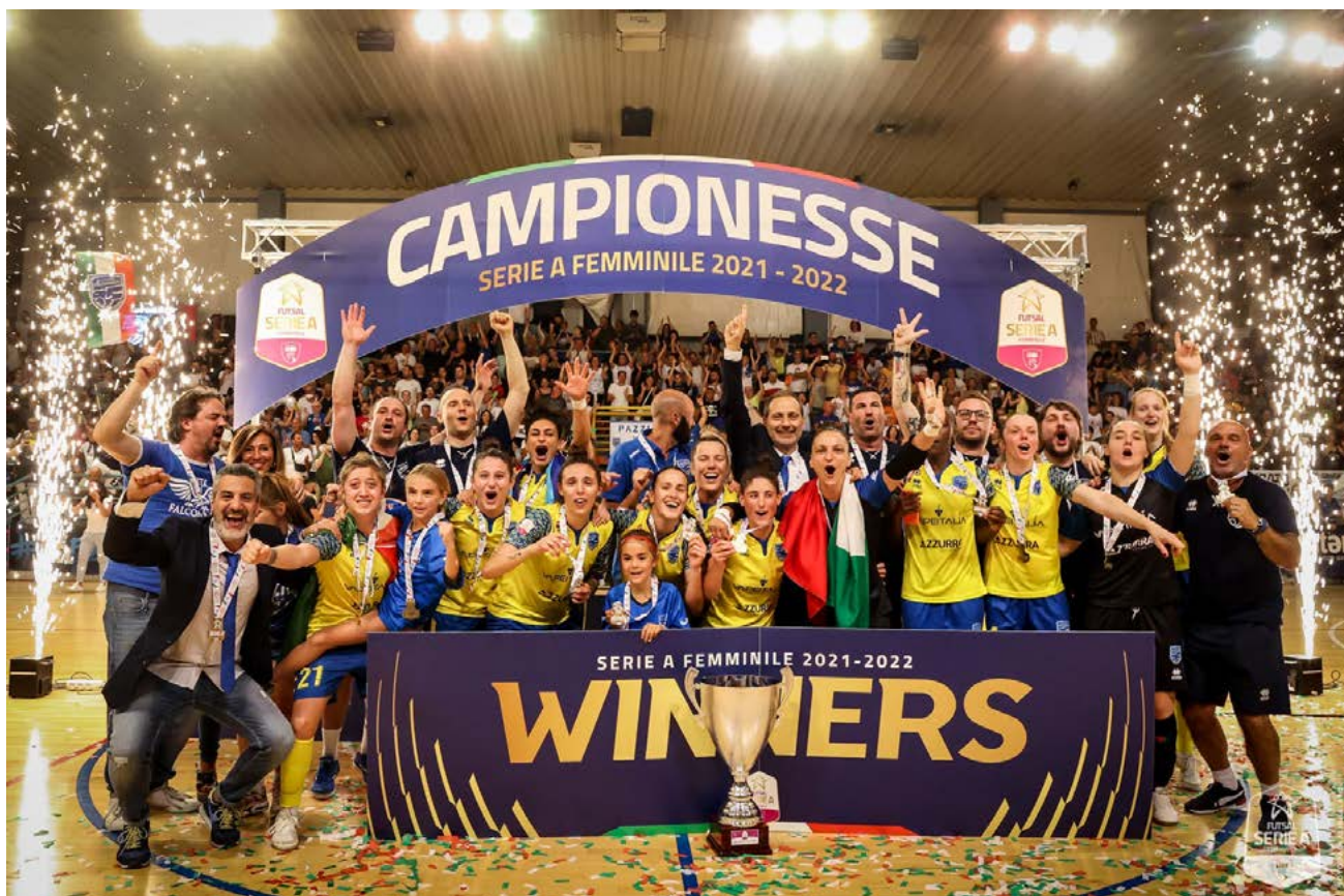
La festa del Città di Falconara, campione d'Italia 2021-2022

Le premesse - Eppure il successo, visto il reboante kappadò per 5-0 in