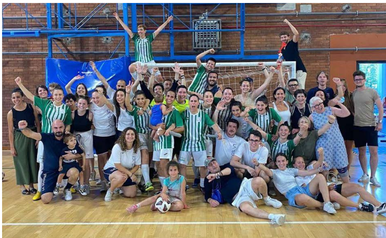
Il Cus Milano neopromosso in Serie A2