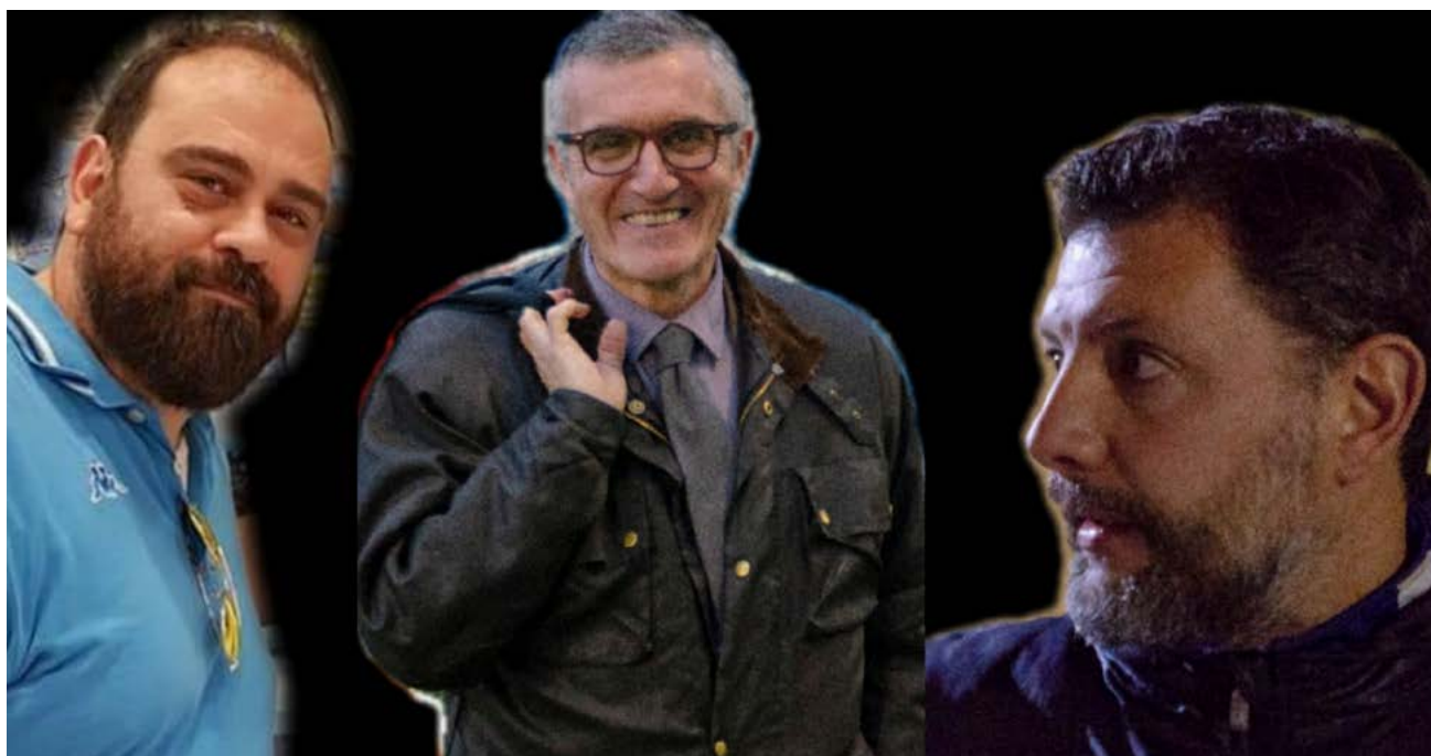
I tecnici del Progetto Futsal confermati

proprio per non lasciare nulla al caso. Le novità, però, non finisco qui: il settore giovanile del Progetto, di fatto, è un cantiere aperto. La creazione di una scuola calcio si tratta di un'idea più che concreta e, da parte della dirigenza, c'è la volontà di aprirla, possibilmente, già dalla nuova annata sportiva. L'U19, infine, potrebbe essere presto affiancata dalle altre selezioni, ampliando così la cantera. C'è gran voglia di ripartire in casa Progetto Futsal. E, soprattutto, di farlo bene.