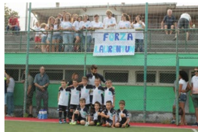
I giovani del Laurentum

i giovani a diventare uomini, avendo sempre rispetto per il prossimo. Per chi non avesse ancora deciso, gli stage al CS Laurentum continueranno fino al 19 ottobre.