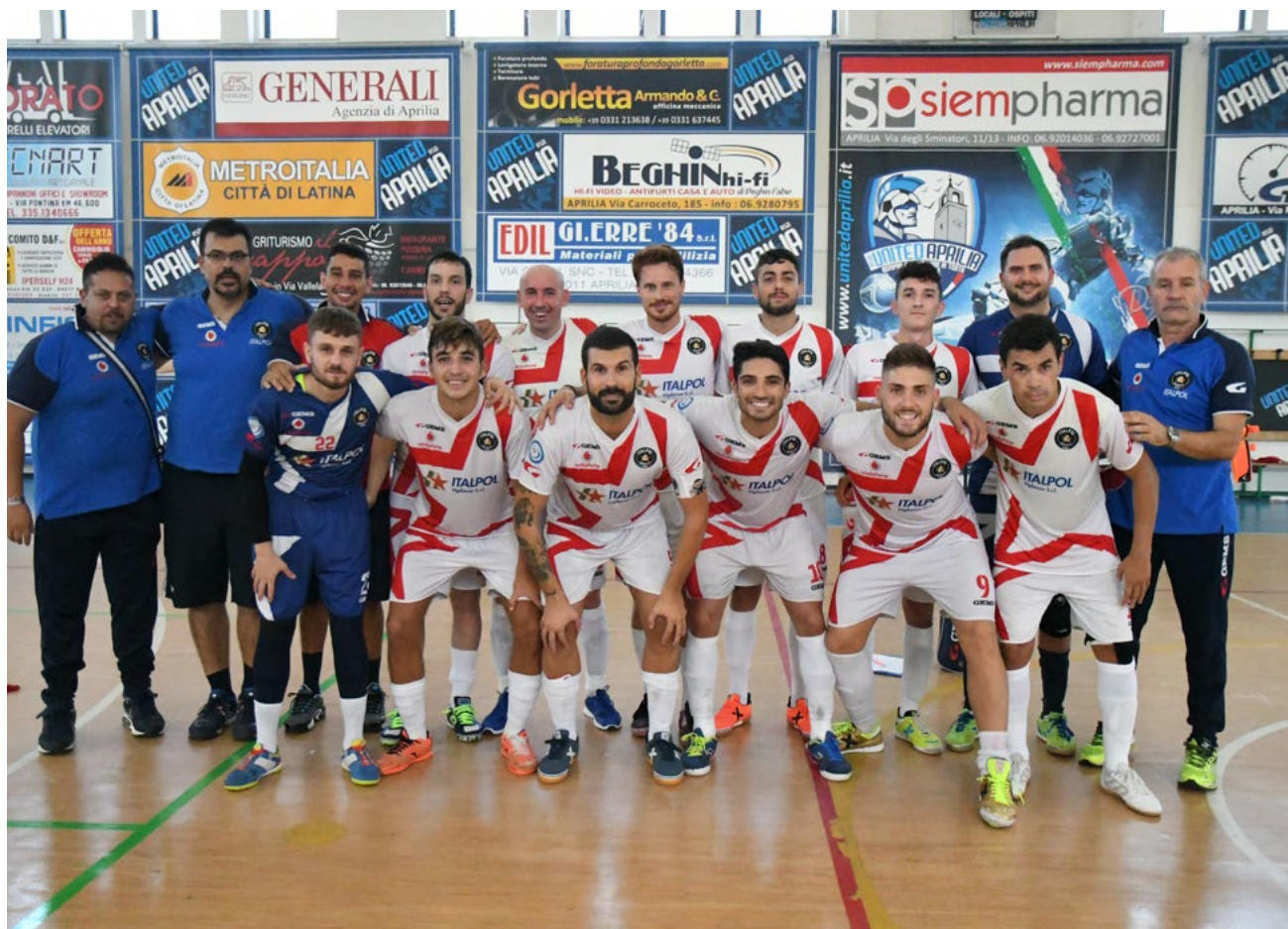
La formazione dell'Italpol vittoriosa ad Aprilia