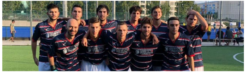
L'Eur Torrino nelle prime uscite stagionali

Nuova realtà - La società, desiderosa di allestire una squadra competitiva, ha affidato