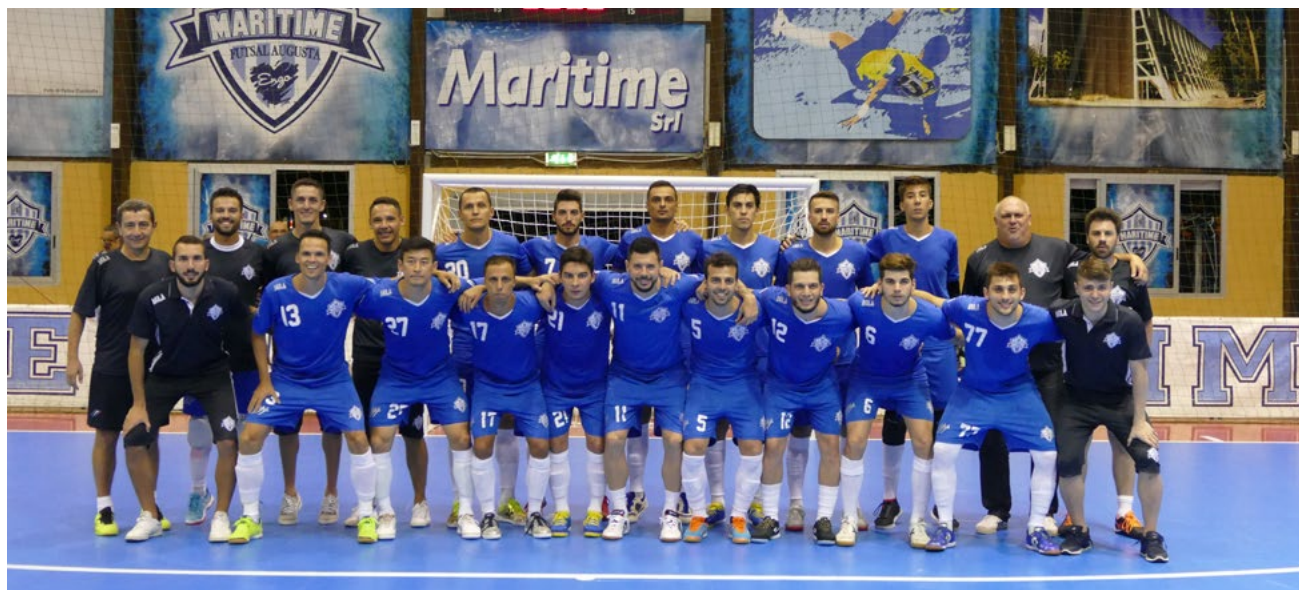
Il MaritIME Augusta 2018-19

CICCARELLO: "SIAMO ORGOGLIOSI DI AVER RIPORTATO LA SERIE A AD AUGUSTA, UNA CITTÀ CHE RESPIRA E MASTICA FUTSAL COME POCHE IN ITALIA". IL PRESIDENTE SOGNA IN GRANDE: "DOVREMO SGOMITARE CON LE MIGLIORI, MA PUNTIAMO IN ALTO"