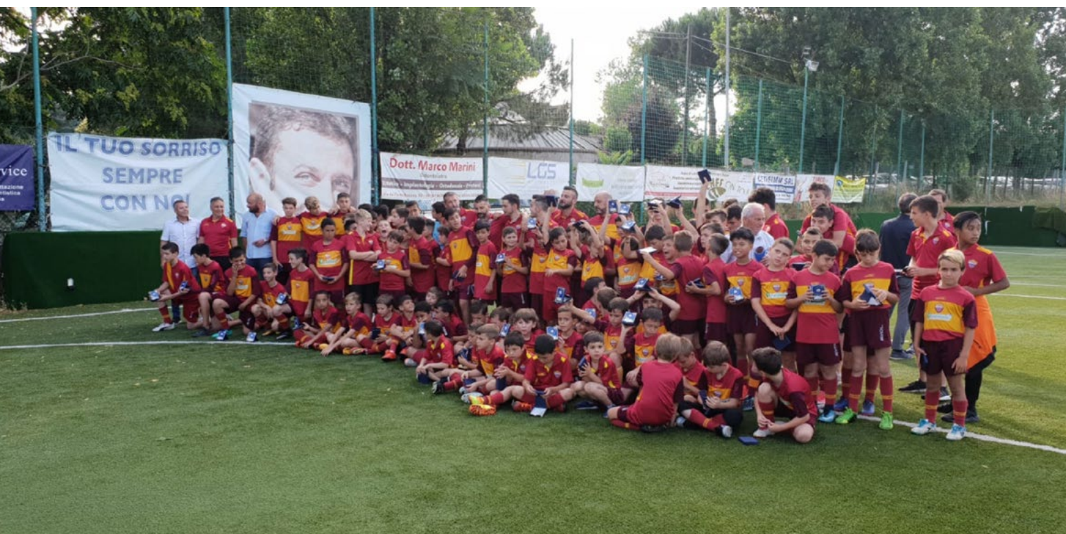
La Scuola Calcio

cose più concrete è ancora presto per parlarne. Per il momento pensiamo a completare la nostra preparazione in vista dei primi impegni ufficiali". La data del primo appuntamento di campionato è fissata per il 19 ottobre, prosegue l'attesa per conoscere i gironi e, di conseguenza, le avversarie. Prima di allora ci sarà modo di testare le capacità dei giallorossi in altri test amichevoli, indispensabili per raggiungere la condizione fisica ottimale. "Per trovare la giusta forma abbiamo ancora tanto tempo e intendiamo sfruttarlo al massimo delle nostre possibilità". La nuova Tevere Roma comincia a prendere forma.