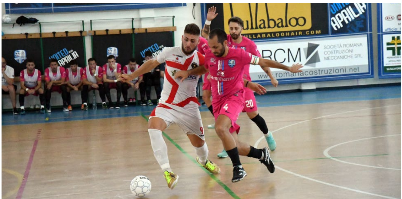
Una fase di gioco di United Aprilia-Italtopol