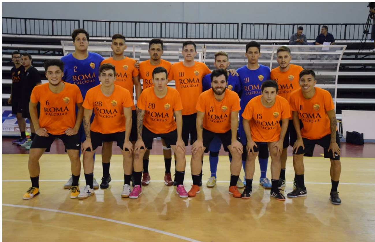
La Roma Calcio a 5 nelle prime uscite stagionali