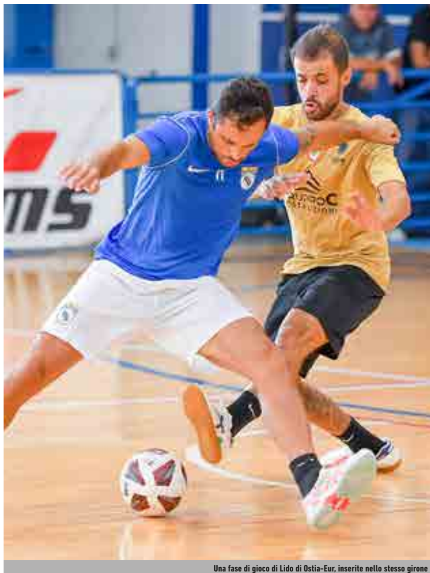
Una fase di gioco di Lido di Ostia-Eur, inserite nello stesso girone