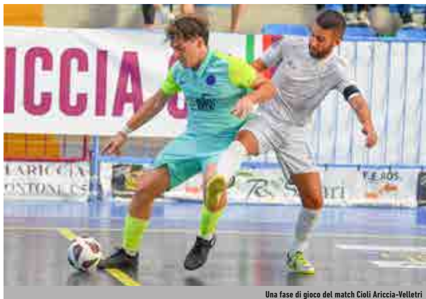
Una fase di gioco del match Cioli Ariccia-Velletri

Esclusioni illustri - L'entrata in scena delle squadre di Serie A2 è favorevole per molte, ma non per tutte. Ben otto formazioni pronte a partecipare alla seconda divisione di calcio a 5 pagano dazio e sono già fuori. L'Aosta cade sotto i colpi dell'Avis Isola, Saints Pagnano battuto dal Videoton Crema, l'ambizioso Città