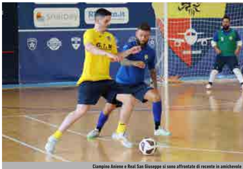
Ciampino Aniene e Real San Giuseppe si sono affrontate di recente in amichevole

una Serie A rivoluzionaria e rivoluzionata. Pronostici? Mai una campana ha vinto lo scudetto: nell'anno zero del futsal italiano, è il sogno del Napoli Futsal, l'obiettivo della Feldi Eboli, senza dimenticare che Sandro Abate e Real San Giuseppe sono competitive. In un campionato senza padrone, però, può succedere di tutto. Un motivo in più per seguirlo su SKY (che ha raddoppiato le dirette) o su Futsal TV e le sue 460 gare in streaming.