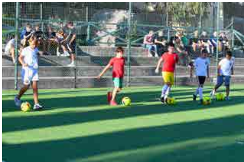
La scuola calcio targata Marino Academy