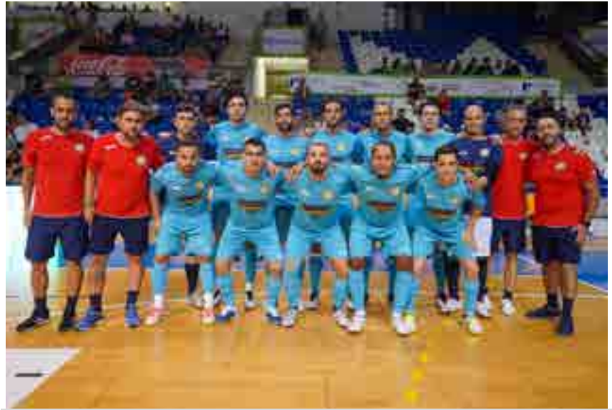
La formazione del Napoli che ha affrontato il Palma in amichevole