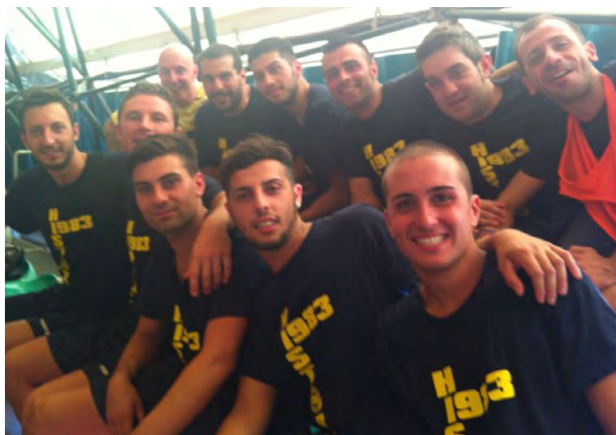
La Serie D nel triangolare con La Pisana e Futbolclub