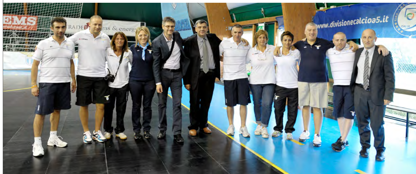
La dirigenza della Lazio Femminile