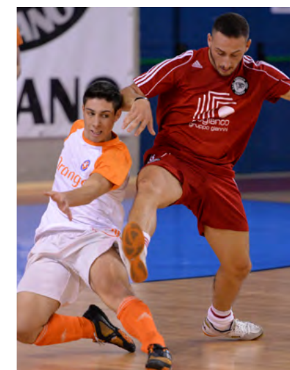
Il match con il Futbolclub