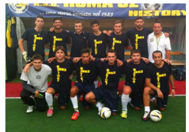
L'Under 21 contro il Colli Albani