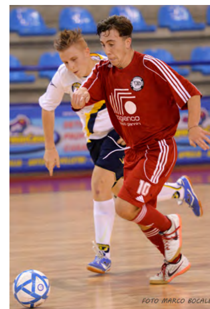
L'amichevole con l'History Roma 3Z

'98, addirittura tre anni più piccoli della media, che si sono ben comportati contro una squadra che era più rodada rispetto a noi. Si sono visti i frutti dell'ottimo lavoro svolto nelle precedenti settimane e questo mi rende molto felice, per cui non posso far altro che ringraziare i miei ragazzi perché sono stati eccezionali". L'obiettivo di un qualsiasi settore giovanile è quello di far crescere i propri giovani, ma in casa Cogianco è diverso. La Juniores, ad esempio, ha come intenzione quella di tornare quanto prima a disputare il campionato d'Elite: "Vogliamo tornare nei campionati che ci competono perché è nel dna della nostra società, ma non scordiamoci che il traguardo primario è quello di dare ad