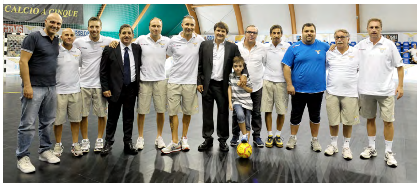
Lo staff della Lazio maschile al gran completo