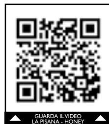
GUARDA IL VIDEO LA PISANA - HONEY