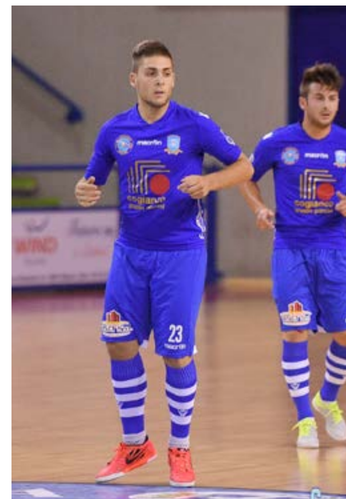
Batella, ha esordito sabato ad Acireale