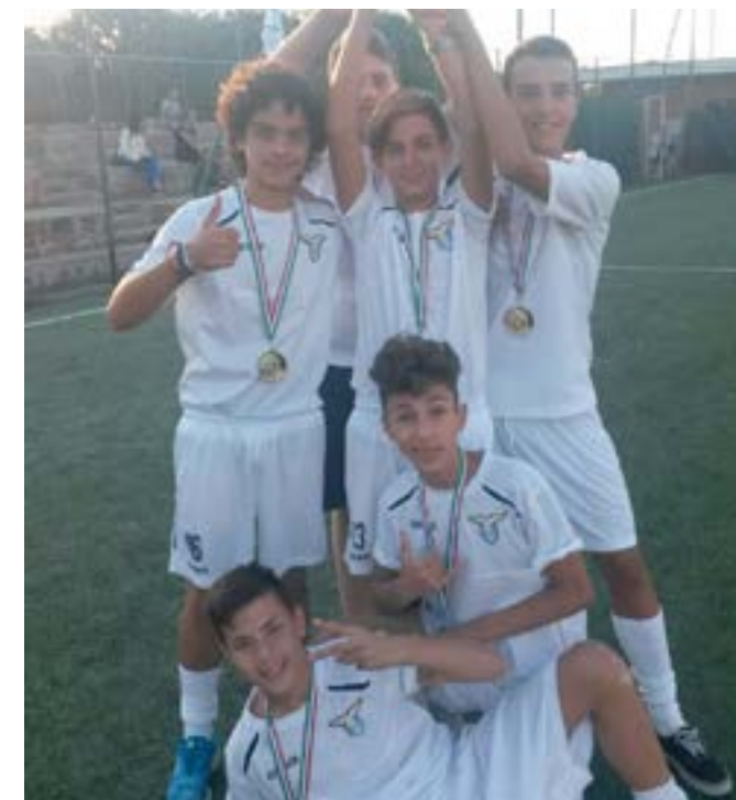
I Giovanissimi vincitori del Torneo