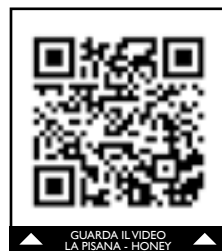
GUARDA IL VIDEO LA PISANA - HONEY

Città di Fiumicino - Riguardo all'imminente futuro, sai già chi ti aspetta? "Quanto alla prossima partita, conoscendo alcuni nomi, non dubito che sarà difficile ma noi pensiamo a lavorare in settimana perché abbiamo messo la prima pietra ma manca ancora molto al nostro obiettivo!".