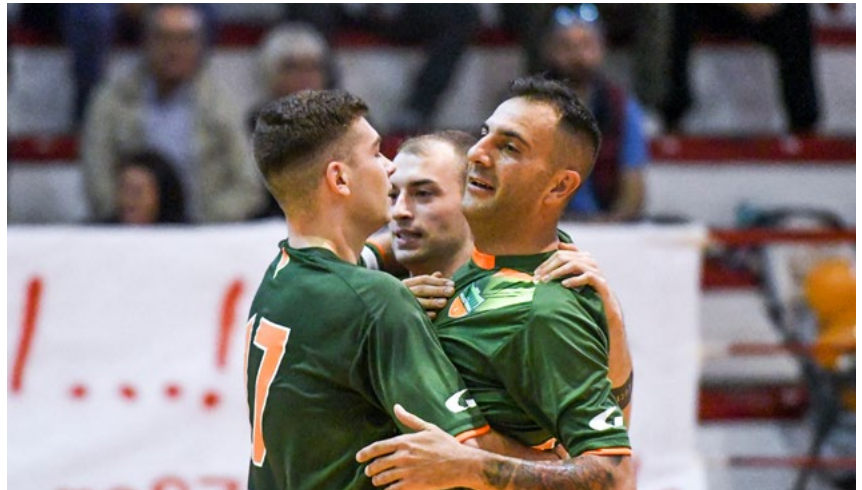
L'esultanza dello Sporting Palestrina, capolista del girone B

Il Real Arcobaleno passa 5-1 a Zagarolo e, sfruttando anche il 4-4 nel posticipo tra Arca e AMB Frosinone, guadagna due posizioni. Primo acuto per il Città di Colleferro, che infligge un rotondo 7-0 al Real Città dei Papi. Nel quinto turno, il Palestrina è ospite dell'AMB Frosinone, giocano fuori anche Supino e Ardea, di scena sui campi di Real Città dei Papi e Nuova Paliano.