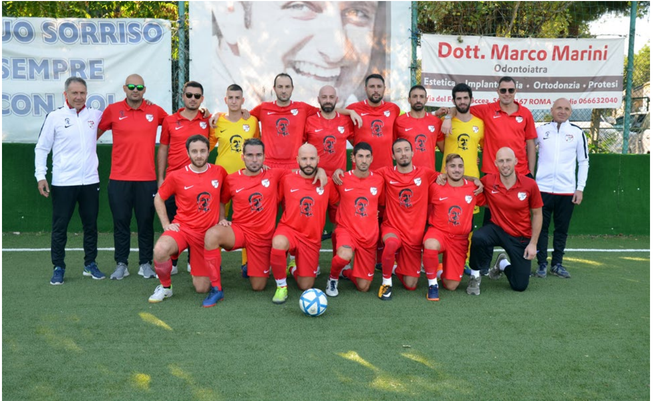
La formazione de La Pisana

e voglia di sacrificio. Andremo a casa loro inconsapevoli del campo e dell'avversario, quindi sarà importante avere il giusto atteggiamento ed essere molto concentrati per tutta la sfida. Questo discorso vale anche per il ritorno: per passare il turno c'è bisogno di concentrazione per tutti i 120 minuti - continua il presidente -. La Coppa è così, non si sa mai quello che può succedere, è come