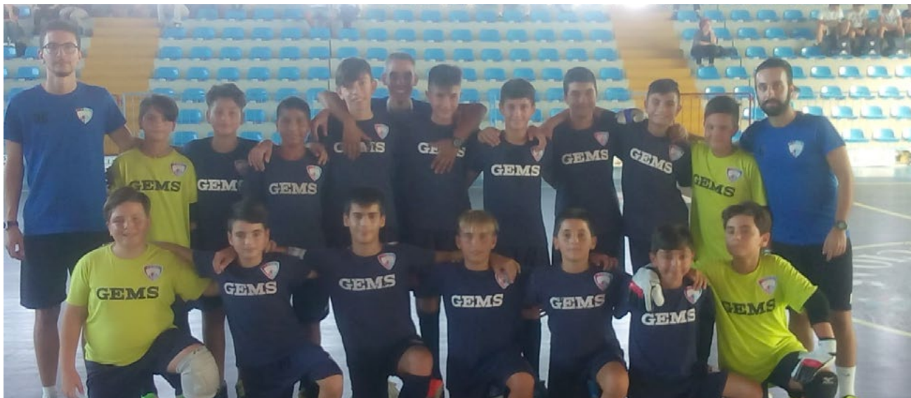
La formazione Under 15 della Cioli