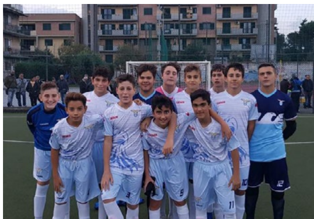
L'Under 15 regionale

LA FORMAZIONE DI REALI SUPERA 2-1 LO SPORTING JUVENIA E CONQUISTA IL PRIMO SUCCESSO DELLA STAGIONE. L'U17 ÉLITE SI PRENDE LA VETTA, L'U15 ÉLITE RIALZA SUBITO LA TESTA. BENE U21 E U15 REGIONALE, CADE, INVECE, L'U17 REGIONALE