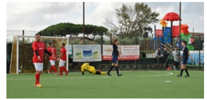
Una fase di gioco di Castel Fontana-Velletri

Girone B - Turno doppiamente positivo per il Carboagnano: i viterbesi difendono il primato con il sofferto 4-3 ai danni dell'Aranova e, grazie alle frenate di molte rivali, salgono a +2 rispetto alla seconda posizione. Dopo il sesto turno, la diretta inseguitrice del team di Cervigni è la Nordovest: la formazione di Rossi piega 6-4 la Spes Poggio Fidoni e, in un colpo solo, sale tre gradini di una classifica cortissima. La Pro Calcio, infatti, non va oltre il 4-4 interno a Via Delle Nespole con lo Sporting Hornets e si fa agganciare sia dal CCCP, vincente 7-4 sul Real Fabrica, sia dalla Vigor Cisterna, corsara 5-2 in quel di Ciampino con il Real. Perde terreno anche l'Albano, che incappa nel terzo k.o. consecutivo: la Virtus Fenice regola 7-2 i castellani, raggiunti peraltro a quota 9 da un Cortina a segno 6-1 sul TC Parioli. Il primo sabato di novembre mette di fronte prima e seconda anche nel girone B: al Virtus Antica Aurelia, la Nordovest progetta il sorpasso sul Carboagnano, che, di contro, può volare via. Scontri diretti anche tra le squadre dal terzo all'ottavo slot della graduatoria: Real Fabrica-Pro Calcio, Vigor Cisterna-Cortina e Albano-CCCP valgono un posto al sole nella tempestosa battaglia per le posizioni di vertice.