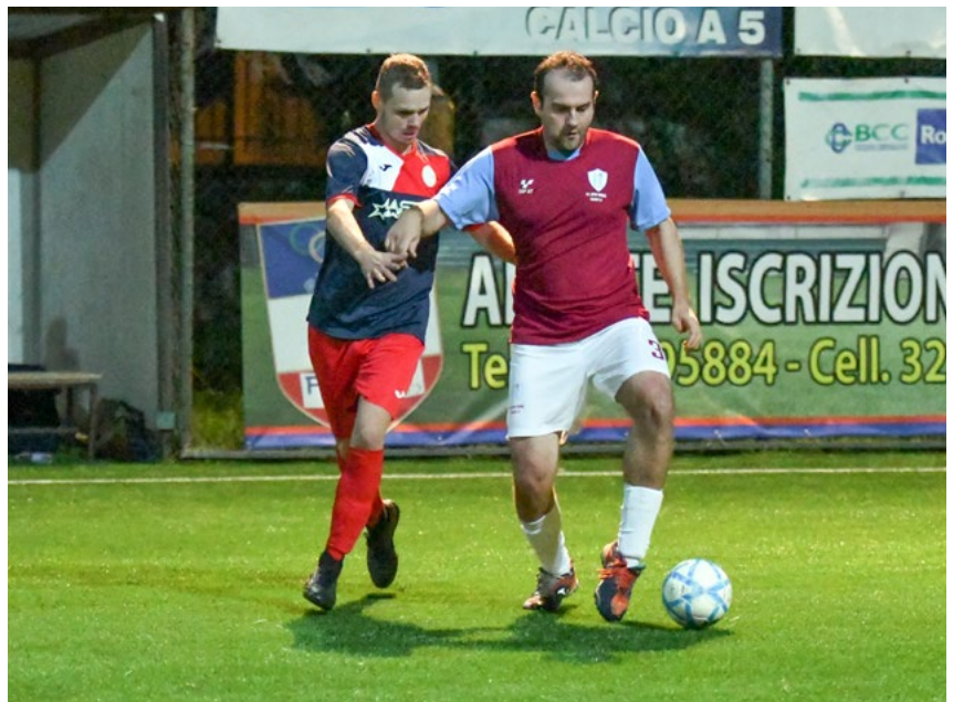
Una fase di gioco di Eur Torino-Città Eterna