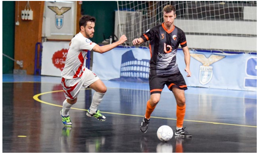
Una fase di gioco di Italpol-Active