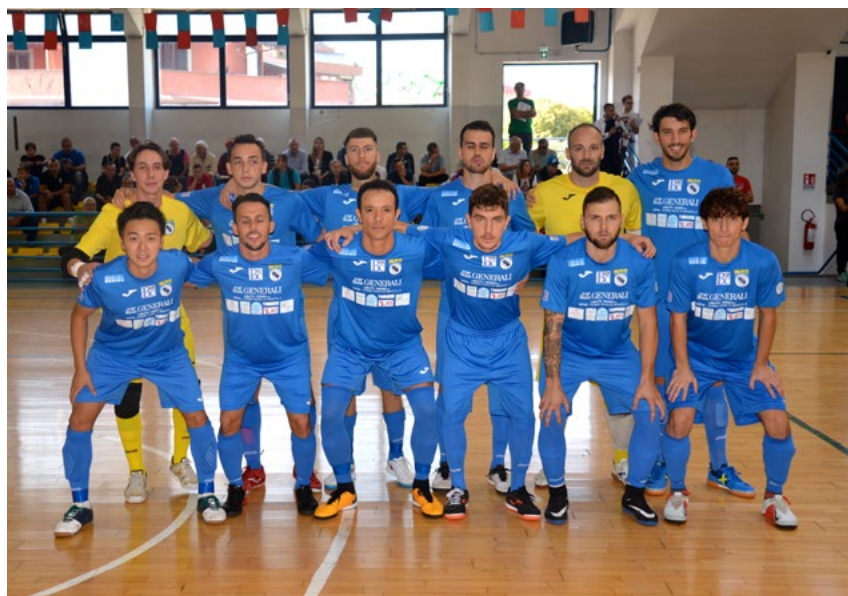
La formazione del Lido di Ostia