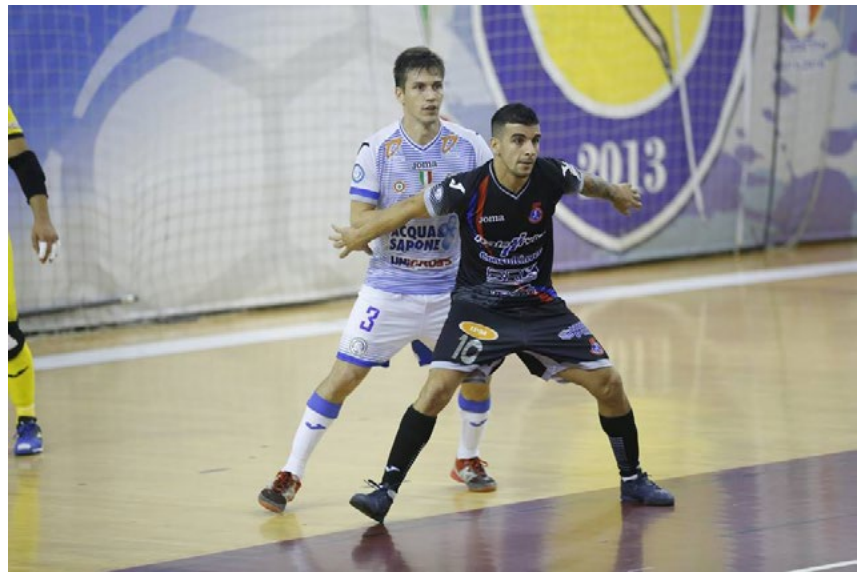
Una fase di gioco di Acqua&Sapone-Pesaro

Si, stupendo - La sesta giornata di regular season promette ancora più spettacolo. Al PalaPizza, altro scontro fra Sorelle, perché il trittico di fuoco dei rossiniani (Napoli e A&S, una dopo l'altra) si conclude con la super sfida contro quel Real Rieti che, insieme al Maritime Augusta, ha approfittato del