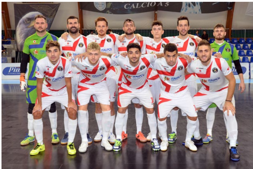
La formazione dell'Italpol che ha affrontato l'Active Network