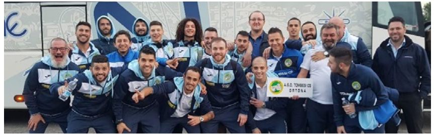
L'esultanza della Tombesi, vittoriosa a Prato

L'ultimo turno di A2 vede i gironi declinare, in vario modo, il primato in classifica, tra chi vola, chi inciampa e chi esercita diarchie. Il Sestu si esalta e costringe al pari il Mantova capolista: il Petrarca si avvicina, il Carrè va subito sotto ma poi chiude agevolmente la pratica Leonardo, Itria rimane a secco e l'Asti cade. Merano batte Milano, meneghini davanti solo alle altre due sarde. Tombesi salda in testa al gruppo B, grazie al successo all'EstraForum di Prato; Cefalù formato Real col Grosseto: terza vittoria e seconda piazza solitaria; il Lido, sorpreso dal Pistoia, incappa in un pari. Di Eugenio e l'Olimpus a valanga sul Ciampino, acuto Cioli. L'Aniene 3Z vince al PalaFrascati e lascia le sabbie mobili. Le crisi tecniche del gruppo C della scorsa settimana non creano danni a Sandro Abate e Marigliano, Vega e Signor Prestito sul velluto a Bisceglie. L'ex quartetto di