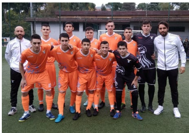
La formazione Under 21

Élite - Sorridono entrambe le formazioni impegnate nei gironi Élite. L'Under 17 regola per 4-2 il Savio e approfitta del pareggio della Roma per prendersi momentaneamente