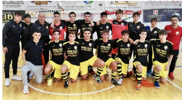
La formazione Under 19