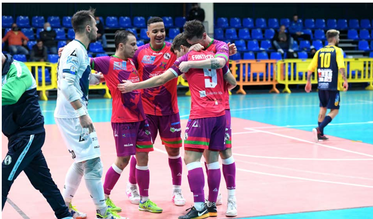
L'esultanza del Sandro Abate dopo il blitz di Ostia