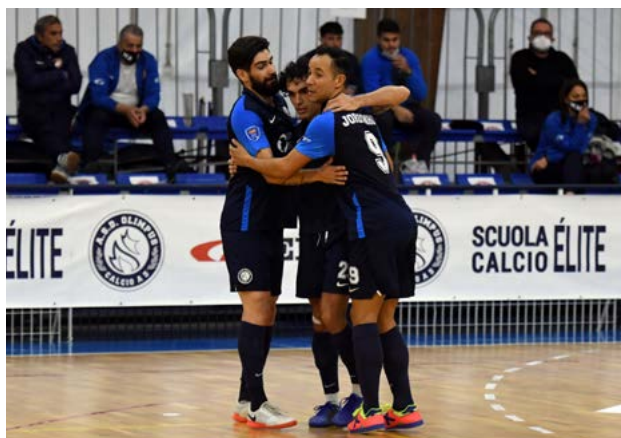
L'esultanza dell'Olimpus, neo capolista del girone B

Girone C – Baricello fa volare il CUS Molise con un poker: domato il Cobà e scavalcato il Manfredonia, costretto ai box e agganciato da un super Lucrezia, spietato e sorprendente nel derby marchigiano con la Tombesi. Primo acuto per la Vis Gubbio, che annichisce il