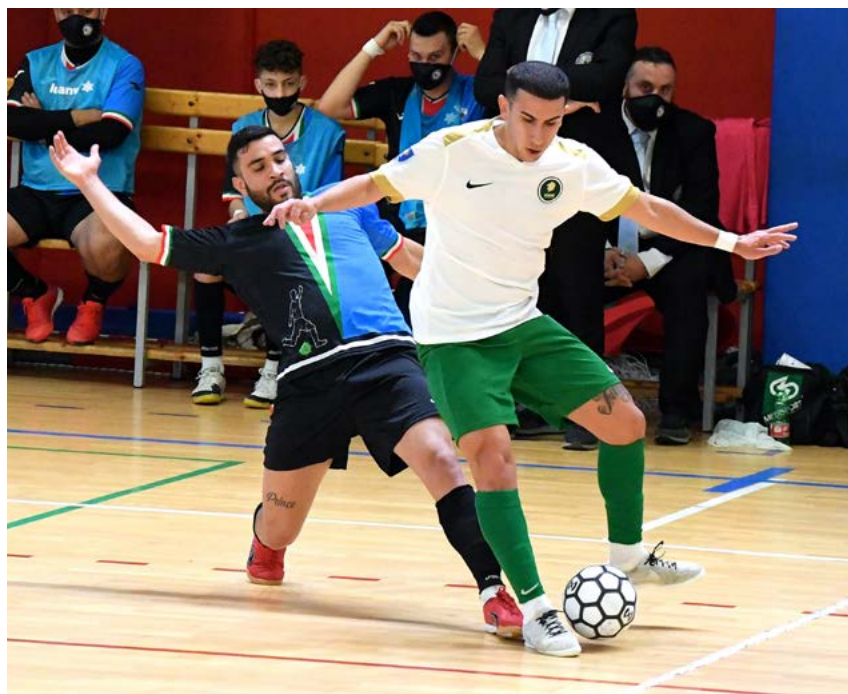
Una fase di gioco di Eur Massimo-Forte Colleferro