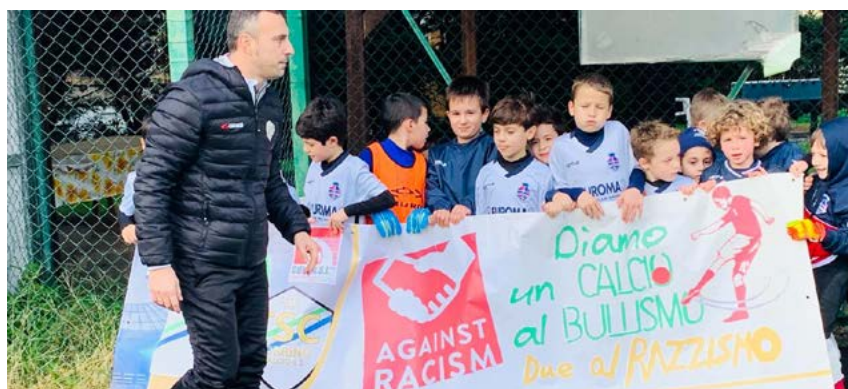
La scuola calcio del Torino

senso, ha una grande rilevanza per i valori di inclusione e fratellanza che sa trasmettere. Anche noi tecnici abbiamo un ruolo importante. Lo sport è inclusione, con i nostri insegnamenti possiamo dare una grande mano".