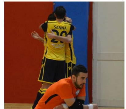
L'esultanza dell'Aniene 3Z nella vittoria con la Cioli