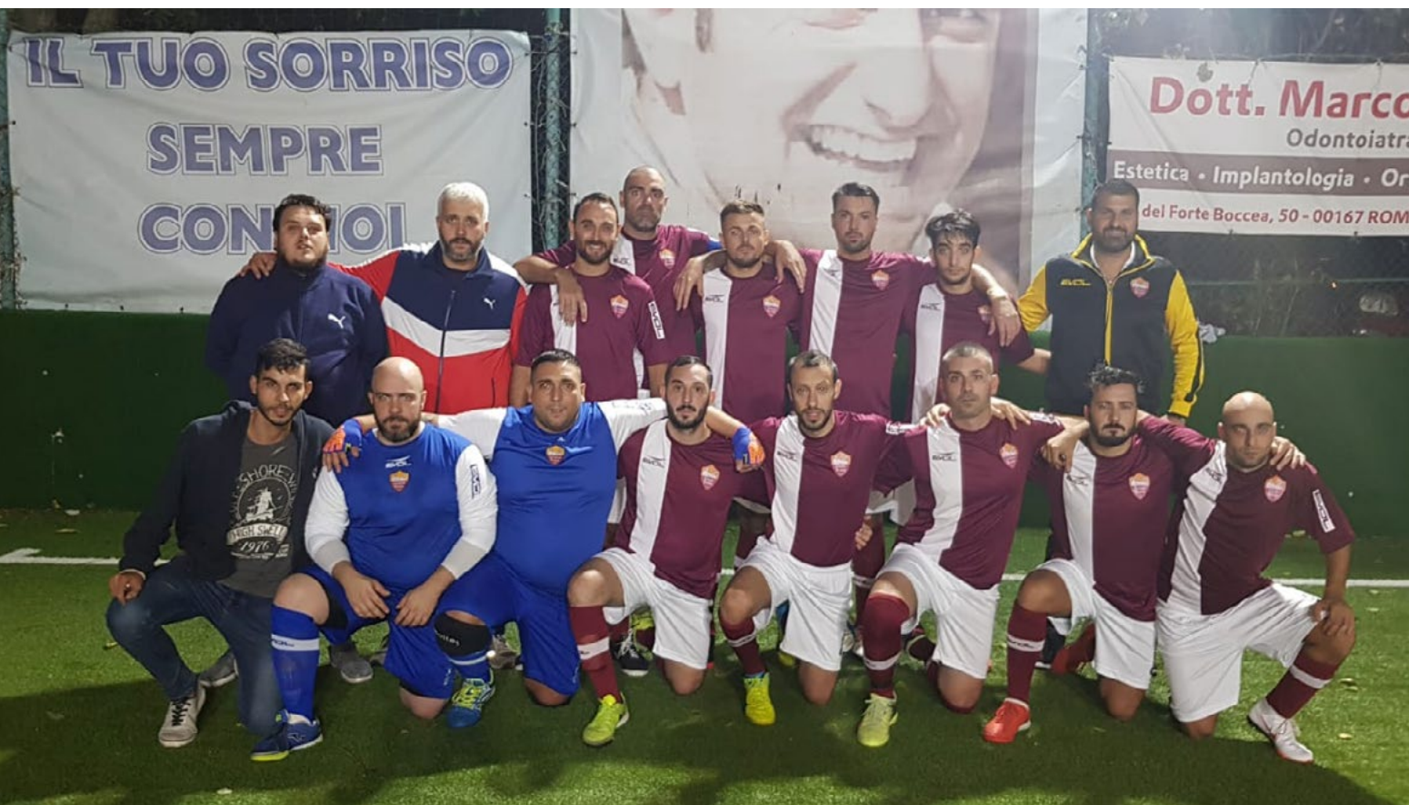
La formazione della Tevere Roma

con il miglior attacco del gruppo D (Spes Montesacro con 26 gol fatti) che sfida il miglior reparto difensivo (solo 3 gol subiti dalla Tevere Roma). "Al momento del fischio finale con la Tevere Remo, ci siamo messi subito a pensare a questo incontro. Siamo concentrati e determinati. Proveremo a sfruttare lo slancio emotivo di questo momento positivo". Una grande prova di maturità attende la banda giallorossa.