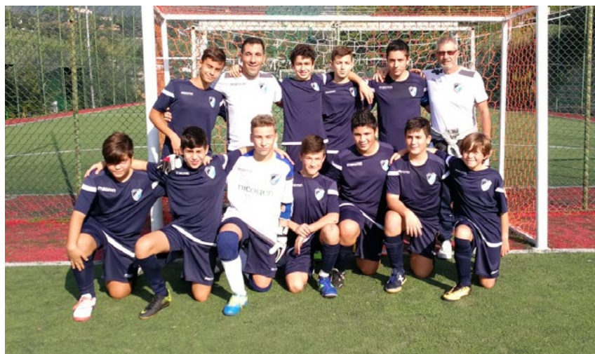
La formazione Under 15 del Genzano