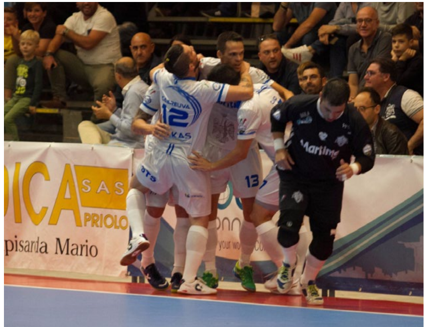
L'esultanza del Maritima capolista

Carpe diem - Polido, appena subentrato a Cabral, può mantenere il primato in casa con quel Came Dosson reduce dal roboante successo (il primo) nel derby, approfittare della temibile trasferta dell'imbattuto Italservice Pesaro nell'infuocato catino del PalaDirceu di Eboli e prendere punti sicuramente a due Sorelle, Rieti e A&S. Che incroceranno i propri destini soltanto il 18 dicembre, causa gli impegni europei dei campioni d'Italia, pronti a prendere il prestigioso pass della Final Four di