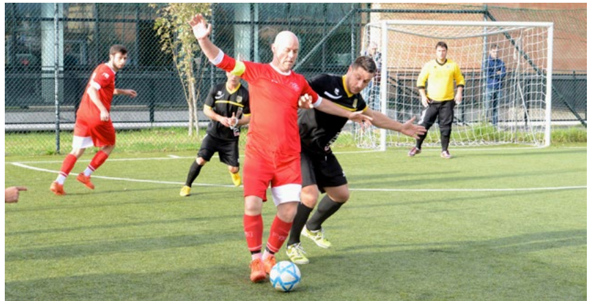
Una fase di gioco di Real Roma Sud-Atletico 2000