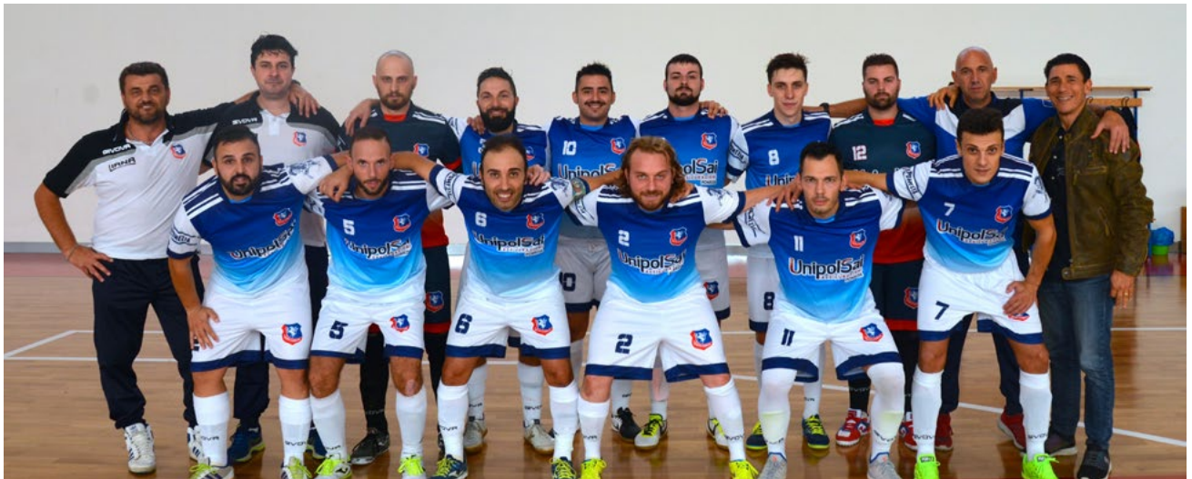
La formazione del Penta Pomezia