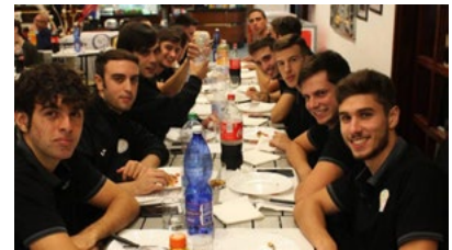
L'Eur Torrino a cena