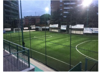
Il nuovo impianto del TSC