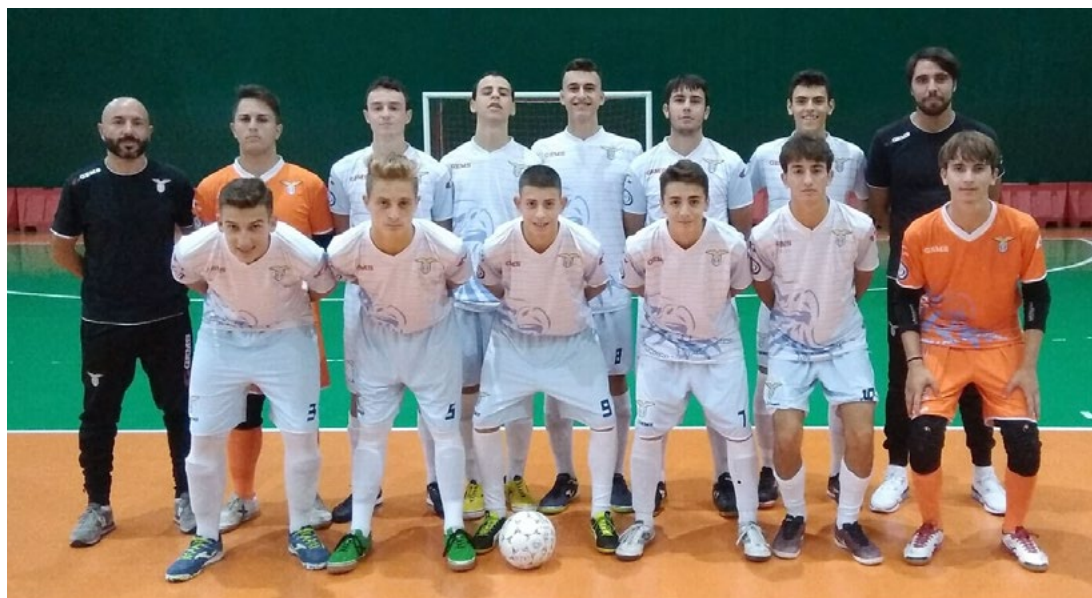
La formazione Under 17

Campionati Élite - Colpaccio dell'Under 17,