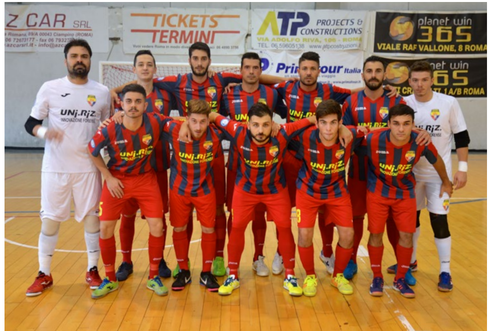
La formazione del Ciampino Anni Nuovi in una delle recenti uscite stagionali