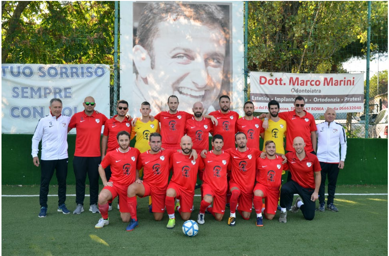
La formazione de La Pisana