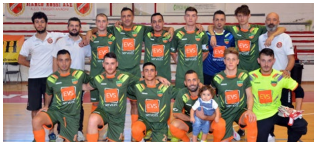
La formazione dello Sporting Palestrina