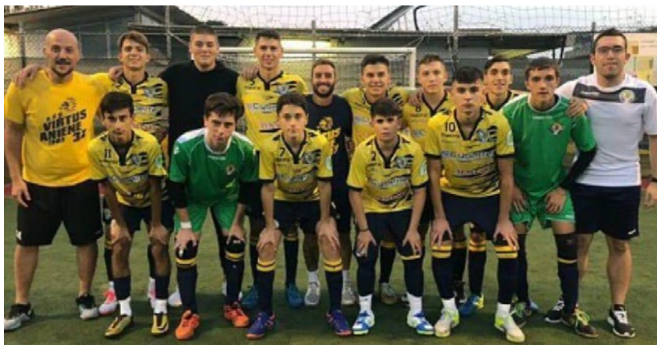
La formazione Under 17