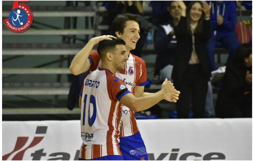
L'esultanza del Pesaro