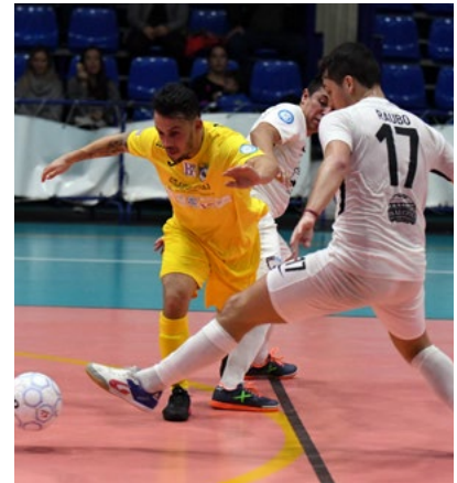
Una fase di gioco di Lido-Cioli