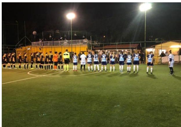
L'Under 19 femminile Regionale

Volano le formazioni del settore giovanile biancoceleste. Cinque successi e un pareggio tra venerdì e lunedì, per una Lazio protagonista e al vertice con tutte le sue categorie.