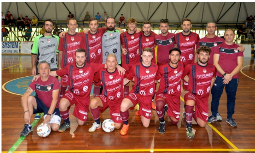
La formazione del Città di Zagarolo