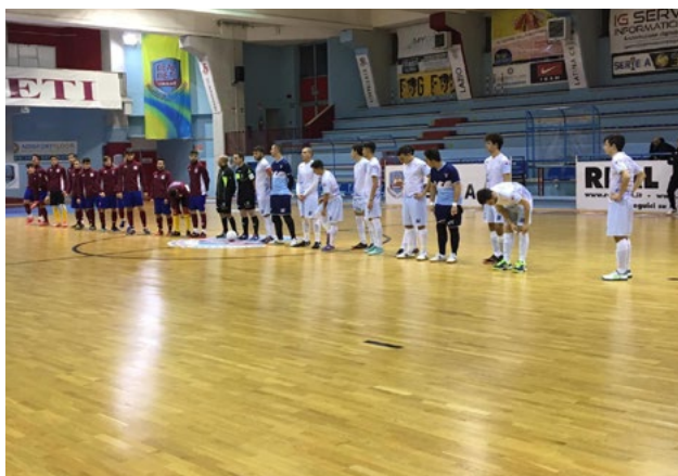
L'Under 19 maschile

UN ALTRO SPLENDIDO WEEKEND PER IL SETTORE GIOVANILE BIANCOCELESTE. L'UNDER 19 SUPERA NETTAMENTE IL RIETI E AGGANCIA LA ROMA IN VETTA AL GIRONE M, L'UNDER 17 ÉLITE CONFERMA IL PROPRIO PRIMATO, L'UNDER 15 ÉLITE RAGGIUNGE IN TESTA L'ANIENE 3Z