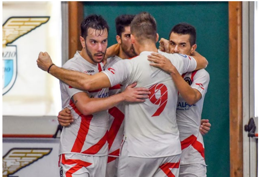
L'esultanza dell'Italpol, solo al secondo posto del girone E

Sostanza e sorpassi - Sette vittorie in sette gare, +30 in differenza reti, un'altra prestazione di estrema sostanza. Lo scettro del girone E resta nelle mani dell'Active Network: Ceppi rifila cinque gol, senza subirne, allo Sporting Juvenia e vede scoppiare la coppia di inseguitori dirette. Già, perché l'Atletico New Team incappa nel secondo k.o. di fila in quel di Colleferro, dove la Forte festeggia il primo acuto interno, e scivola a -6 dalla vetta: l'Italpol tiene la scia della capolista grazie al comodo 10-1 al Foligno, ispirato dalla sestina di Ippoliti; ne approfitta anche il Futsal Futbol Cagliari, che sale sul podio