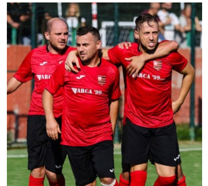
L'esultanza del Real Castel Fontana