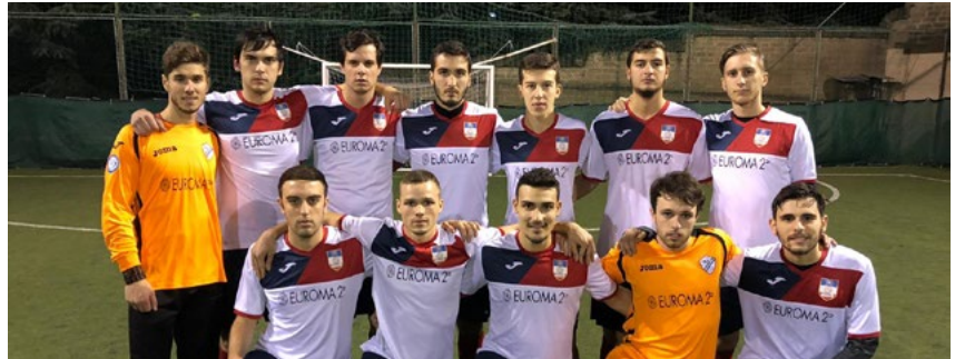
L'Eur Torrino che ha affrontato l'Empire

Pari amaro - Il Torrino chiude il primo tempo sullo 0-2, grazie alle reti di Favaretti e Pagliaro. Da segnalare la momentanea interruzione del match, avvenuta al 18', per mancanza di illuminazione: dopo quasi venti minuti riprende la partita, con gli animi che si