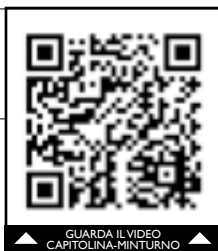
GUARDA IL VIDEO CAPITOLINA-MINTURNO