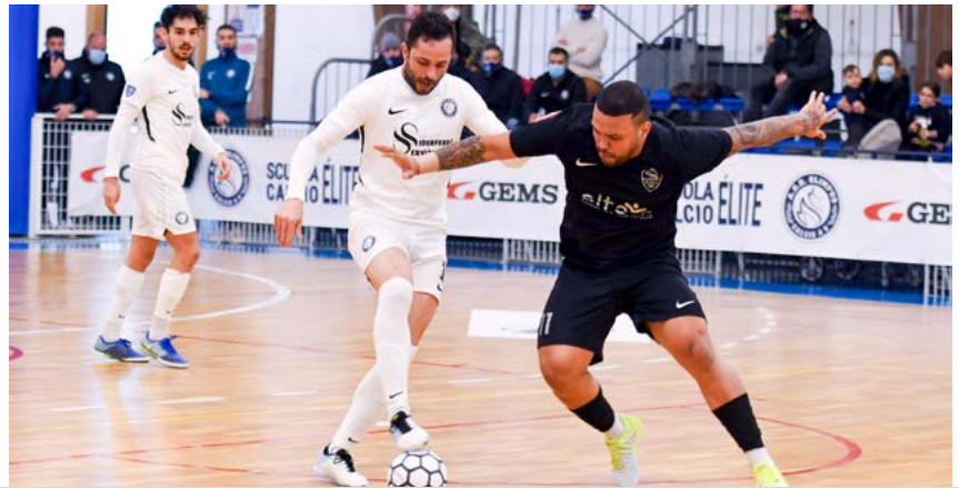
Una fase di gioco di Olympus-Roma