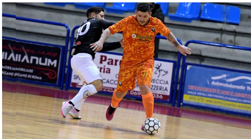
Una fase di gioco di Ecocity Cisterna-Benevento