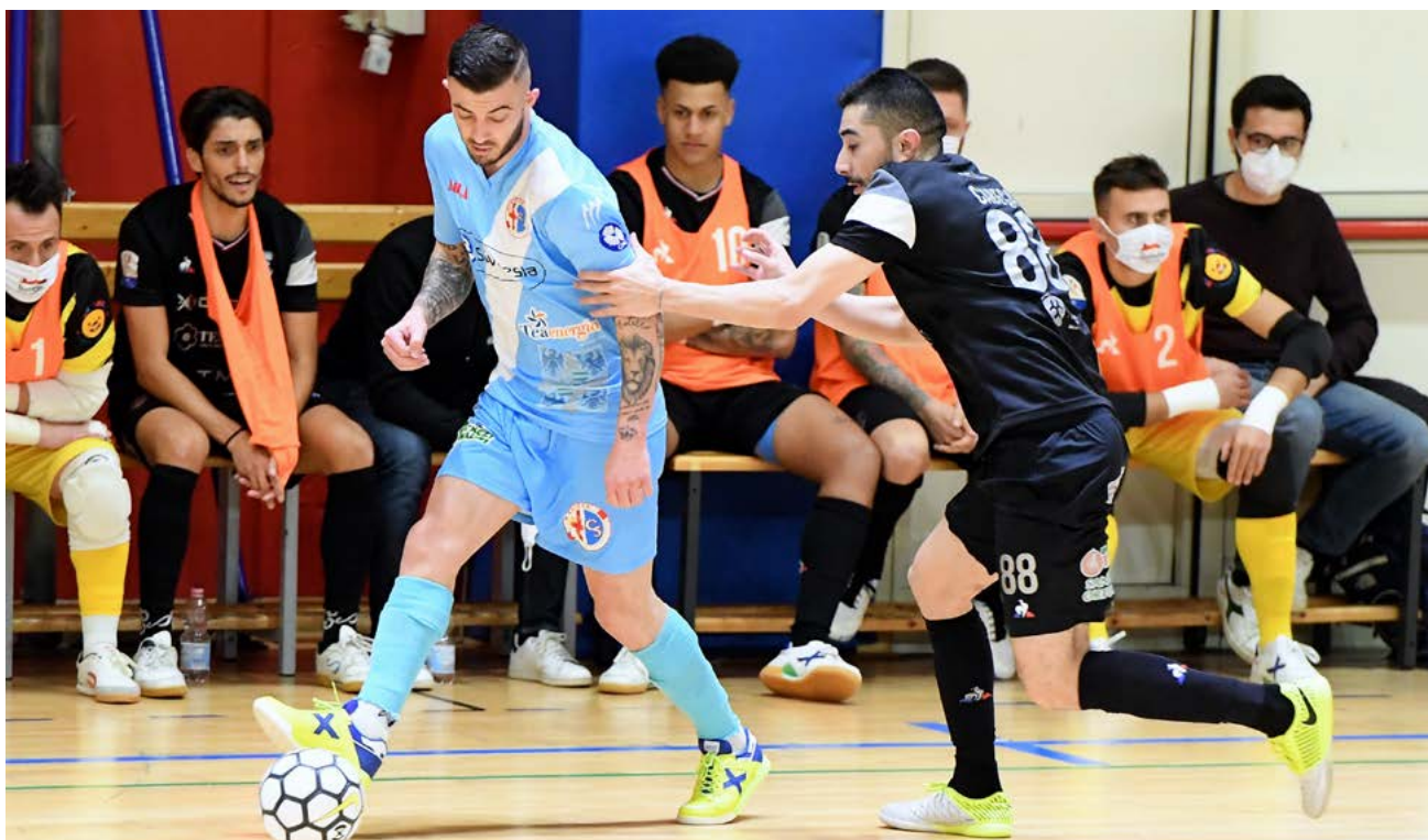
Una fase di gioco di Cybertel Aniene-Mantova

Le altre - Si va in pausa con un Petrarca quarta forza del campionato, un CMB in grande spolvero, un Sandro Abate così e così, Meta su e Feldi giù. Un grande Lido (5 risultati utili prima della preventivabile sconfitta di Pesaro), Mantova scricchiolante che fa rima con San Giuseppe preoccupante. Cybertel Aniene in difficoltà ora ma a pari punti con un Colormax Pescara in crisi. CDM ultimo, ma vivo. Come l'Azzurro della Max Italia, pronta all'esordio di Prato contro il Montenegro.