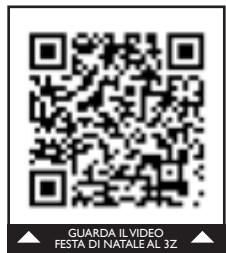
GUARDA IL VIDEO FESTA DI NATALE AL 3Z