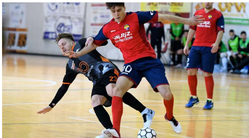
Una fase di gioco di Ciampino Anni Nuovi-Active Network

Girone B - L'Olimpus trita il Leonardo e conserva il +7 sul Ciampino, bello e vincente con l'Active. Roma da applausi: il blitz in casa del 360GG vale l'aggancio ai sardi e al quarto posto. L'Italpol regala una Mirafin sempre più ultima, la Nordovest trova tre punti d'oro sull'isola, spazzando via il Sestu.