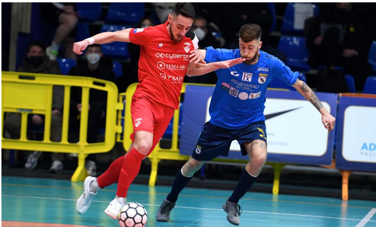
Una fase di gioco del derby Lido-Aniene