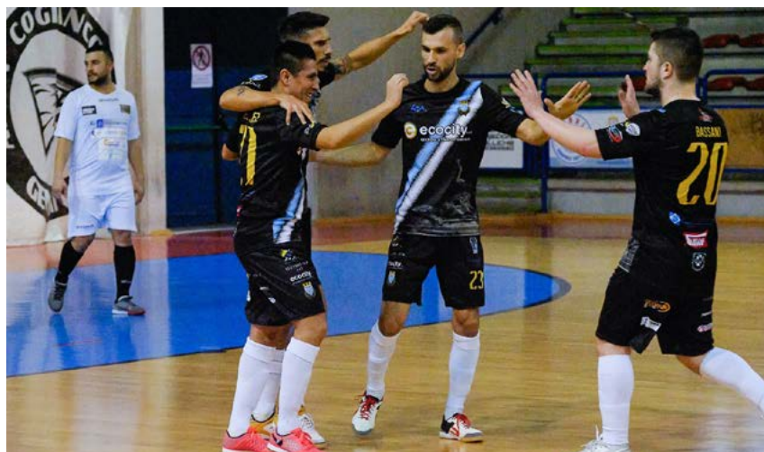
L'esultanza dell'Ecocity Cisterna