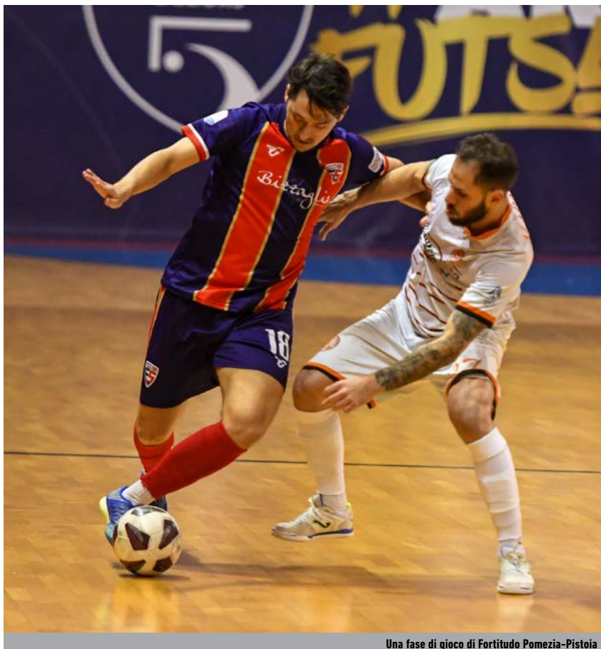
Una fase di gioco di Fortitudo Pomezia-Pistoia