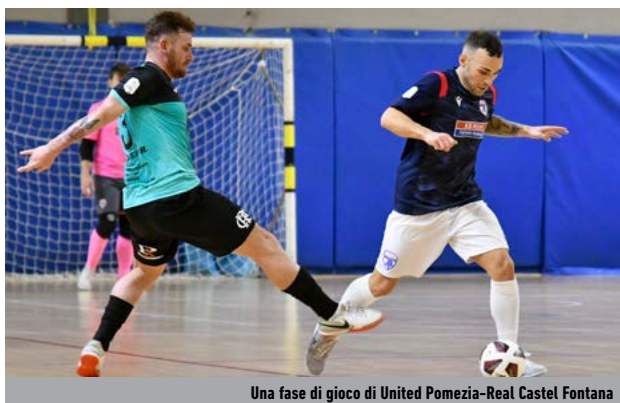
Una fase di gioco di United Pomezia-Real Castel Fontana

Girone F - L'Academy Pescara consolida l'allungo operato la scorsa settimana: la regina del girone F passa 4-1 in casa della Junior Domitia e tiene a -5 il duo di inseguitrici, che riscatta gli stop della prima di ritorno. La Tombesi Ortona si