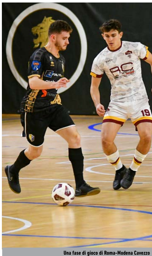
Una fase di gioco di Roma-Modena Cavezzo

Girone C - Il Sala Consilina, unica imbattuta in tutta l'A2, regola la Gear Siaz; il Cosenza pareggia e scende a -7. Dietro il vuoto. Il Canosa doma il Manfredonia e sale sul podio, a 15 punti dalla vetta. Scavalcato l'Itria, prossimo avversario della capolista, che cede il passo al Giovinezza, rivale del Cosenza nel ventesimo turno. Reti bianche tra Benevento e Regalbuto. Al Canicatti lo scontro salvezza col Bovalino.