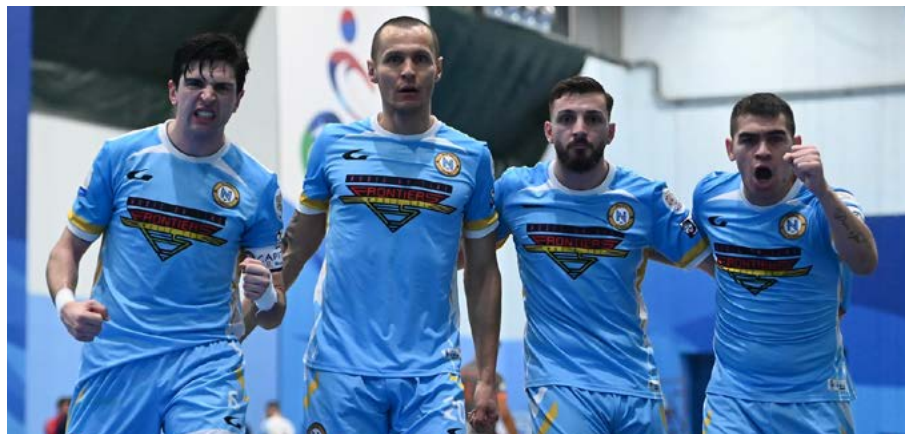
L'resultanza azzurra con il Pistoia