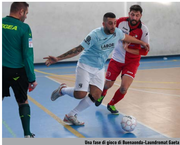
Una fase di gioco di Buenaonda-Laundromat Gaeta