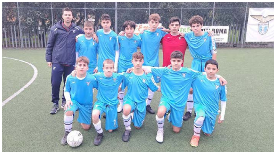
La formazione Under 15 dell'Accademia Lazio