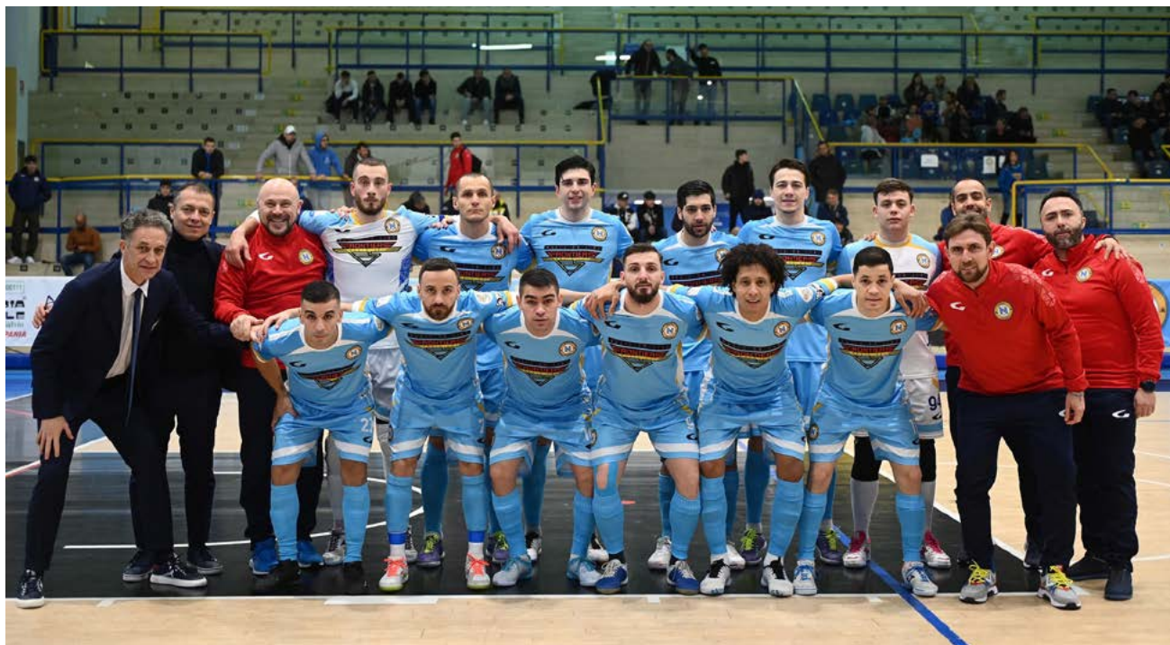
La formazione del Napoli che ha affrontato il Pistoia in Coppa Italia