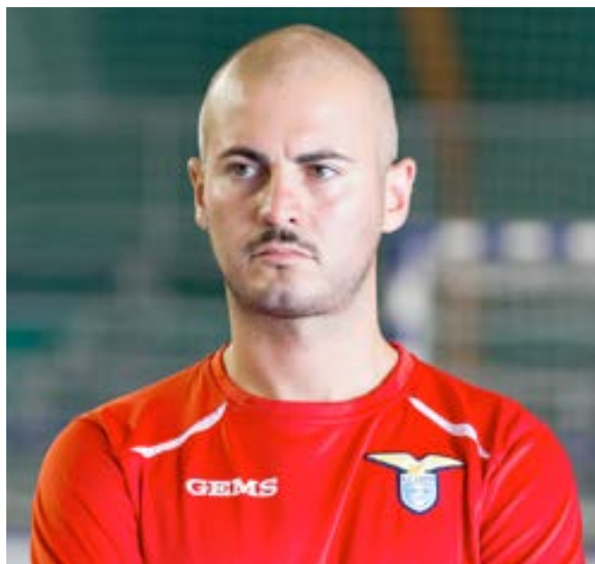
Davide Fazio

Prossima giornata - Il prossimo turno di campionato mette di fronte la Lazio al 3Z. Partita però ancora in dubbio, visto che per una possibile indisponibilità del campo il match potrebbe saltare. E