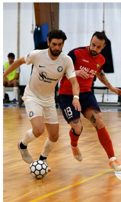
Una fase di gioco di Olympus-Ciampino Anni Nuovi

Girone D - Napoli (16 su 16) esagerato con l'Orsa e adesso a +12 su un Polistena rallentato dal Bernalda. Cosenza da podio, il Melilli si vendica del Regalbuto e aggancia il quinto posto. Super Bovalino, con 20 gol e sei punti in quattro giorni tra Siac e Taranto.