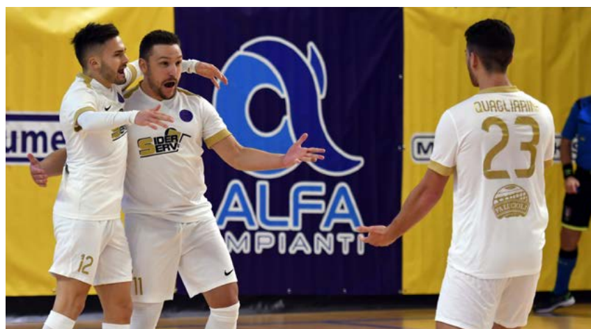
L'esultanza della Cioli Ariccia, vittoriosa a Pomezia