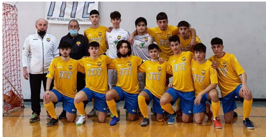
La formazione Under 19 del Ciampino Anni Nuovi