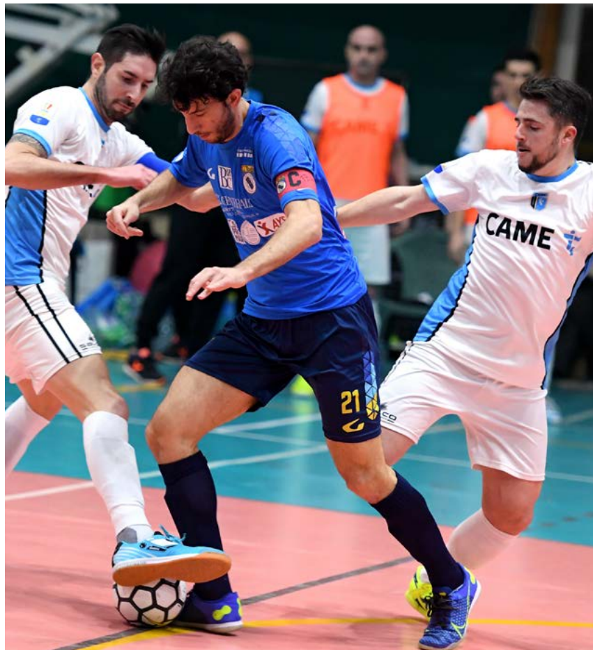
Una fase di gioco di Lido di Ostia-Came Dosson

termine della regular season, fra i silenzi generali, zitto zitto (fino a un certo punto) l'italo brasiliano di Tenente Portela "vede" quel Dudu Morgado capace di realizzare la bellezza di 40 marcature con la maglia del Montesilvano nel 2003-2004. In caso di aggancio o sorpasso, il Nazionale Azzurro non sarebbe più il goleador del decennio, ma degli ultimi 17 anni. Magari lì qualcuno si accorgerà di questa splendida storia... Vieira.