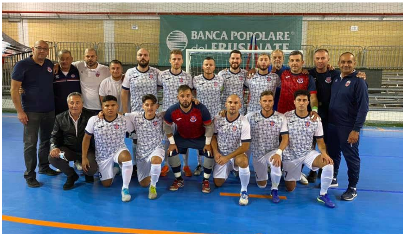
Il Palombara viaggia verso la promozione in C1

Girone D - La diciottesima giornata sorride al Cures: la squadra di Romagnoli vince 5-3 il derby sabino contro la BF Sport, vola a +5 sull'Epiro, sconfitto 3-1 dal Pavona, e a +6 sulla Conauto Lidense, ai box per ragioni di calendario. Il successo col roster di Biolcati permette all'Atletico di avvicinare il podio, discorso valido anche per il Real Mattei, a segno 3-2 sullo Sporting Club Santos, e per la Virtus Ostia, corsara 5-3 con la LS10. Il Circolo Canottieri Lazio ritrova i tre punti grazie al 6-1 esterno imposto al Circolo Master 97 e abbandona la zona playoff, rinviata al 24 marzo Tor Sapienza-Settecamini. Cures-Real Mattei è la gara di cartello del prossimo turno, nel quale l'Epiro cerca riscatto col Circolo Master 97 e la Conauto Lidense torna in scena contro quel Tor Sapienza che un girone fa colse tutti e tre i punti in palio.