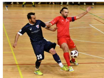
Una fase di gioco di Nordovest-Fortitudo Pomezia

Girone D - Continua l'elastico tra il Melilli e le sue rivali: i siciliani riallungano grazie al blitz nel fortino delle Aquile e sfruttano nel migliore dei modi il 4-4 nella faccia a faccia tra Giovinnazzo e Cosenza, che perdono terreno, ma non si rassegnano, forti della gara in meno rispetto alla capolista. Il Regalbuto consolida il quarto posto, derby trionfale per il Catanzaro, che supera e scavalca il Futura, issandosi in zona playoff.