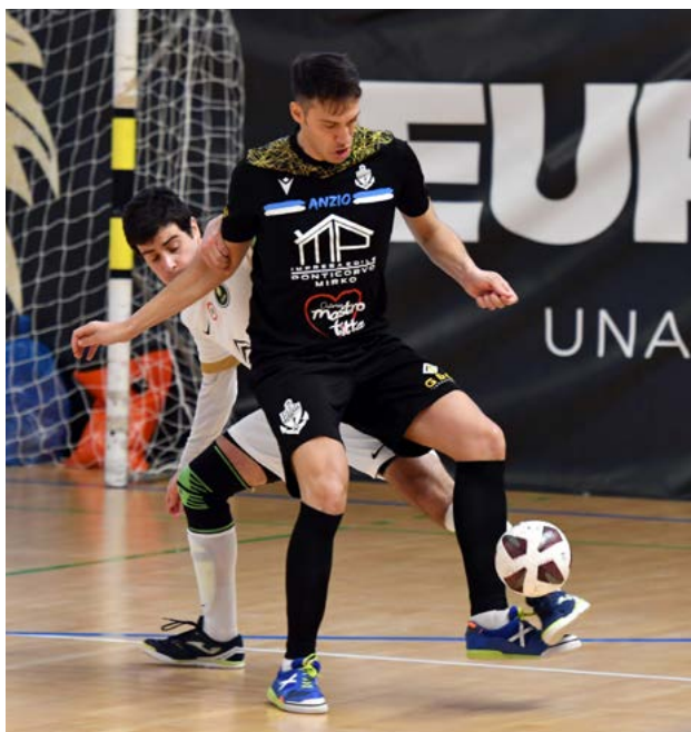
Una fase di gioco di Eur Massimo-Città di Anzio

altrettanti posti nella kermesse che assegnerà la coccarda tricolore cadetta. Sabato 19 è la data da segnare col circoletto rosso: Cesena-Fossolo, Hornets-Grosseto, AP-Domitia e Palermo-Lamezia valgono una Final Eight che si preannuncia spettacolare.