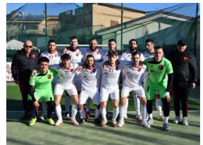
La formazione del Real Castel Fontana