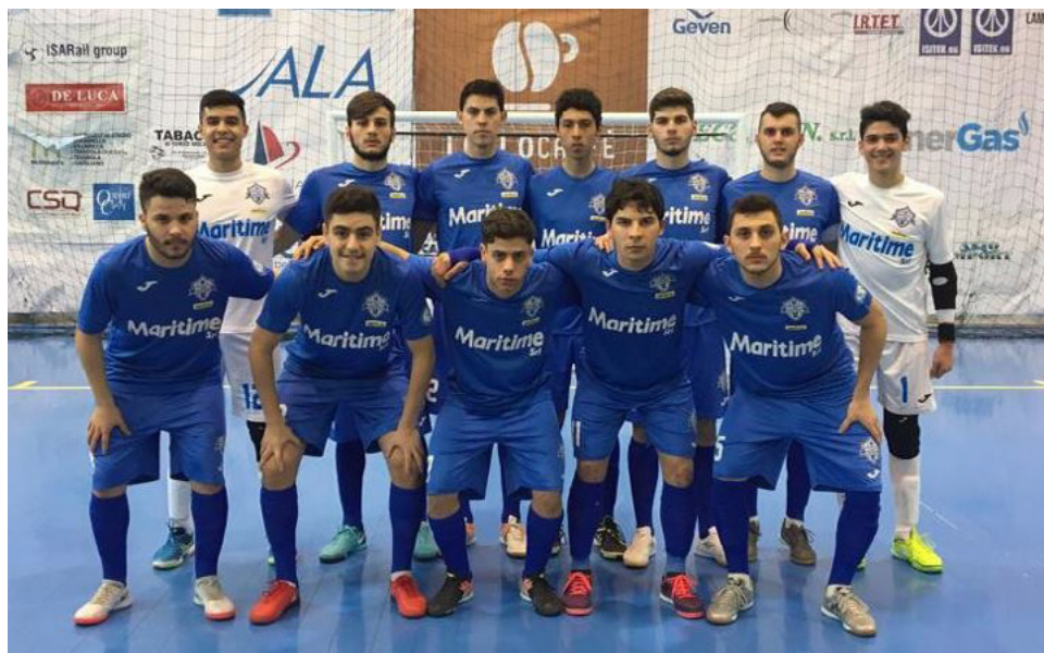
La formazione Under 19 del Maritime

Campionato - L'aritmetica certezza del primo posto non ha influito sull'ultima prestazione dei megaresi, che per l'undicesima volta in campionato sono andati in doppia cifra, portando a 194 il numero di gol realizzati. Si tratta, ovviamente, del miglior attacco del raggruppamento, per una squadra che, però, ha dimostrato di saper fare egregiamente entrambe