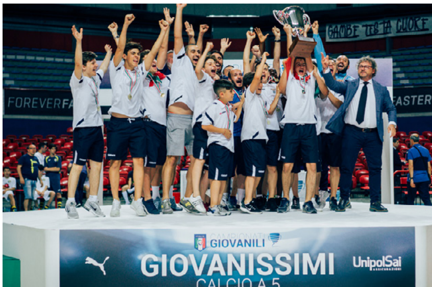
I Giovanissimi della Lazio Campioni d'Italia