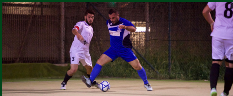
Edilisa e Folgarella saranno avversarie venerdì sera

Girone C – Poteva essere un ostacolo complicato, ma la Stella Azzurra torna a vincere (dopo il pari col Grande Impero e la sosta), ai danni di un Penta Pomezia che perde anche una posizione in classifica, col Real Vallerano che mette la freccia. Fonte Ostiense e Grande Impero mettono a segno 8 gol, ma solo per i laurentini è una passeggiata. L'Esercito combatte strenuamente fino