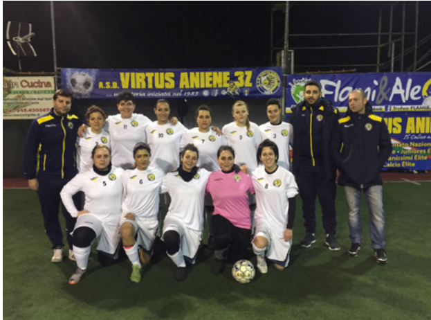
La Serie D femminile