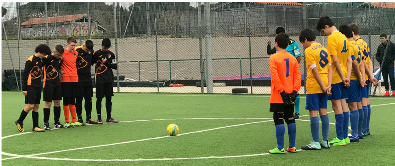
I Giovanissimi Élite durante il minuto di raccoglimento per Astori

GRANDE VITTORIA DEI GIOVANISSIMI ÉLITE, CHE HANNO SUPERATO I PARI ETÀ DEL CASAL TORRACCIA EVIDENZIANDO UN PROFONDO SPIRITO DI SQUADRA, ERANDO: "I RAGAZZI HANNO GIOCATO UNA PARTITA STUPENDA, SONO STATI PERFETTI DAL PRIMO ALL'ULTIMO MINUTO"