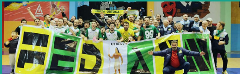
La Tombesi Ortona neopromossa in A2