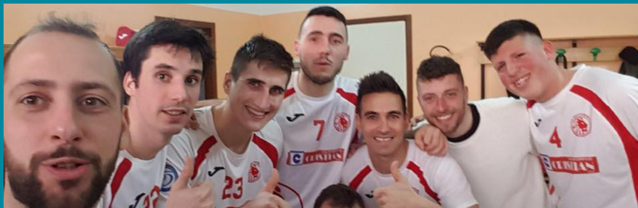
L'esultanza del Barletta, ultima qualificata ai playoff

Rush finale - A Chieti, Palusci e i suoi cercano il poker di successi e ricevono un'Ossi obbligato a vincere, per non far morire le speranze di salvezza diretta. Anche i berici e il Grifo devono ottenere tre punti, se vogliono ancora insidiare gli abruzzesi nella lotta al primato. Orte, col Leonardo, a un passo dai play-out certi, serve tornare a un successo che manca da gennaio per mettere una seria ipoteca sulla post season. All'Estraforum i lanieri ospitano Caropreso e i suoi: le speranze dell'Olimpus sono ridotte al lumicino, i padroni di casa devono trovare la salvezza.