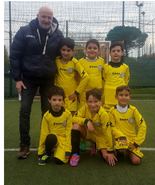
Iudicone con i Pulcini 2010

concentrano sulla loro crescita: è davvero un piacere per me far parte del Progetto Futsal".