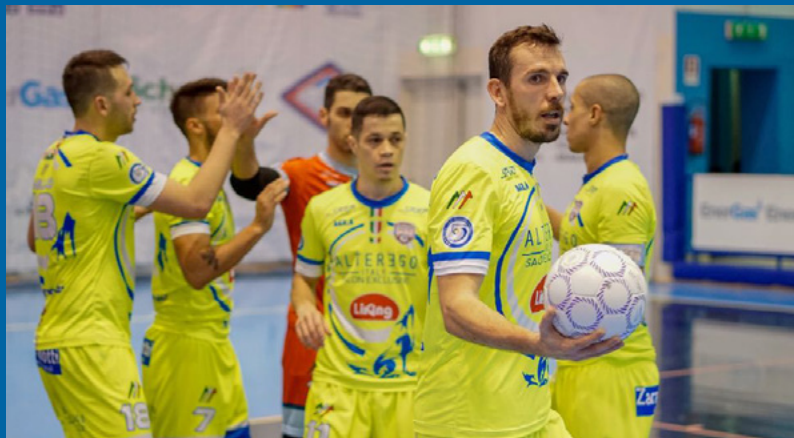
L'esultanza della Luparense vittoriosa a Napoli

Luci al PalaFiera - L'ultima giornata prima dell'attesissima Final Eight di Pesaro, comincia proprio da un PalaFiera campo principale. Già, l'Italservice è in salute, ha accostato la propria porta e ora sogna una posizione migliore del sesto posto, contro un Lollo Caffè Napoli pieno di dubbi, che fatica a ritrovarsi nell'era post Euro 2018.