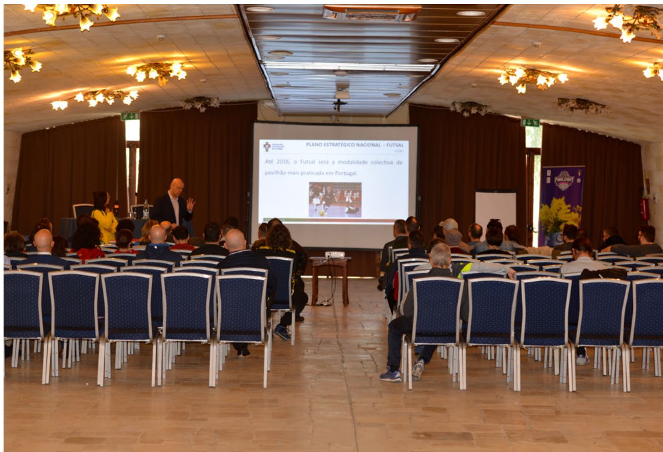
Una fase del clinic a Noicattaro

concettualizzato come un lavoro dietro le quinte che sta per portare nuove iniziative all'orizzonte. Un laboratorio pronto per partorire l'ennesima novità: i clinic di formazione per i tecnici, quei seminari con interventi di esperti del mestiere momentaneamente senza panchina, con la possibilità di assistere a sedute di allenamento di squadre di Serie A e in futuro corsi di aggiornamento territoriali sempre con l'aiuto dei responsabili regionali Aiacc (Associazione Italiana Allenatori Calcio) è soltanto all'inizio della sua formazione. Top, naturalmente.