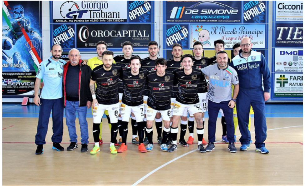
La formazione Under 21 che ha vinto il proprio girone