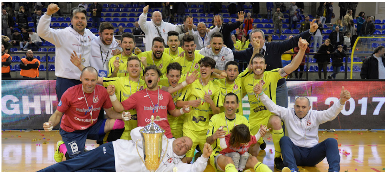
Il Pesaro vincitore dell'edizione 2017

OCCHI PUNTATI SU AUGUSTA E SUL PALAJONIO, IN CUI SI ASSEGNA IL TITOLO DI VINCITRICE DELLA COPPA ITALIA. SI PREVEDE IL TUTTO ESAURITO, NEL PALAZZETTO E FUORI: TANTI SPETTATORI ATTESI SUGLI SPALTI E IN ASCOLTO, IN STREAMING E DIRETTA TV