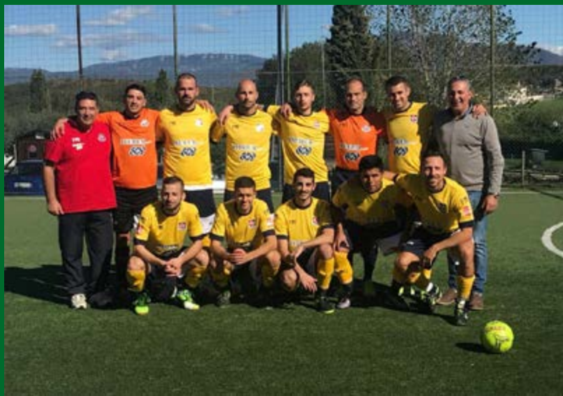
La Virtus Palombara

Girone B - La nuova coppia al vertice del girone B si scontra in 60' cruciali per gli esiti della corsa alla promozione diretta: Velletri-Pro Calcio Italia è lo