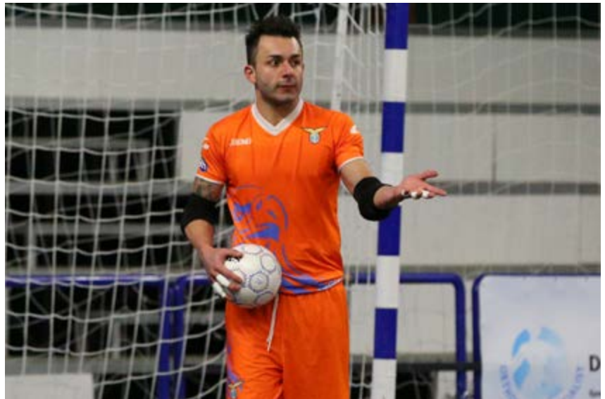
L'estremo difensore biancoceleste Lazio

La situazione - Attualmente la Lazio accusa un ritardo di cinque lunghezze dalla coppia IC Futsal-Cisternino (16 punti contro 21) con la squadra di Pedrini che disputerebbe il playout proprio contro i biancocelesti, avendo il vantaggio del fattore campo; i pugliesi, invece, sarebbero la prima squadra a salvarsi direttamente. Ma occhio al calendario: mentre la Lazio giocherà a Latina, l'IC Futsal andrà a Chieti per giocarsela contro l'Acqua&Sapone, fresca vincitrice di Coppa; col Cisternino che fa visita alla Luparense, l'altra finalista della kermesse della coccarda. Insomma, turno tutt'altro che facile. Senza considerare i due successivi: Lazio-Kaos, Cisternino-Rieti e IC Futsal Latina alla penultima; Pesaro-Lazio, Kaos-IC Futsal e Milano-Cisternino all'ultima. Occhio, poi, alla risalita del Milano: la squadra lombarda ha il Pescara alla prossima - e tutti conoscono la situazione del Delfino