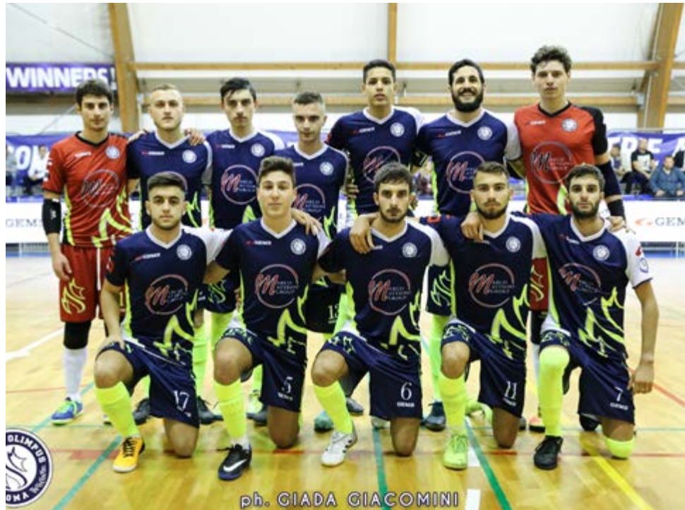
Una delle recenti formazioni dell'Olimpus in A2

La squadra - "Sono contento per i ragazzi, per i mister, perché hanno lavorato duramente facendo la stessa scommessa che stavamo facendo noi, cosa che ha dato a tutti la spinta per poter arrivare dove siamo arrivati". Credere, insomma,