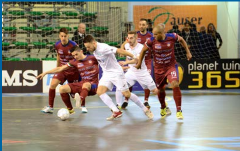
Kaos-Came, remake del quarto di Final Eight

Dejavù - Si ricomincia con un dejavù, Kaos-Came: remake del primo quarto di Pesaro, nonché big match della 24esima di regular season. Gli emiliani hanno subito l'occasione di prendersi una bella rivincita, per proseguire la rincorsa figlia degli otto