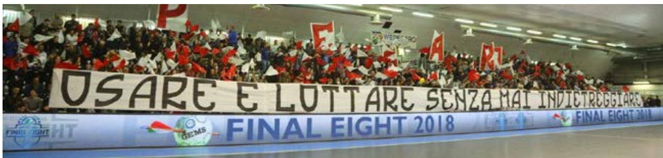
La scenografia del PalaFiera