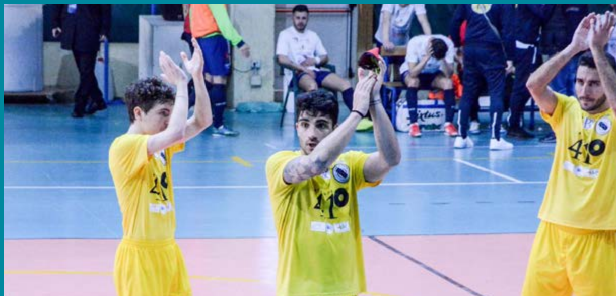
L'esultanza del Lido di Ostia