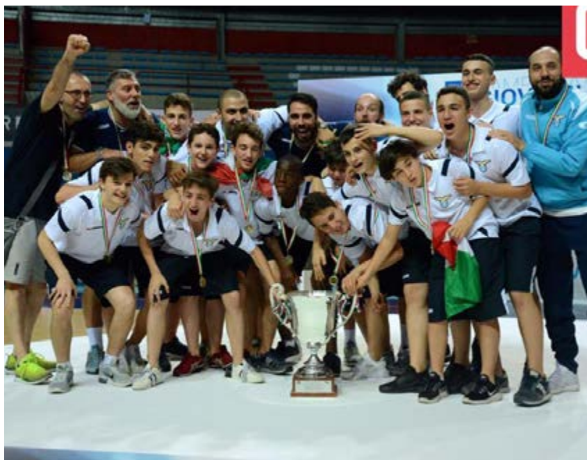
I Giovanissimi Campioni d'Italia

A un certo punto della stagione sembrava durissima. La Juniores attraversava un momento difficile, i Giovanissimi campioni d'Italia avevano incassato un paio di battute di arresto, gli Allievi erano sempre lì senza riuscire mai a mettere la testa fuori, l'Under 19 era un po' più tranquilla, ma non è che si sorridesse. Tuttavia, se il lavoro è fatto bene, se si crede nella propria filosofia, nella propria metodica, nei propri insegnamenti, se ci sono dei ragazzi che rispondono presente, dando importanti risposte in campo, i risultati inevitabilmente arrivano. Così è stato per tutto il settore giovanile della Lazio, al maschile: ancora una volta e per il secondo anno consecutivo, U19, Juniores, Allievi e Giovanissimi si qualificano aritmeticamente per i playoff. I più grandi da terzi alle spalle di Orte ed Olimpico; i vicecampioni d'Italia sono sicuri almeno del secondo posto e hanno lo scontro diretto col Torrico in casa all'ultima; gli Allievi sono ormai tranquilli e certi del terzo posto; infine, i campioni in carica dei Giovanissimi andranno