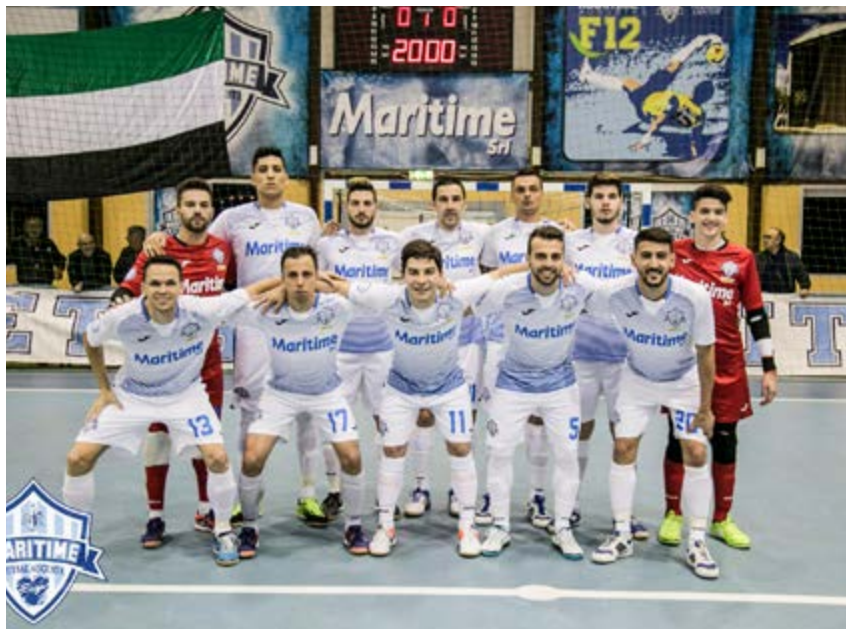
La formazione del Maritime