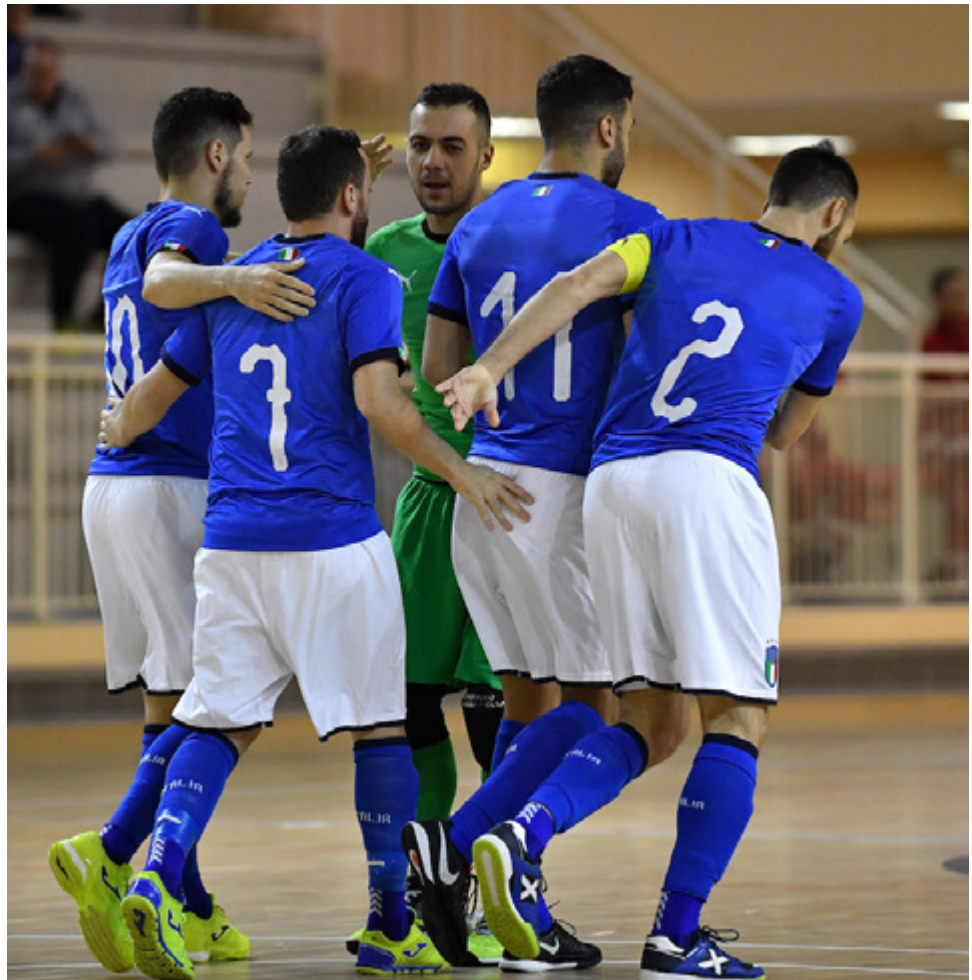
L'esultanza azzurra nel test di Novarelo

Porte spalancate - È una Nazionale che in primis vuole farsi di nuovo amare. Niente più bunker e silenzi assordanti, già per il raduno di Novarelo prima della partenza per la doppia amichevole in Romania erano state aperte le porte agli allenamenti Azzurri. Nella settimana che porta al triangolare con Albiceleste (domenica 14, ore 18.15, su Rai Sport HD) e Bosnia (martedì 16 ore 20.30, diretta streaming sul canale YouTube FIGC Vivo