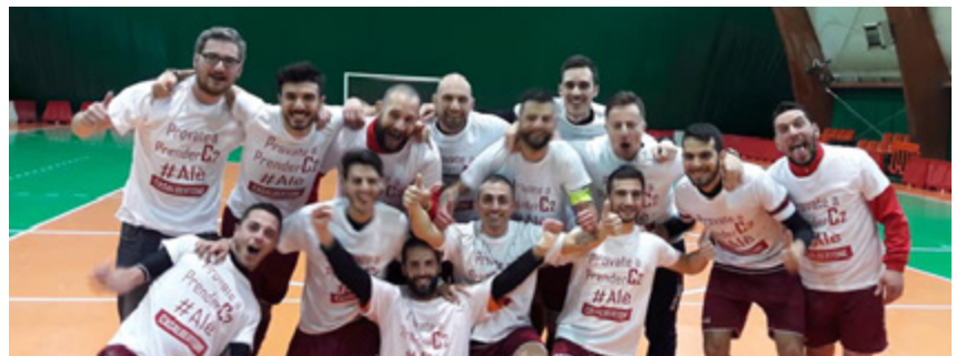
Il Casalbertone neo promosso in C2

Girone B Latina - Quasi tutto secondo copione nel secondo gruppo pontino, l'unica eccezione è l'Arena Cicerone: la Vis, già da tempo consapevole che non può trovare la strada della promozione, sorprende i più quotati rivali, costringendoli a non avere il loro destino tra le mani. Si perché il Vodice, al 7º successo di fila, ha una gara in più da giocare e virtualmente potrebbe prendersi il quinto posto. A riposo la Fortitudo, il Ceccano trova una vittoria larga in trasferta mentre il Città di Sora, trascinato da Gemmiti e Valentini, blinda i playoff. Sperlonga Atletico a Strangolagalli, il netto 4-0 quasi certamente condanna i Kosmos a non poter partecipare alla post season.