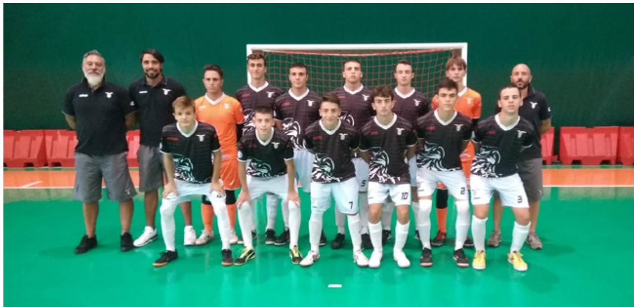
La formazione Under 17 biancocelesti