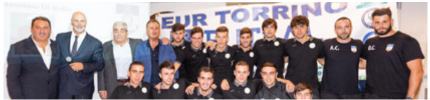
L'Eur Torino nella serata di presentazione