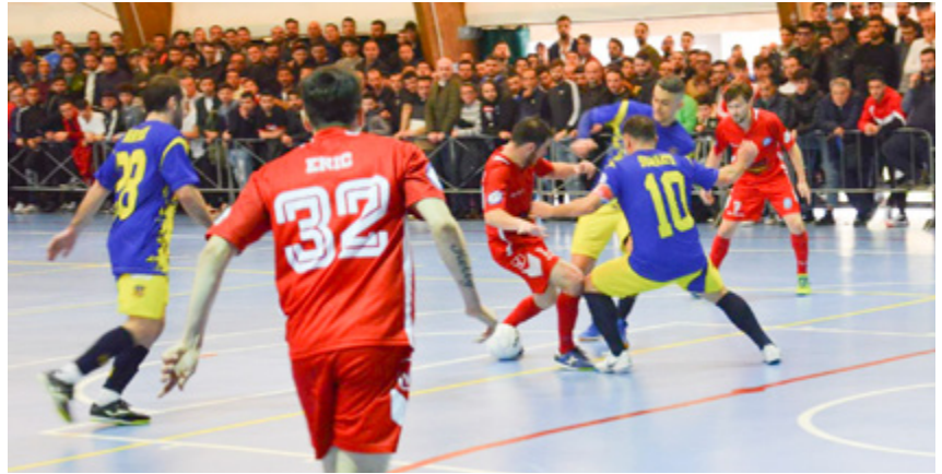
Una fase di gioco di Real San Giuseppe-Futsal Fuorigrotta