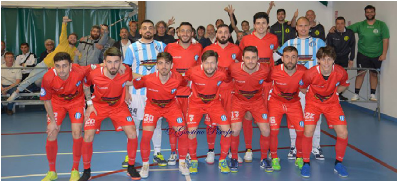
La formazione del Futsal Fuorigrotta

IL FUORIGROTTA CADE NELLO SCONTRO DIRETTO SUL CAMPO DEL REAL SAN GIUSEPPE E FALLISCE IL PRIMO MATCH POINT PER L'A2. SABATO, CONTRO IL POLIGNANO, LA SECONDA OCCASIONE PER CHIUDERE I CONTI. TURMENA: "SARÀ LA NOSTRA GIORNATA"