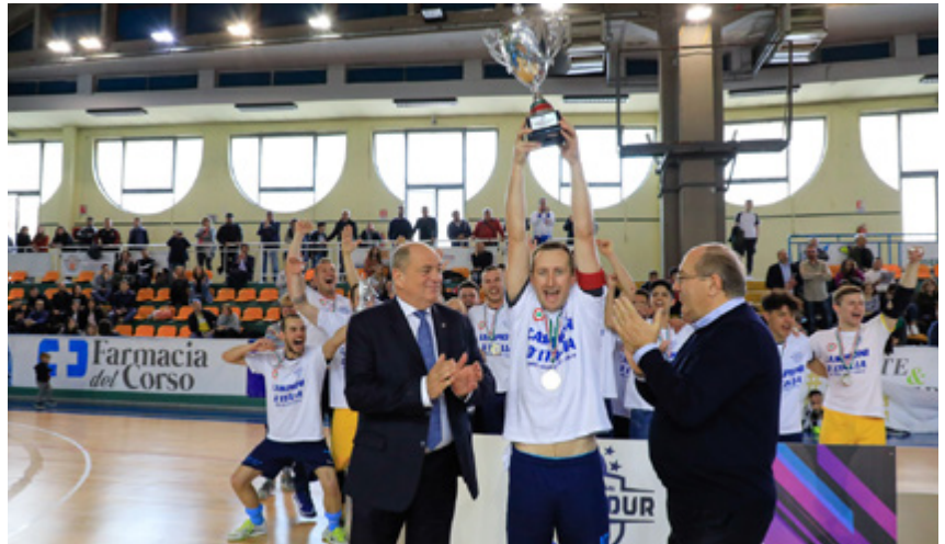
L'A-Team Arzignano, vincitore della Coppa Italia di C1

Playoff - Al PalaCarucci di Terracina, servono i tempi supplementari per decidere il vincitore dello strepitoso botta e risposta tra il Real di Olleia e una Spes Poggio Fidoni mai doma: dopo 40' è 4-4, nel primo extra-time sul tabellone matura un altro gol a testa, ma Vagner e Frainetti segnano le reti che permettono ai tirrenici di imporsi 7-5 e continuare ad alimentare il sogno promozione. Non è da meno la sfida andata in scena a L'Acquedotto: l'EcoCity Cisterna, sempre costretto a inseguire nel punteggio la Pro Calcio Italia, riesce a portare il confronto sul 5-5, la squadra di Galante, però, risolve a proprio