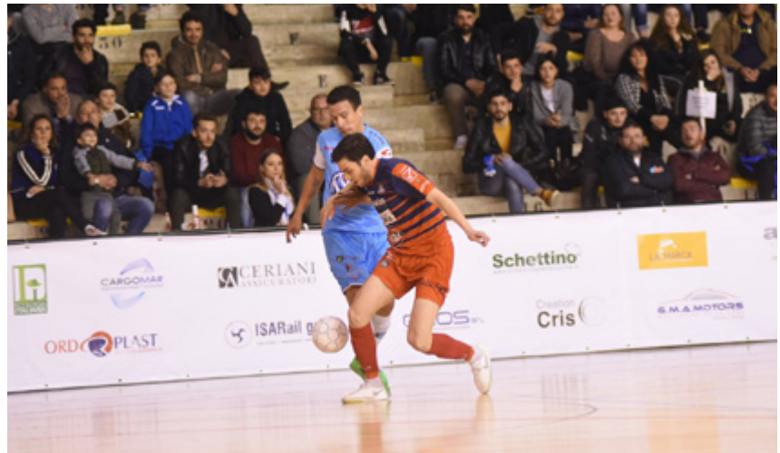
Una fase di gioco di Napoli-Eboli

L'analisi - A&S chiaramente in pole per un clamoroso "tripleto": i campioni d'Italia hanno già alzato la Supercoppa (battendo il Napoli), si sono ripetuti in Coppa Italia (col Pesaro), dimostrando praticamente durante tutta stagione regolare di essere il roster più forte, qualitativamente e soprattutto quantitativamente parlando. Il Pesaro Special Edition è lì, però, più vicino rispetto alle cinque lunghezze che evidenzia la classifica: non ha mai perso in campionato contro la capolista, superandola addirittura al PalaPizza e arrendendosi nella finale di