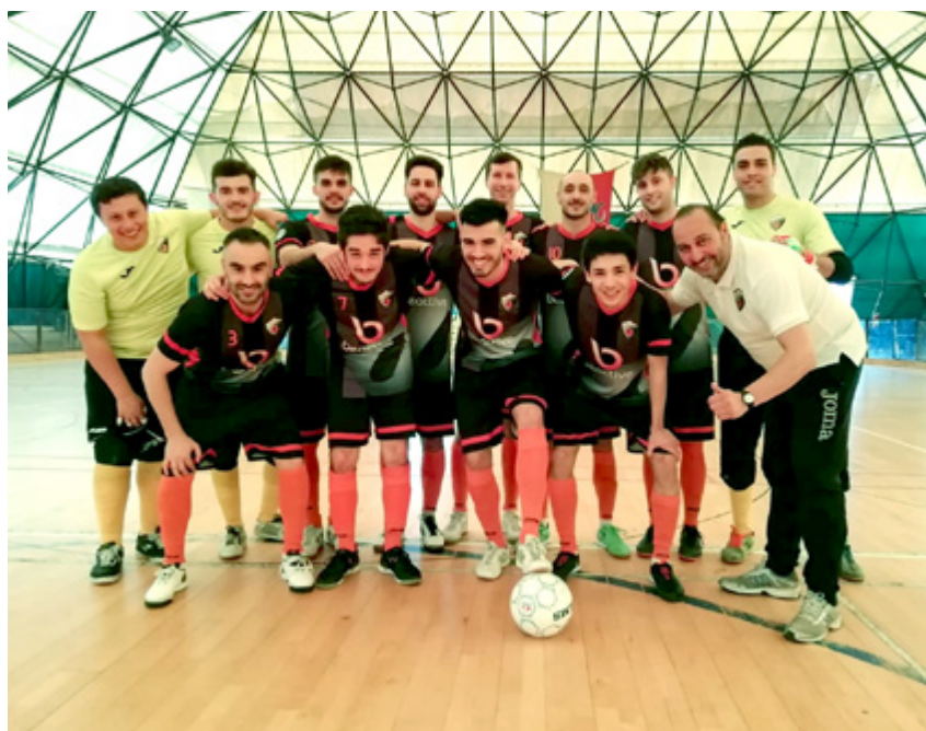
La formazione dell'Active Network vittoriosa a tavolino