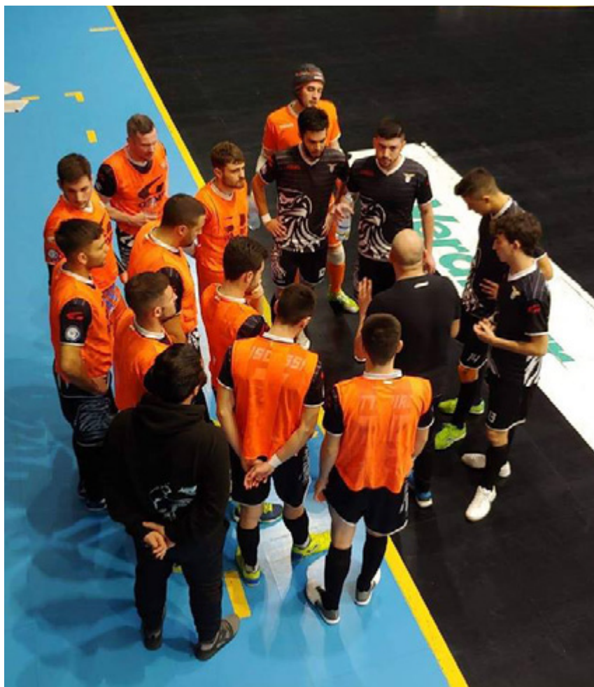
La Lazio durante il time out nella sfida con il Pesaro