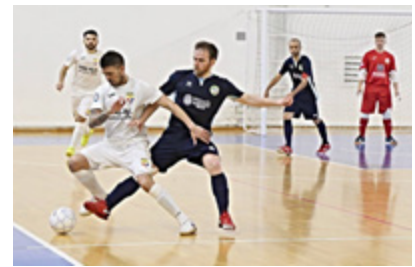
Una fase di gioco di Tombesi-Ciampino Anni Nuovi