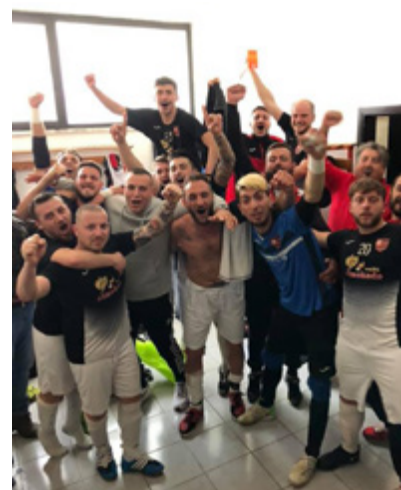
L'esultanza del Real Castel Fontana dopo aver centrato la permanenza in C1

che ci siamo prefissati. Vogliamo organizzarci bene prima, perché non vogliamo ripetere un'annata come questa, veramente sofferta. Vogliamo chiudere la squadra prima e vediamo cosa riusciamo ad organizzare. Sicuramente abbiamo tutti buoni propositi. L'obiettivo è una stagione dignitosa che ci permetta di divertirci, invece di soffrire".