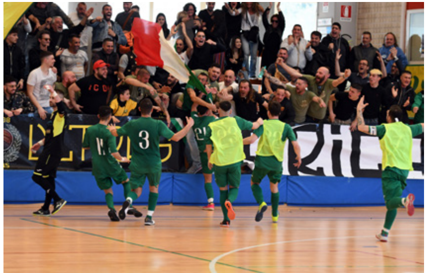
L'esultanza del Laurentino Fonte Ostiense

Girone B - L'aritmetica non c'è ancora, ma lo Sporting Club Palestrina è ormai a un passo dalla Serie C1: la capolista regola 6-3 il Real Arcobaleno e, a 60' dalla fine del campionato, sale a +3 sul secondo posto. L'Ardea, infatti, cade 5-2 a Marino con la Lepanto e perde la piazza d'onore a vantaggio del Supino, corsaro 3-0 in quel di Colleferro: Piroli, sulla carta, potrebbe ancora raggiungere i prenestini battendo lo Zagarolo - in caso di arrivo a braccetto ci sarebbe lo spareggio -, ma a Fatello basterà un punto nella trasferta di Gavignano per evitare calcoli. Il Paliano, già certo di chiudere quarto, si fa battere per 3-2 sul campo dell'AMB Frosinone, che tocca quota 33 insieme all'Atletico Gavignano, ok 4-1 nella trasferta con l'Arca. È 4-4 tra Zagarolo