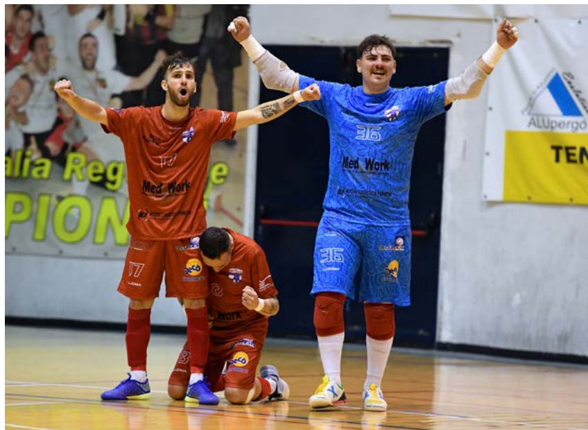
L'esultanza della United Pomezia a Ciampino