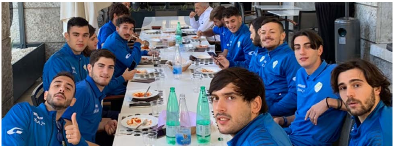
La formazione del Torrino

che coinvolgerà anche le società Eur Torrino, Eur T.M. e Stella Azzurra, club gemellati che collaborano da qualche anno a livello territoriale alla crescita dei settori giovanili del Torrino. Al termine della manifestazione, prevista a fine primavera, saranno premiati le scuole e i ragazzi che hanno partecipato al concorso "Diamo 5 calci al Bullismo, due al Razzismo", un progetto che ha riscosso tanto successo e che, con i convegni online degli ultimi due mesi, ha visto la partecipazione di esperti e istituzioni. "Anche per quanto riguarda le attività nel sociale, il Torrino sarà in prima linea nei prossimi mesi - conclude Cucunato -. Abbiamo attivato sinergie con varie società sportive del territorio per coinvolgere sempre più giovani".