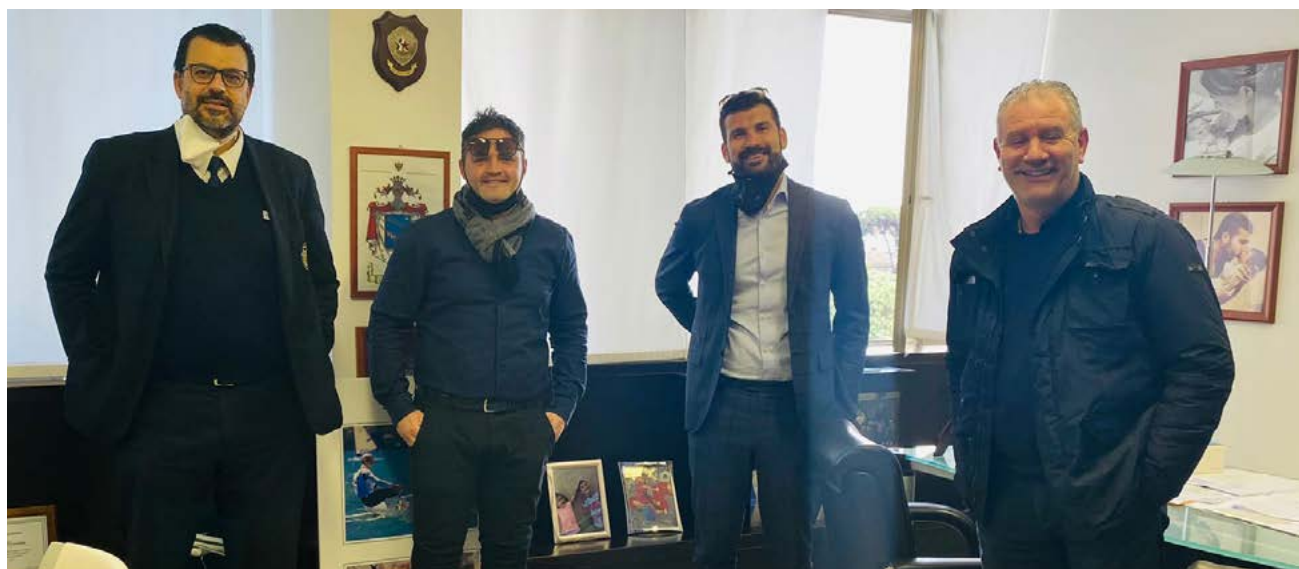
L'Italpol al lavoro per la nuova stagione

questi aspetti emergono e diventano dei macigni o, peggio, inopportuni - afferma il direttore generale -. Ma io non mi piango addosso e non ho paura di prendermi le mie responsabilità. Evidentemente ho sbagliato molto, ma so di essere in grado di trasformare la delusione in stimolo e il fallimento, o pseudo tale, in una nuova opportunità di rivalsa. In fondo, lo sport, soprattutto il futsal, ti dà sempre la possibilità di rialzarti: se hai la forza e la voglia di poterlo fare, ti può portare in alto. E io, e tutti noi dell'Italpol, ne abbiamo da vendere". L'ultima partita, l'ultima sirena, poi tutto passerà nelle mani della dirigenza. Che si riparta da qua e l'Italpol tornerà a competere per le posizioni che gli spettano.