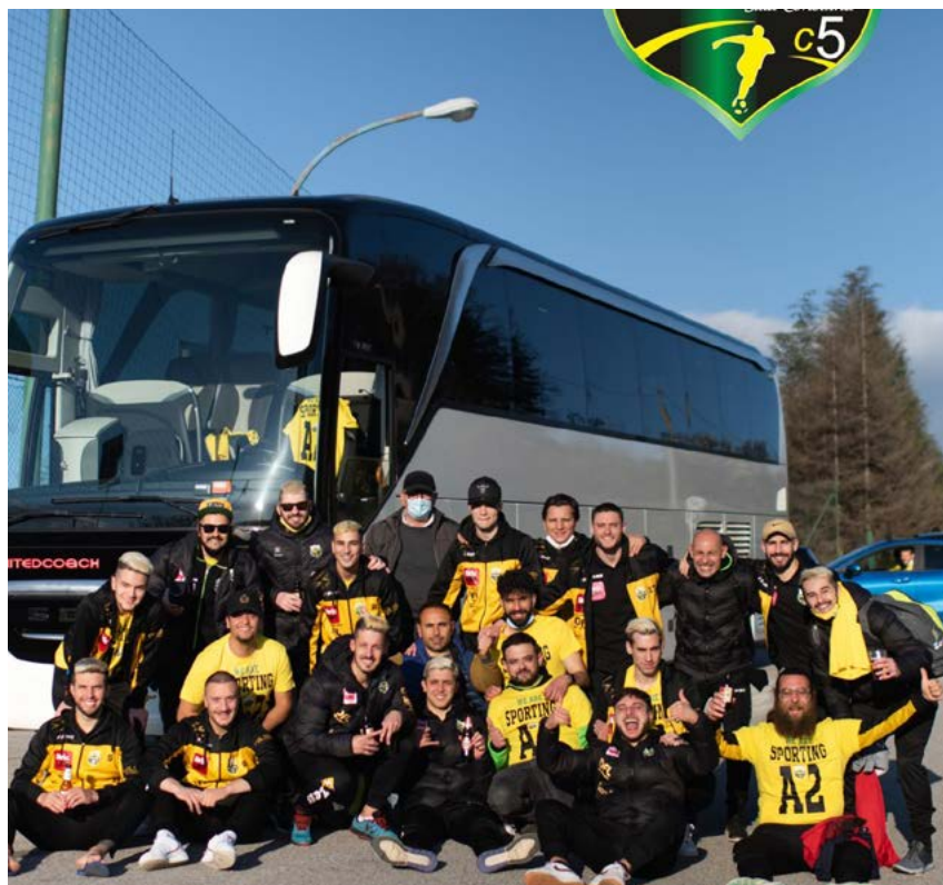
Lo Sporting Sala Consilina neopromosso in A2

Girone E - La griglia playoff si definisce in extremis: l'ultimo pass va all'History Roma 3Z, che regola 6-1 tra le mura amiche il Velletri e sorpassa lo Sporting Hornets, sconfitto 4-3 dall'Eur Massimo. La squadra di Minicucci, rappresentante del girone E all'imminente Final Eight di Porto San Giorgio, beneficia dei tre punti ottenuti al PalaLevante per chiudere al secondo posto. L'altro slot sul podio è preda della Cioli Ariccica: i castellani domani 7-5 al PalaKilgour la United Pomezia e scavalcano proprio la formazione di Caporaletti. Tutto deciso anche laggiù: la Mediterranea si impone 5-3 sul Real Fabrica e andrà ai play-out, mentre la Forte Colleferro, sconfitta 6-2 a Pomezia dalla già promossa Fortitudo, è costretta alla retrocessione.