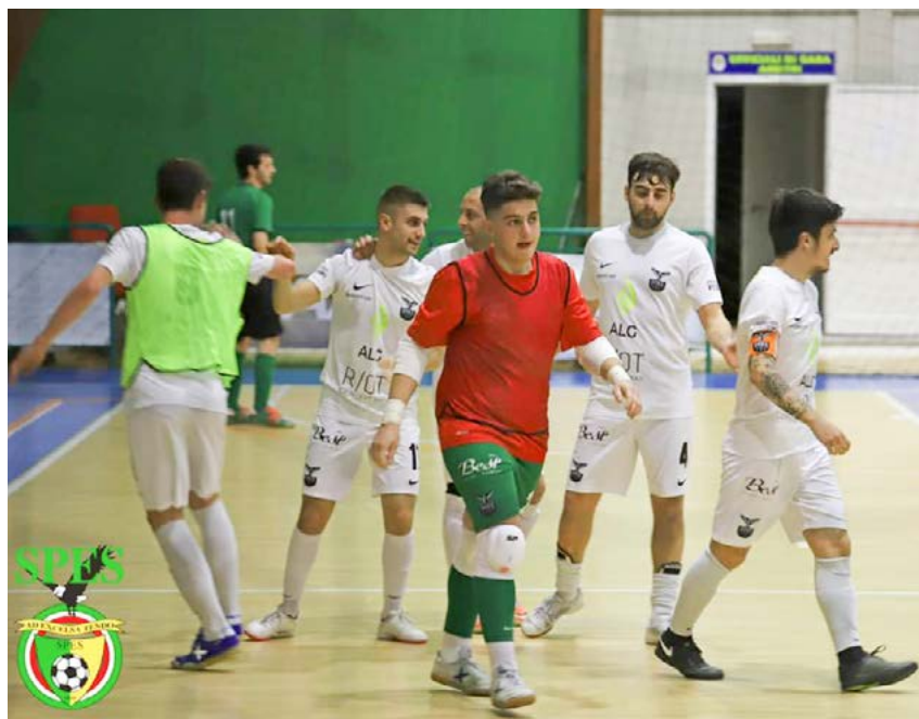
L'esultanza della Spes Poggio Fidoni

La formula - Il Comunicato Ufficiale n°59 del CR Lazio ha chiarito il regolamento della C1 in formato