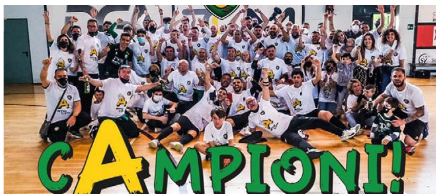
La L84 neopromossa in Serie A

Girone B - Active da podio: Ceppi supera la Roma e chiude la regular season al terzo posto. I giallorossi, invece, scivolano addirittura quinti,