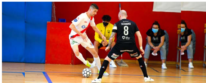
Una fase di gioco di Mantova-Aniene

Le PEC da Padova sembrano fortunatamente non arrivare più, le accertate positività - scongiuri a parte - sono terminate, così mentre la FIGC riapre le porte dei palazzetti al pubblico (fino al 25% della capienza massima per un totale di 500 persone per le partite di interesse nazionale al chiuso, non di più) si può tornare a parlare dei playoff scudetto. Habemus data - La serie fra Syn-Bios Petrarca e Feldi Eboli, ultimo quarto di finale, partirà in Veneto domenica 6 giugno, gara-2 al PalaSele il 9, eventuale "bella" sabato 12 giugno, sempre alle ore 20, salvo cambiamenti da ratificare, con la speranza che tutto fili liscio stavolta. L'Italservice Pesaro torna a scaldare i motori (incontrerà proprio la vincente fra i ragazzi di Luca Giampaolo e quelli di Alberto Riquer), così come Meta Catania e Came Dosson, che sanno già il loro prossimo destino. Insomma, i playoff 2.0 possono partire con all'orizzonte una sempre più probabile Final Four (anche perché il 30 giugno terminano moltissimi accordi) anche se non a Pesaro, forse Rimini,