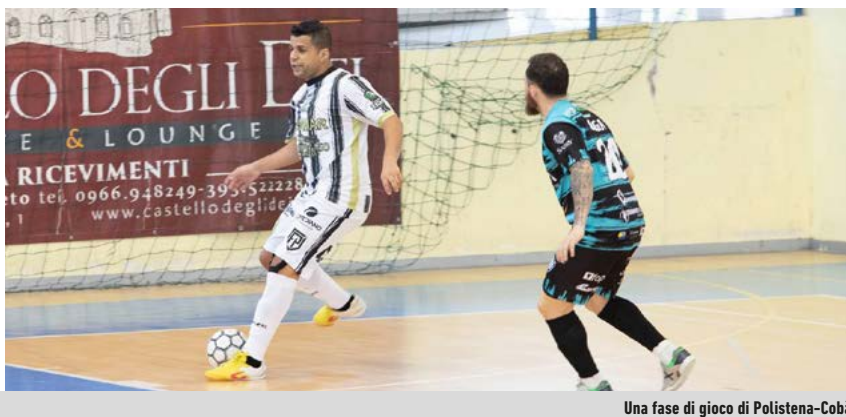
Una fase di gioco di Polistena-Cobà

La sentenza - Dopo le delusioni sul campo, per il Cobà arriva anche la mazzata del Tribunale Federale Nazionale (Sezione Disciplinare), che ha sanzionato l'esclusione del club dal campionato di competenza. I marchigiani, che hanno presentato ricorso, rischiano a questo punto di ripartire dalla Serie B.