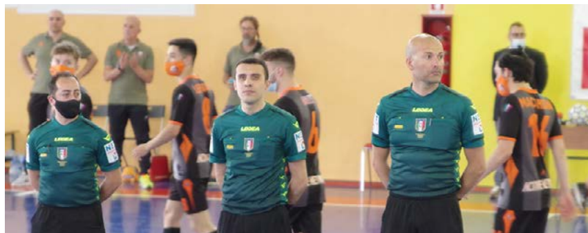
Gli arbitri di Polistena-Active che andrà rigiocata

FINALE (and. 12/06, rit. 19/06) Futsal Polistena-Active Network