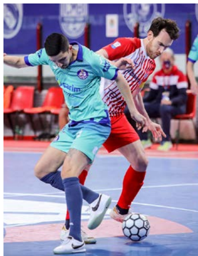
La semi Pesaro-Feldi è la rivincita della finale di Coppa Italia

Formula e regolamento - Una sorta di doppia semifinale, dunque: in caso di parità di gol nell'arco degli 80" effettivi, si disputeranno i tempi supplementari; qualora il risultato di parità persistesse, avanti le meglio classificate. E su questo, Italservice Pesaro e Came Dosson, rispettivamente prima e terza di regular season, partono con un piccolo vantaggio. Came-Meta la prima semi di giovedì 17 giugno (ore 18), a seguire