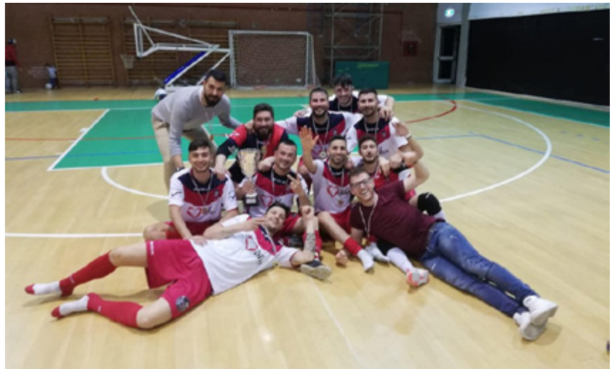
Il Ceccano esulta per la vittoria del titolo provinciale di Latina

e Castromenio centrano la sestina di gol, favoriti anche dal fattore campo, il Torrino Sporting Center si rivela ancora talismano per Pagliaro e compagni. Il Delle Vittorie balla il Mambo, il Palombara osserva il riposo. Un solo segno 'x' nei 13 confronti: San Raimondo e Pavona si spartiscono la posta in palio nel match Atletico.