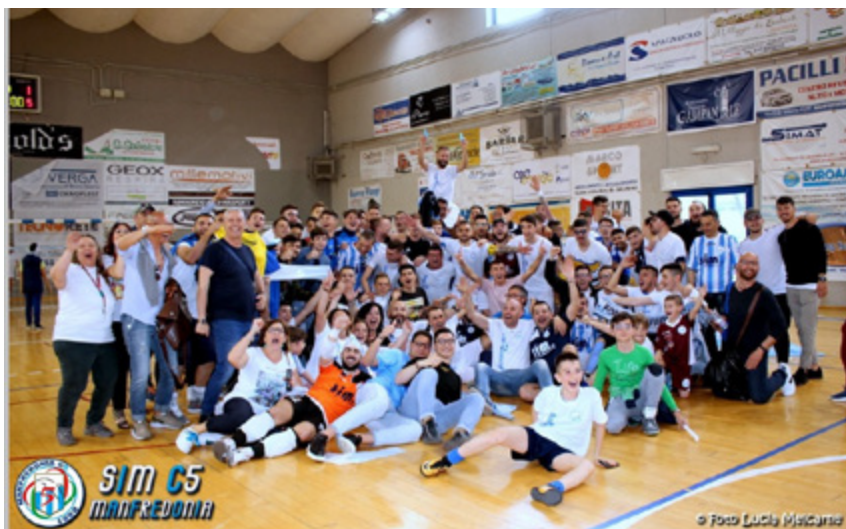
Il Manfredonia vince ai rigori e compie il salto di categoria