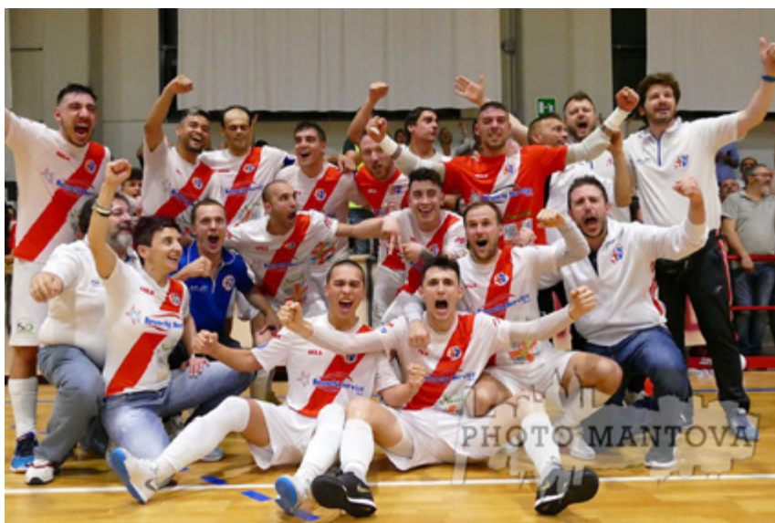
La gioia del Mantova

Fili rossi - Due i leitmotiv dell'ultima fase del campionato di A2. In primo luogo fanno fede, nell'economia delle promozioni, i risultati della regular season: il peso del secondo posto nei rispettivi gironi ha avuto un ruolo fondamentale nei rapporti di forza dei playoff. Altro filo conduttore riguardo alle promozioni è stato quello delle 'prime volte': solamente il Padova, tra le 5 squadre promosse in A, aveva già vissuto la categoria principale a rimbalzo controllato. Per le altre quattro è una novità assoluta.