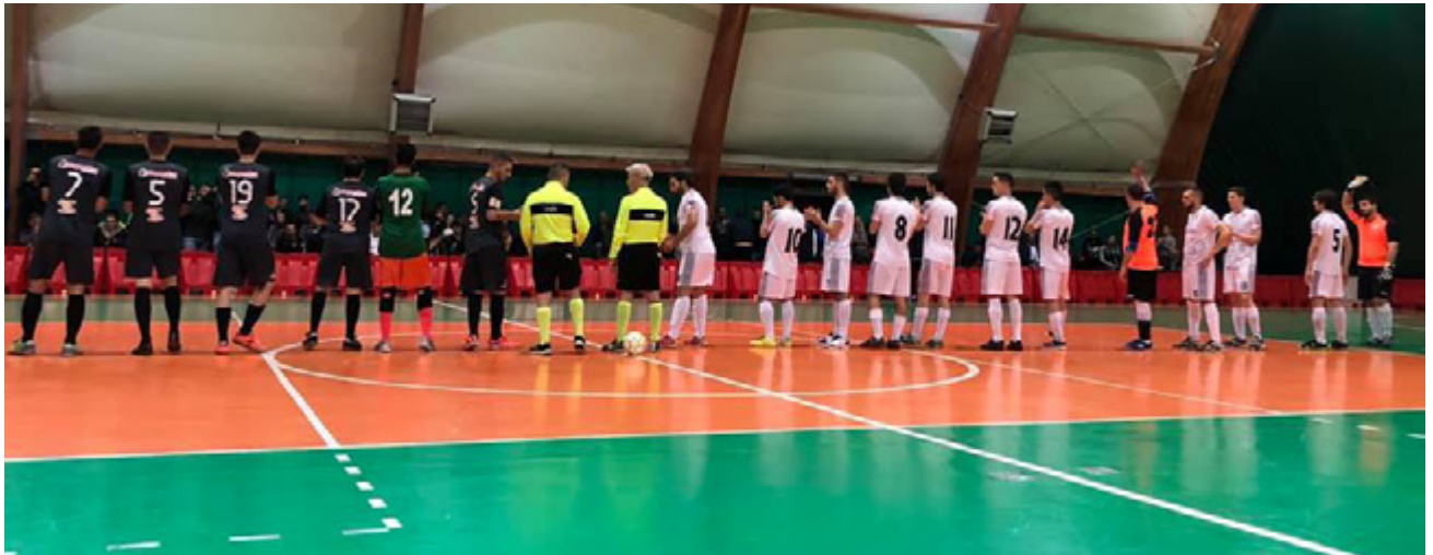
Real Fiumicino-Aletico Grande Impero