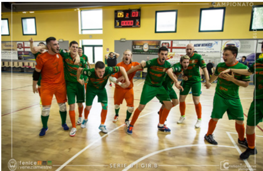
La Fenice Veneziaestre vola in Serie A2

altri accoppiamenti, piove spettacolo: servono i rigori al Manfredonia per avere la meglio del Lausdomini, Gallinica piega il Cataforio e mette la ciliegina sulla torta alla stagione del Polistena, che fa centro al primo colpo tra i cadetti. Il Traforo Spadafora completa l'apoteosi della Calabria: ininfluente il k.o. di misura sul campo del Bernalda per la banda del player-manager Sapinho. La Fenice Veneziaestre risolve l'impatto con il Pordenone, superato 5-3 alla Palestra Franchetti, le affermazioni più nette portano la firma di Aosta e Città di Massa: i valligiani passano anche a Caramagna e segnano complessivamente tredici reti all'Elledi, mentre i toscani travolgono 9-0 tra le mura amiche una rimaneggiata Sangiovese. L'epilogo di una post season favolosa è vicino: il primo confronto tra Eta Beta e CUS Molise termina 2-2, si deciderà tutto al PalaUnimol di Campobasso, già teatro della Final Eight di categoria a inizio marzo.