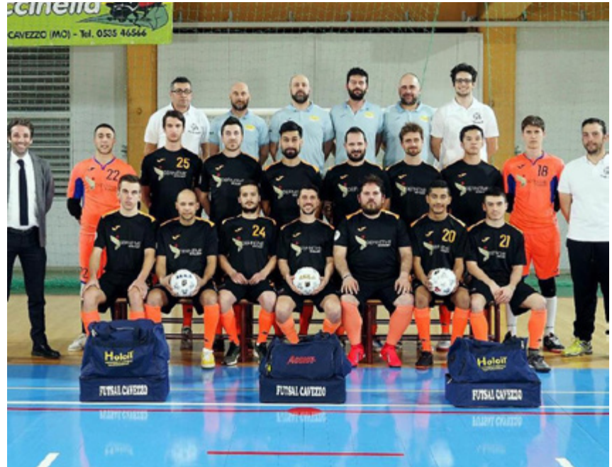
La formazione del Cavezzo, ultimo ostacolo tra il Terracina e il nazionale

dopo aver scalato tutti i gradini del futsal regionale, senza mai fare il passo più lungo della gamba, è arrivato alle porte del calcio a 5 dei grandi, pronto a varcare una soglia che tingerebbe di indimenticabile un 2018-2019 già straordinario.