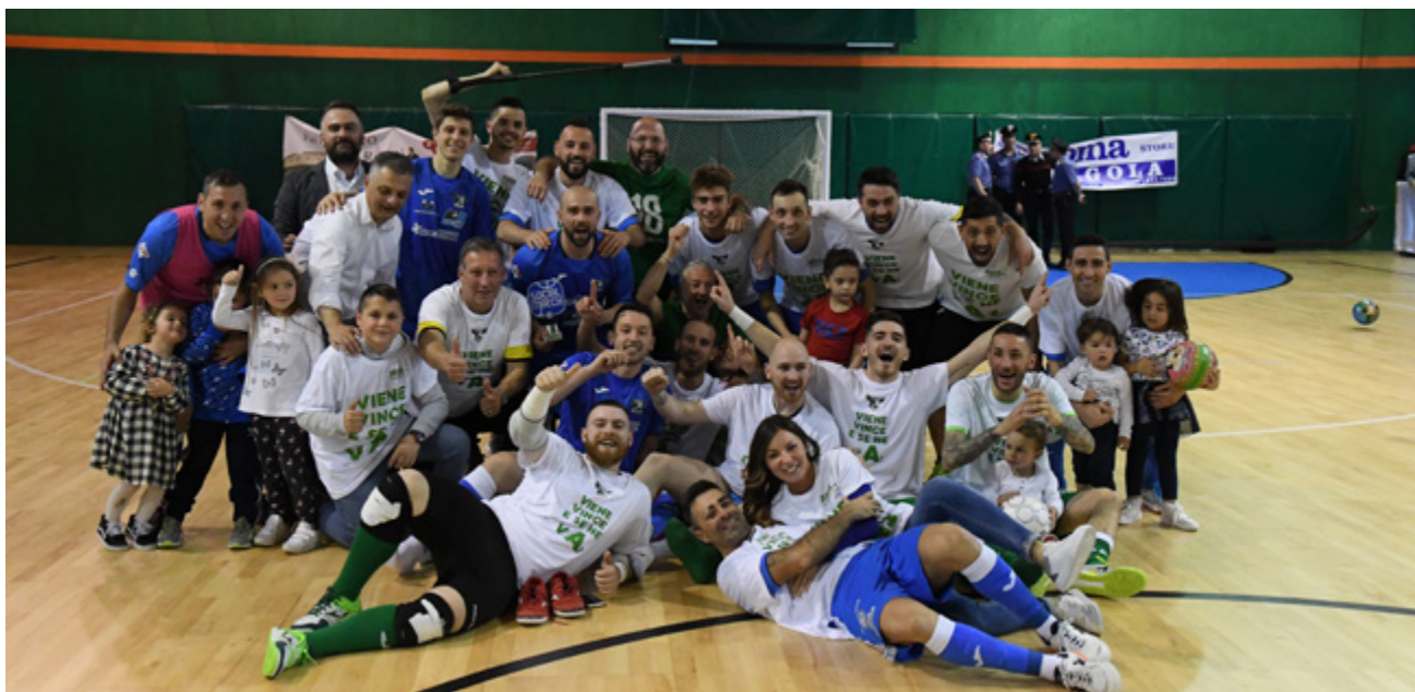
Lesultanza del Sandro Abate promosso in Serie A