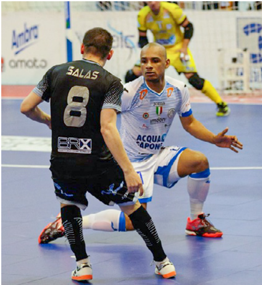
Una fase di gioco di Acqua&amp;Sapone-Pesaro