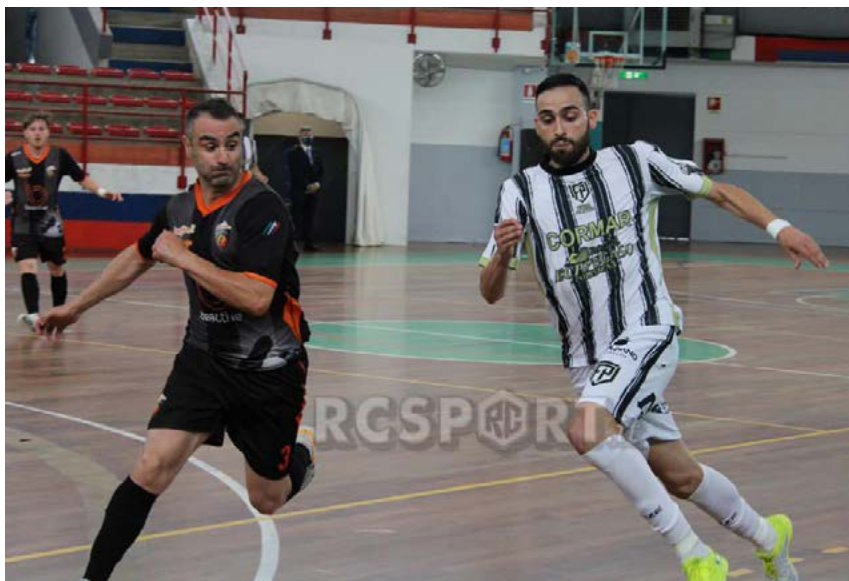
Una fase di gioco di Polistena-Active

Ritorno - Calabresi con un gol di vantaggio, ma, sabato prossimo, gli orange proveranno a sfruttare il fattore campo per ribaltare il punteggio e volare nel massimo campionato nazionale. Appuntamento al PalaCus per l'ultimo atto della stagione: un finale tutto da vivere per un sogno chiamato Serie A.