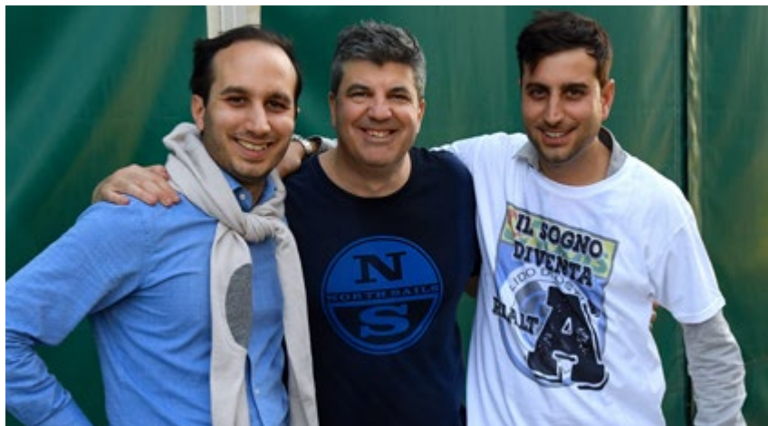
La dirigenza del Lido è pronta per la Serie A