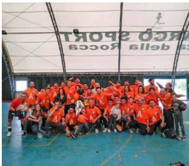
L'Active Network in festa per la promozione in A2