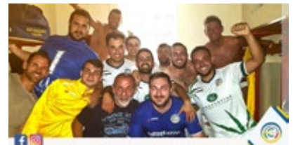
L'esultanza del Casalotti

New year - Manca ancora l'ultima gara del panorama maschile di Serie D valevole per la stagione corrente ed è già tempo di guardare al futuro. Sì, perché per le squadre ai nastri di partenza quest'anno che non hanno ottenuto la promozione - e che sono intenzionate a cercarla dal prossimo autunno - il Comitato ha già reso