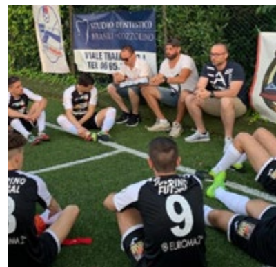
L'Eur Torino durante la semifinale con il Cecchina

di partenza di un futuro radioso che ha visto tanti giovanissimi mettersi in mostra, crescere e onorare questo sport.