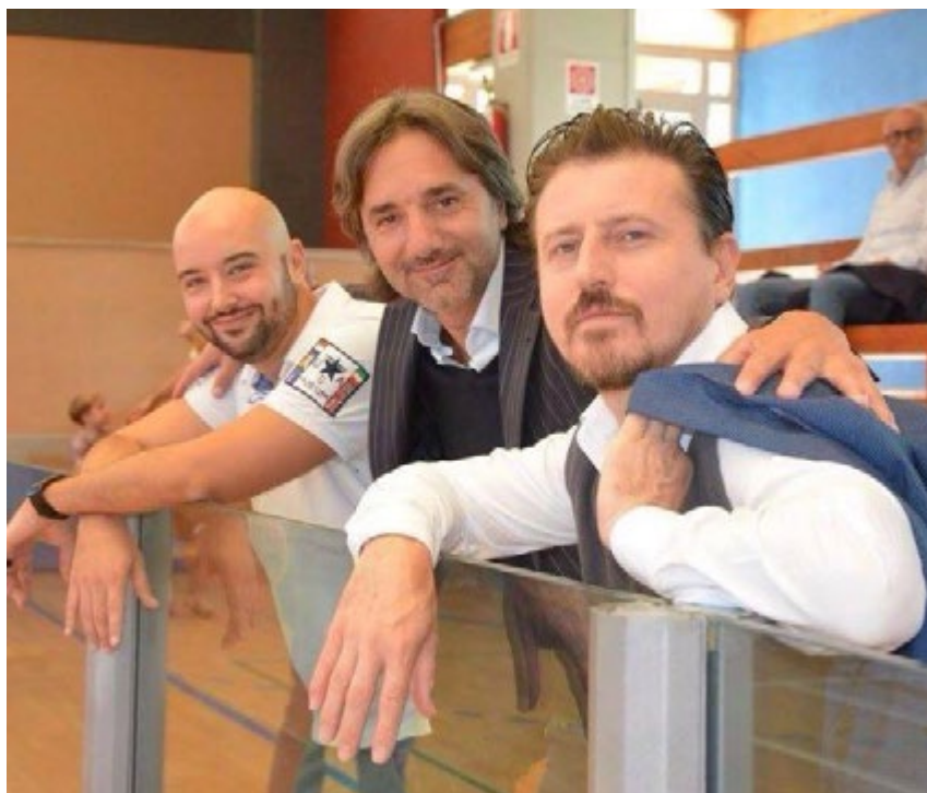
La dirigenza dell'Aniene