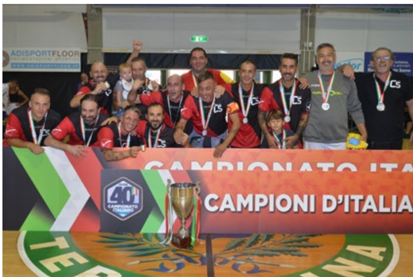
La squadra di Calcio a 5 Live che ha vinto il primo scudetto Over 40

FRA UN FUTSALMERCATO SCOPPIETTANTE, UN AUMENTO DI SQUADRE, E ANCORA IL PALAROMA DI MONTESILVANO SOTTO LE LUCI DELLA RIBALTA, AL VIA LA SECONDA EDIZIONE DEL CAMPIONATO OVER 40. MONTEMURRO: "SOGNO UNA NAZIONALE E UN'AMICHEVOLE ITALIA-BRASILE"