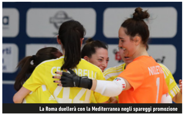
La Roma duellerà con la Mediterranea negli spareggi promozione