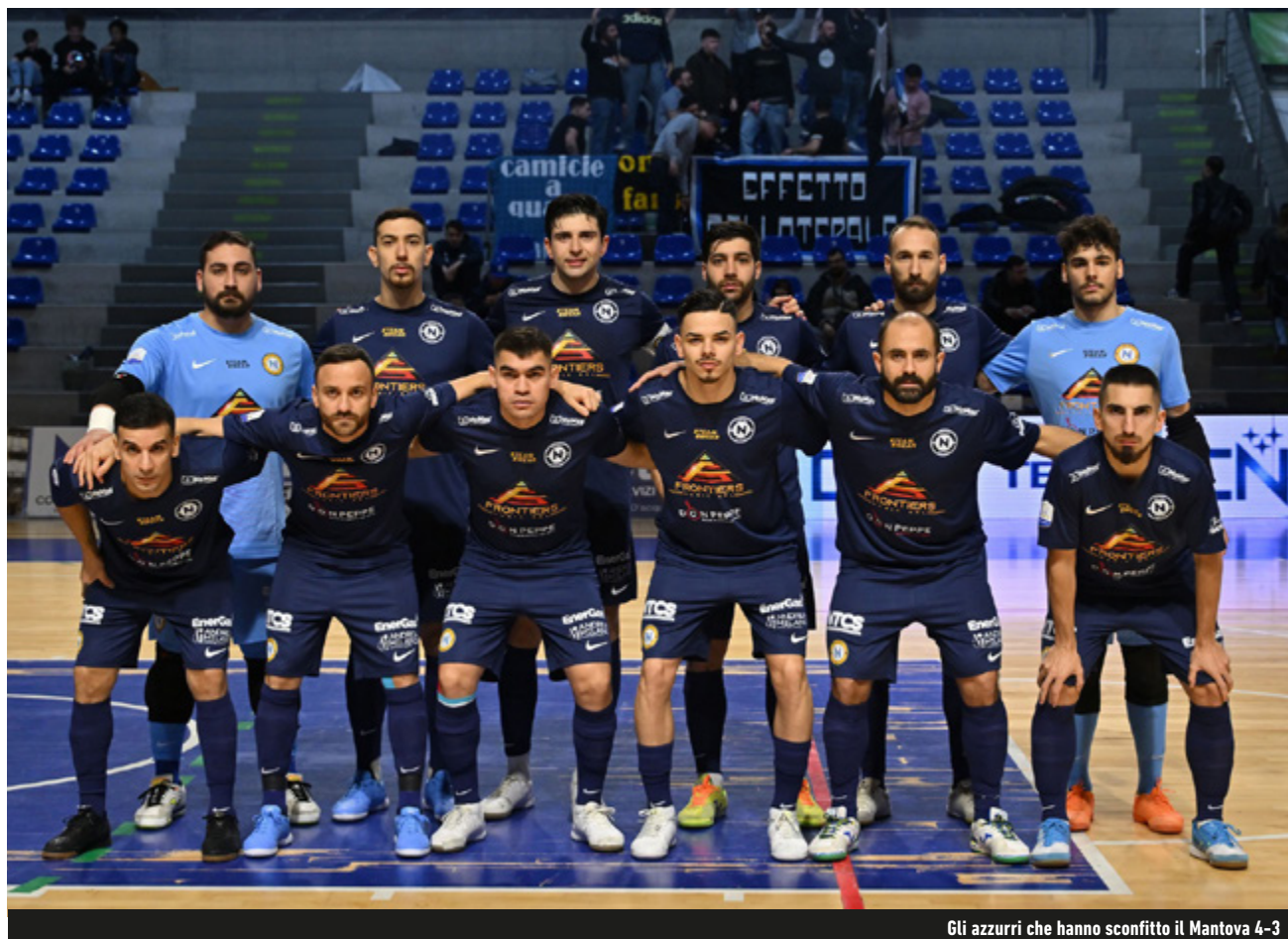
Gli azzurri che hanno sconfitto il Mantova 4-3

Il Napoli è pronto per la Final Four. La vittoria contro il Mantova, la terza consecutiva in campionato, fa bene alla classifica e al morale di un gruppo che si presenterà in