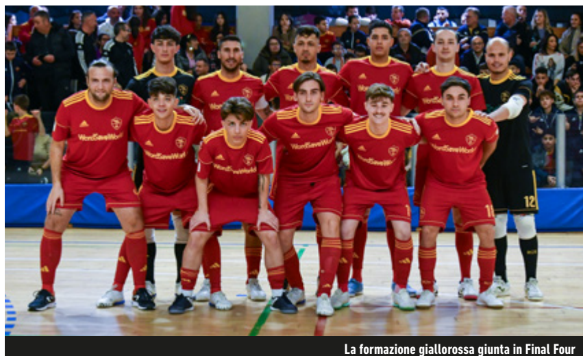
La formazione giallorossa giunta in Final Four

Non sono arrivati i tre punti, ma la Roma può comunque sorridere. Lo 0-0 maturato con il Futura, infatti, ha consegnato ai giallorossi la qualificazione aritmetica, con tre giornate di anticipo, ai playoff. Un traguardo importante, il modo migliore per presentarsi alla Final Four di Coppa Italia.