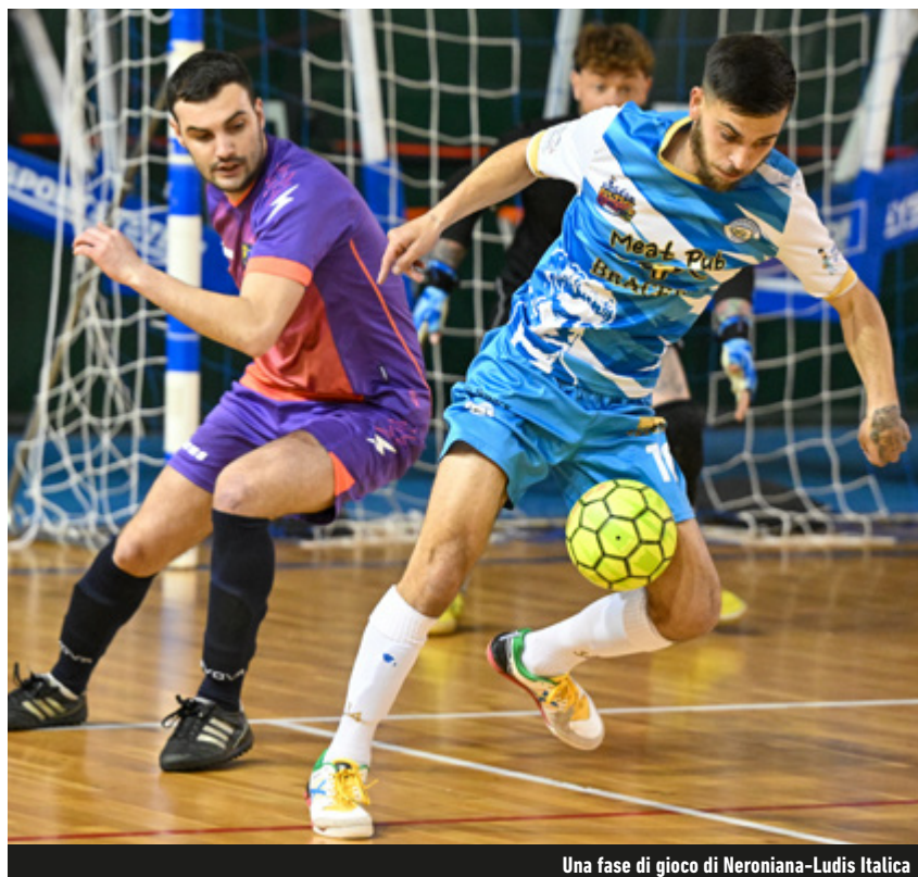
Una fase di gioco di Neroniana-Ludis Italica

Girone C - La capolista Parma Letale ha ritrovato l'appuntamento con la vittoria grazie al 6-3 ai danni del San Giustino. La Neroniana, okay 5-2 sulla Ludis, è tuttavia rimasta a sole