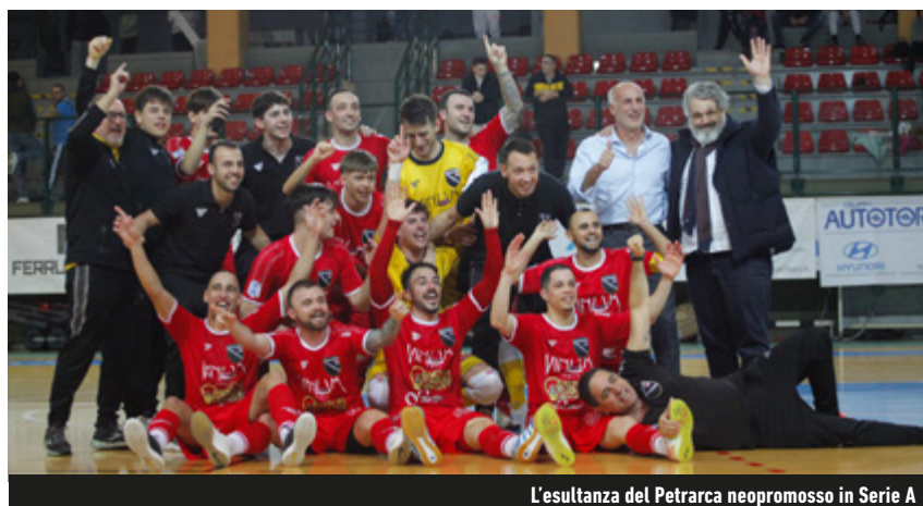
L'esultanza del Petrarca neopromosso in Serie A

A2 Élite - Sette centri a Modena per poter finalmente esultare: il Petrarca chiude il discorso promozione e conquista il Girone A con tre turni d'anticipo. Decisiva la sconfitta del Pordenone per mano del Mestre. I lagunari, così come il CDM, attaccano i playoff complice il riposo dell'Elledì e il k.o. del Lecco con l'Altamarca, ora a -2 dal secondo posto. Weekend importante anche nel Girone B: il Benevento cala il poker nell'anticipo col Giovinezza, mentre il Manfredonia si fa sorprendere sul campo del Regalbuto e scivola a -5 dai campani. La Roma si accontenta delle reti bianche col Futura per accedere ai playoff,