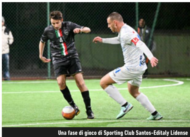
Una fase di gioco di Sporting Club Santos-Editaly Lidense

salvezza: il Ferentino, travolto 14-3 dalla Buenaonda, e l'Albano, steso 2-0 dalla Levante, non possono più accedere ai playoff. Inoltre, l'eventuale classifica avulsa, sia in caso di arrivo a tre che a quattro squadre a quota 30, sorriderrebbe proprio al roster di Volpes. Nelle zone maggiormente nobili, il Collevero, secondo, ha doppiato 6-3 il Ciampino, mentre la Sanvitese, terza, ha piegato 3-2 il Gaeta. I citizens rossoneri, nel prossimo round, faranno i conti con l'Ardea, reduce dal 6-3 con cui ha regolato la Latina.