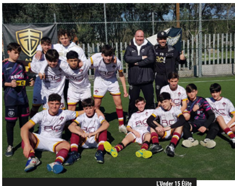
L'Under 15 Élite