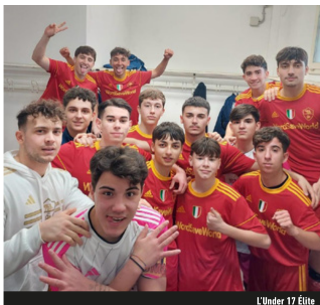
L'Under 17 Élite

unica, secca, da dentro o fuori: uno scoglio duro, ma è obbligatorio crederci. Ci sono società che nascono oggi e spariscono domani. Club che raggiungono picchi tanto eccezionali quanto estemporanei. E poi c'è la Roma, ad alto livello sempre: tutti gli anni e con tutte le categorie.