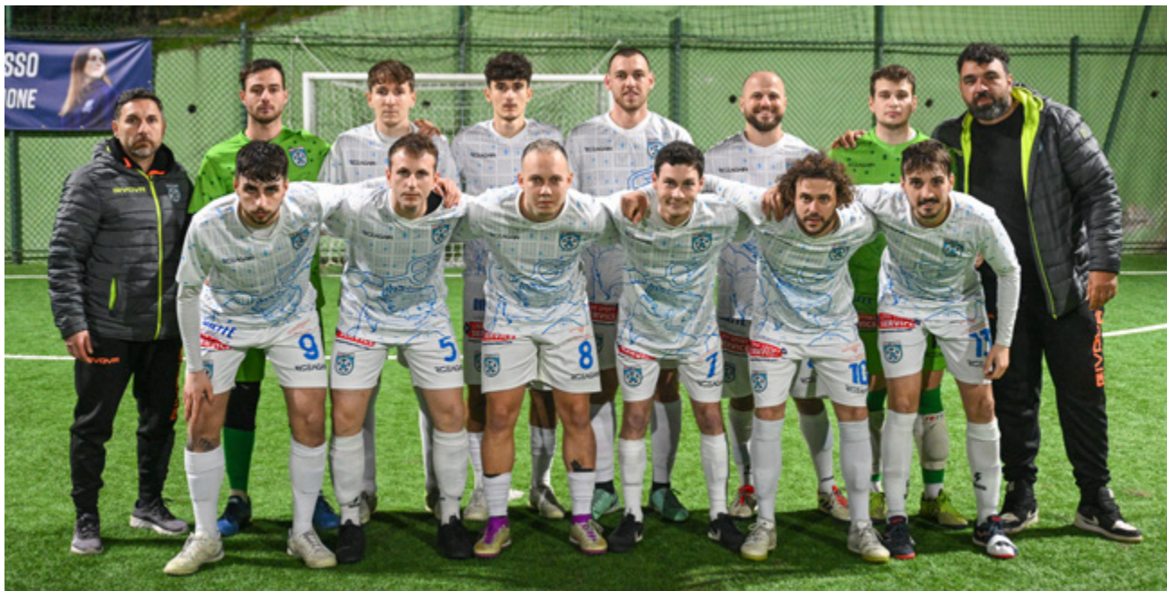
L'Editaly Lidense che ha affrontato lo Sporting Club Santos

abbiamo realizzato il 4-4 finale. È stata una gara non alla nostra altezza anche per le varie assenze che però non possono essere il motivo per il quale abbiamo perso questi due punti che ci avrebbero consentito di allungare in ottica secondo posto". Situazione - Con questo pareggio la Lidense sale a quota 45, staccando