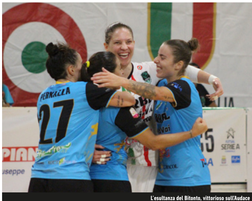
L'esultanza del Bitonto, vittorioso sull'Audace

Serie A - All'8-1 maturato in casa del Pelletterie, le pugliesi neroverdi hanno affiancato altrettanti gol al loro esordio stagionale tra le mura amiche (8-2 sulle veronesi). Il giorno prima del match di Giovinanza, la Serie A femminile ha aperto la seconda giornata della regular season con GTM Montesilvano-A Atletico Foligno, gara che ha premiato le abruzzesi, capaci di imporsi sulle matricole umbre per 4-0. La domenica seguente, la massima categoria in rosa nostrana ha visto completarsi altri tre poker: proprio con quattro gol, la Lazio, la Vip e il Molfetta hanno rispettivamente regolato la T&T Royal Lamezia, il Pelletterie e la Kick Off. L'incontro che ha chiuso la domenica, vale a dire Città di Falconara-TikiTaka Planet, si è invece concluso con un pari: al vantaggio ospite siglato da capitano Débora Vanin è seguito il gol del definitivo 1-1, firmato dalla classe 2002 Silvia Praticò, alle prese con quello che potrebbe rappresentare l'anno della sua