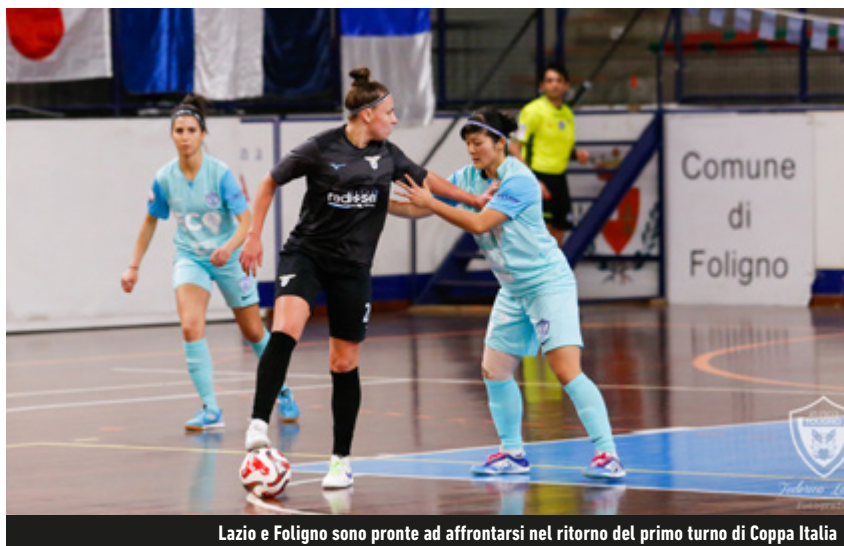
Lazio e Foligno sono pronte ad affrontarsi nel ritorno del primo turno di Coppa Italia

Coppa Italia - Il prossimo fine settimana assegnerà gli ultimi quattro posti disponibili