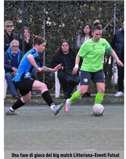
Una fase di gioco del big match Littoriana-Eventi Futsal

però, resta sulla corsa salvezza: Virtus Fondi-Forte Colleferro è il clou, l'AMB Frosinone cerca punti pesanti contro il San Lorenzo, chiudono il quadro Lositana-Marandola e Civitavecchia-Pontinia.