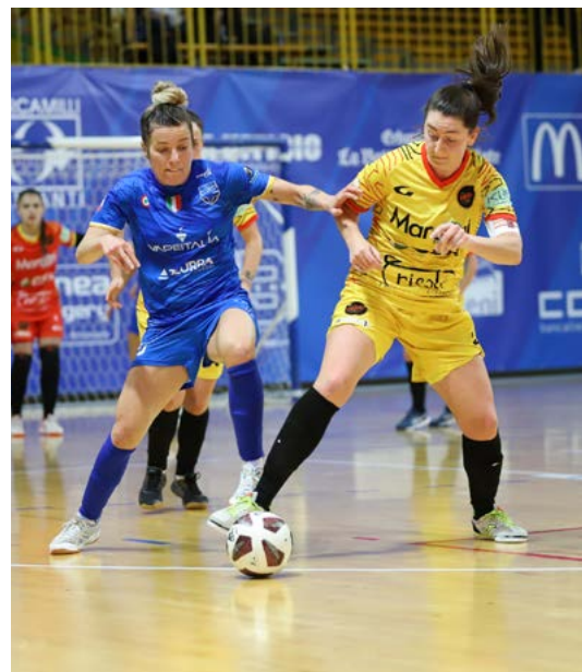
Tiki Taka-Falconara, il big match in onda su Sky

del fanalino di coda Sidicina (15-0), mentre il Napoli, a -4 dalle ombre, ha superato per 4-3 il Prandone in trasferta. D: il Lamezia si è rifatto prepotentemente sotto per il primato. La rete di Sgarbi, infatti, ha regalato alle calabresi il bottino pieno ai danni della Virtus Cap. Con sole due lunghezze di ritardo rispetto alle casaline, la formazione di Carnuccio può ora sognare al trono. Coppa Italia - Per la Serie A2 in rosa, è ora tempo della Final Four che assegna la coccarda tricolore di categoria. La kermesse dell'Estraforum alzerà il sipario il primo aprile con le due semifinali Perugia-Virtus Cap (17.00) e Med-La 10 (20.00). L'atto conclusivo, infine, verrà disputato la domenica seguente allo scoccare delle ore 15.