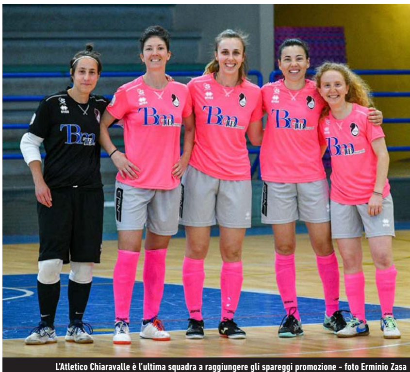
L'Atletico Chiaravalle è l'ultima squadra a raggiungere gli spareggi promozione

Serie A - Le campionesse neroverdi, già sicure del primato in classifica, si ritroveranno di nuovo a sfidare il TikiTaka, lo stesso avversario affrontato nella finalissima. Le giallorosse, sconfitte allo Stadium con un deludente 7-3, dovranno necessariamente imporsi sulle leonesse di Gianluca Marzuoli per avere la certezza di arrivare ai playoff come la seconda forza della serie regina. A -1 dal main roster di Cely Gayardo c'è lo Stilcasa Costruzioni Falconara, atteso a Fiano Romano nel duello con Lazio. Il GTM Montesilvano, quarto, si esibirà al cospetto della Vip, anch'essa già qualificata ai quarti scudetto. A differenza delle venete di Moreno Giorgi, la Kick Off, un'altra delle partecipanti alla Final Eight genovese, non ha invece ancora staccato il pass per il postseason: le All Blacks, dinanzi ai propri tifosi, saranno infatti chiamate a difendere l'ottava piazza dall'assalto a distanza dell'Audace Verona, alle prese con il Molfetta. Le milanesi, avanti di due lunghezze sulle scaligere, ma in svantaggio nella differenza reti negli scontri diretti, dovranno dunque superare a domicilio l'Atletico Foligno per