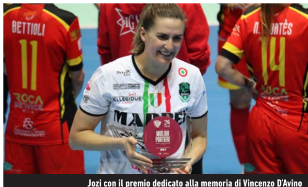
Jozi con il premio dedicato alla memoria di Vincenzo D'Avino