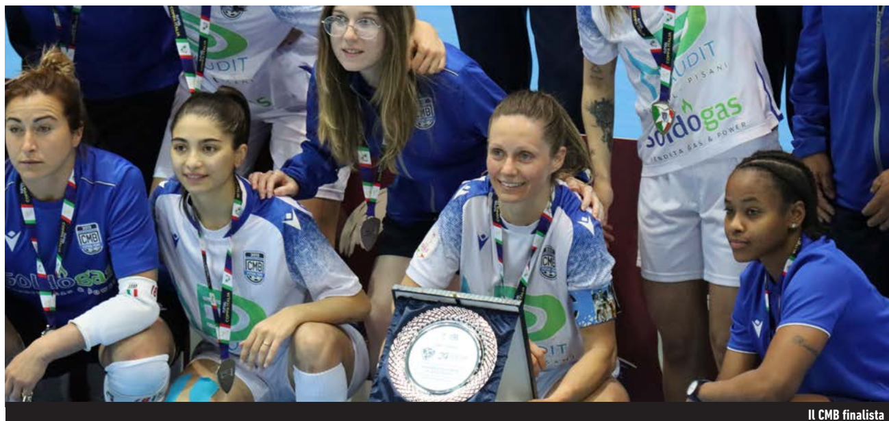
Il CMB finalista