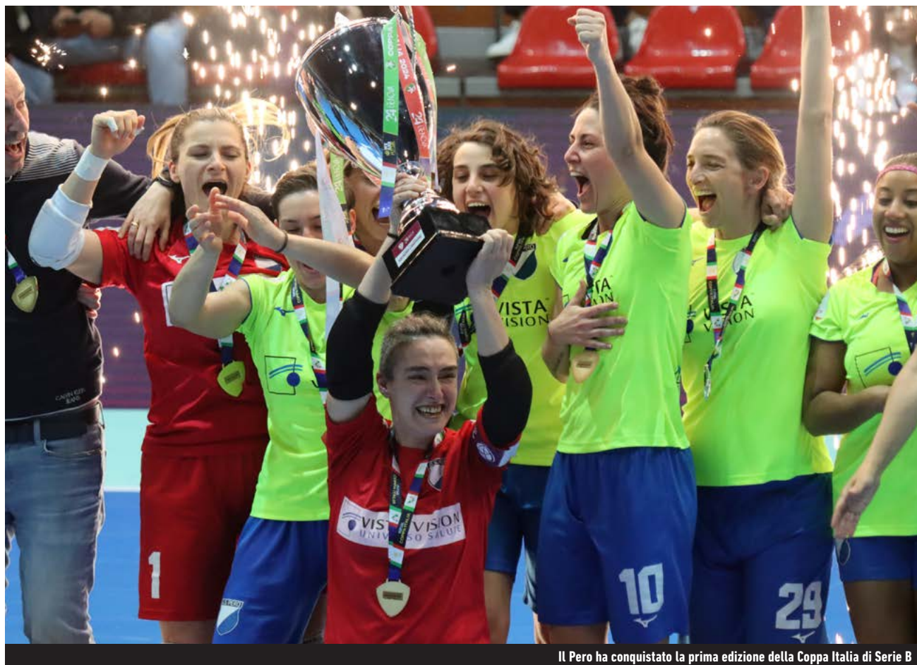
Il Pero ha conquistato la prima edizione della Coppa Italia di Serie B