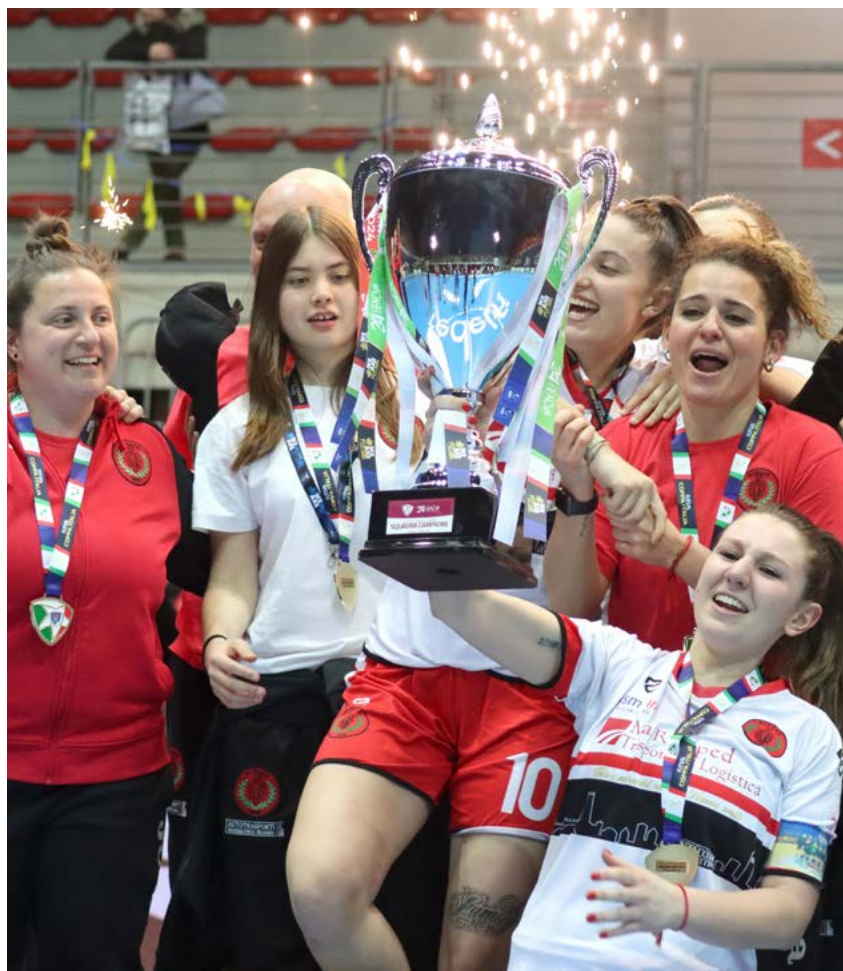
L'Audace Verona alza al cielo la sua prima Coppa Italia Under 19