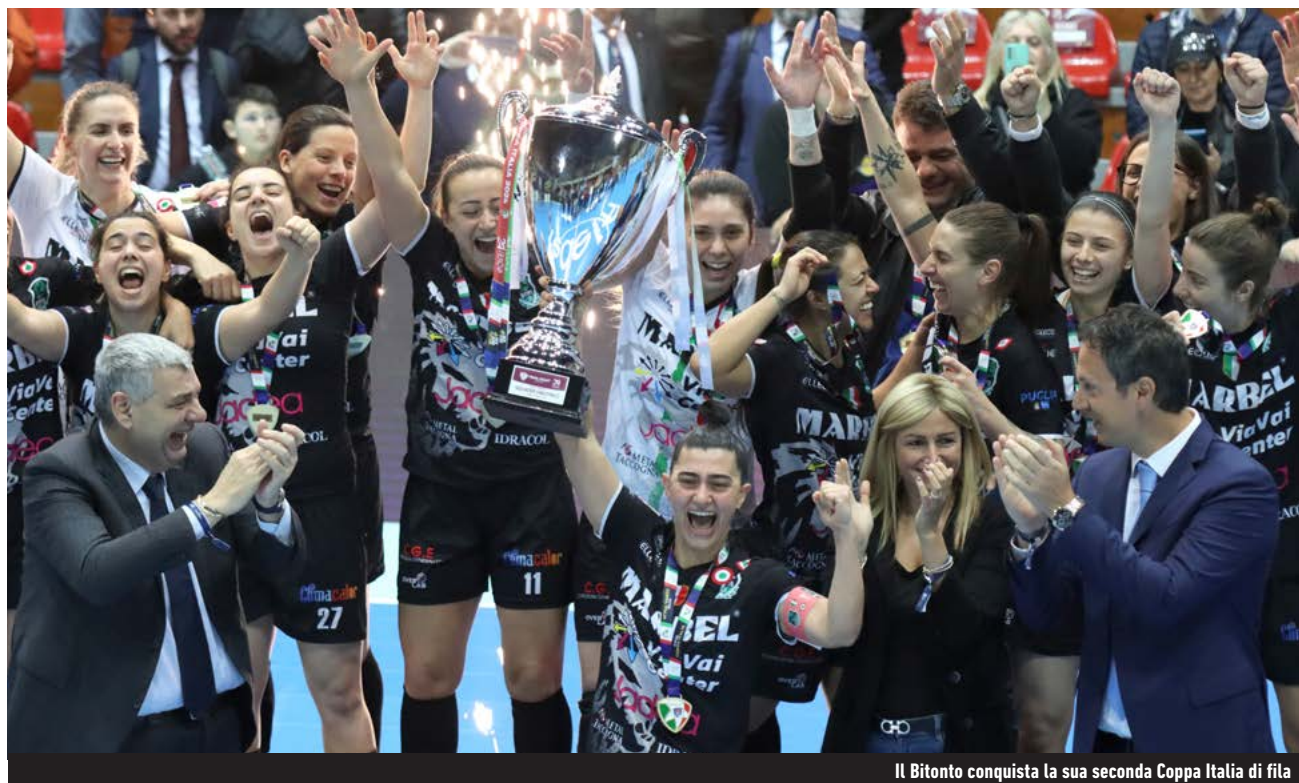
Il Bitonto conquista la sua seconda Coppa Italia di fila