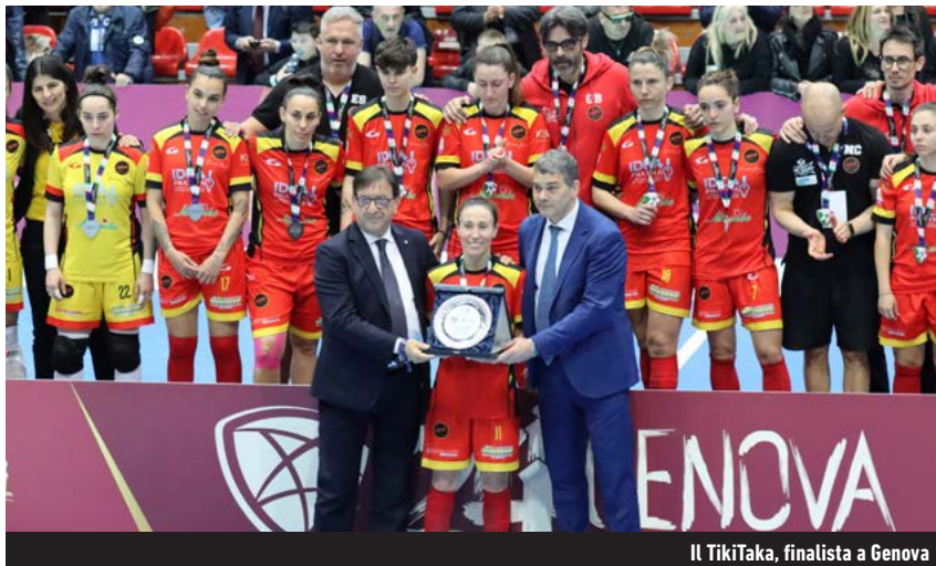
Il TikiTaka, finalista a Genova