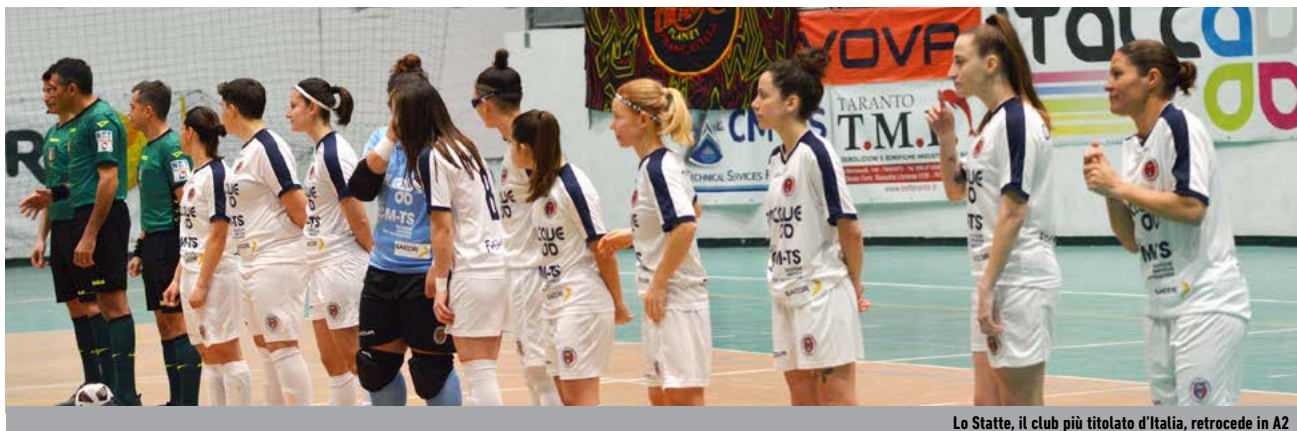
Lo Statte, il club più titolato d'Italia, retrocede in A2