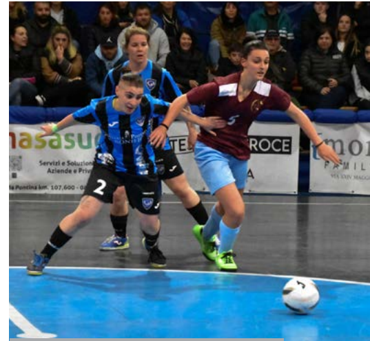
Una fase di gioco di Littoriana-FB5

i playoff: Nova 7 e Frosinone hanno trasferte dure contro FB5 e PMB, Fondi e Colferro chiedono strada a Maranola e Civitavecchia. Pontinia-Club Sport vale il terzo gradino del podio.