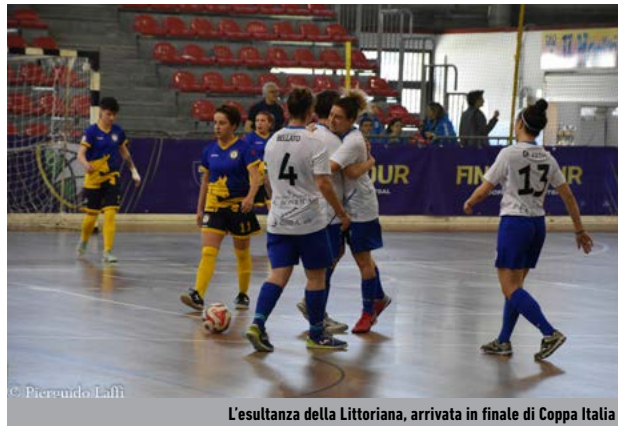
L'esultanza della Littoriana, arrivata in finale di Coppa Italia

La Serie C in rosa vive le giornate più importanti della stagione. L'ultimo turno di regular season, scattato venerdì 28 aprile, terminerà mercoledì 3 maggio - mentre il nostro giornale è in stampa, con il capitolo conclusivo della sfida a distanza per la promozione diretta tra gli Eventi e la Littoriana, reduce dalla Final Four di Coppa Italia.