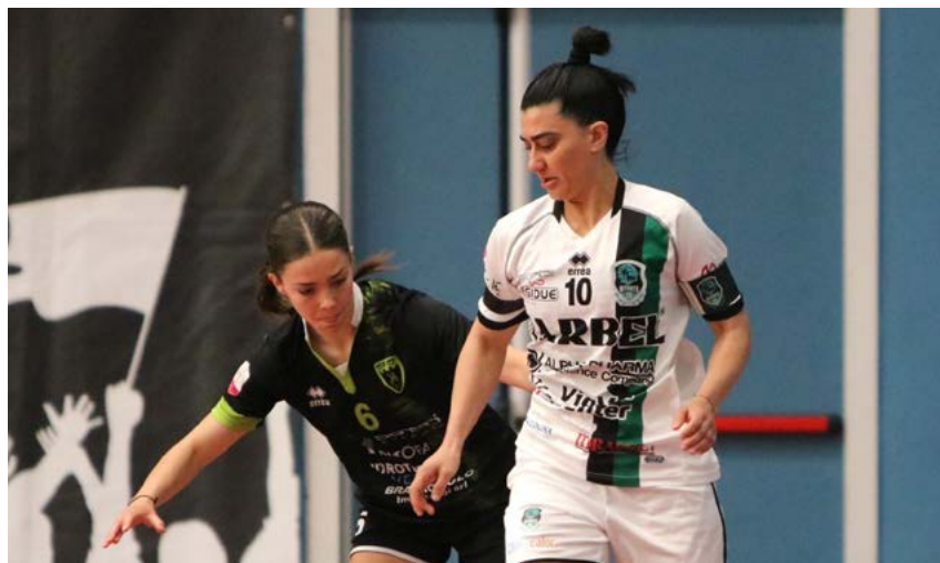
Una fase di gioco di Kick Off-Bitonto

Oltre ad aver concluso il quarto mese del 2023, il 30 aprile ha scritto la parola fine anche sulla regular season del futsal femminile nazionale. Sono finalmente arrivati, dunque, gli ultimi verdetti prima della fase clou dell'anno, tra cui spiccano il trono difeso dal Pescara nella sfida a distanza col Bitonto e, nella parte destra della classifica, il successo al fotofinish del Molfetta sul Pelletterie - comunque qualificato ai playoff - che costringerà l'Audace Verona, sconfitto per mano delle delphine, a giocarsi la permanenza in Serie A nel play-out contro l'Irpinia. Playoff - I quarti di finale scudetto, che verranno disputati al meglio delle tre gare (7, 12 e 14 maggio), vedranno la capolista della massima categoria in rosa cominciare il percorso nel post-season a Scandicci, il quartier generale delle toscane di Pamela Presto. Chi avrà la meglio tra il team di Dudu Morgado e la formazione di Scandicci affronterà la vincente della serie tra la Kick Off, reduce dalla pesante sconfitta interna per 12-2 patita per mano delle leonesse di Gianluca Marzuoli, e il TikiTaka Planet, la quarta forza del gotha del calcio a 5 femminile. Dall'altro lato del tabellone, il Bitonto, trionfatore in Coppa Italia, duellerà con la Vip in Veneto, mentre le campionesse d'Europa in carica del Città di Falconara, impegnate a Fiano Romano, faranno i conti con la Lazio, a caccia di rivalse dalle delusioni di Final Four. Gara-1, gara-2