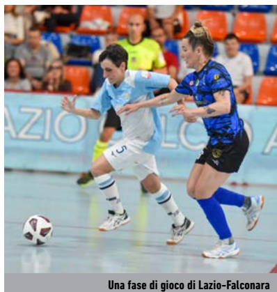
Una fase di gioco di Lazio-Falconara

Serie A2 - Lo scorso weekend ha visto andare in scena il primo turno dei playoff della seconda categoria femminile per importanza.