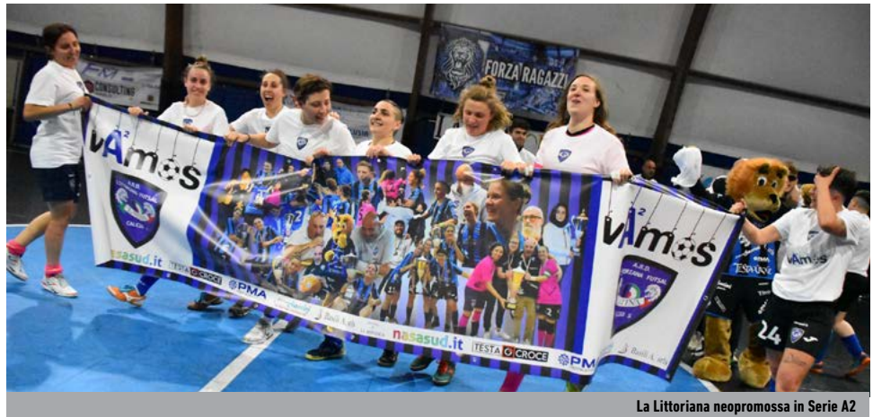
La Littoriana neopromossa in Serie A2

Entrambe hanno emozionato per un'intera stagione, entrambe hanno inanellato successi e numeri da record, entrambe hanno viaggiato a ritmi inarrivabili per il resto del plotone. Solo una, però, poteva fregiarsi dello scettro della Serie C in rosa edizione 2022-2023: l'onore è toccato alla Littoriana, in grado di cogliere il bottino pieno anche nell'ultima giornata di campionato e