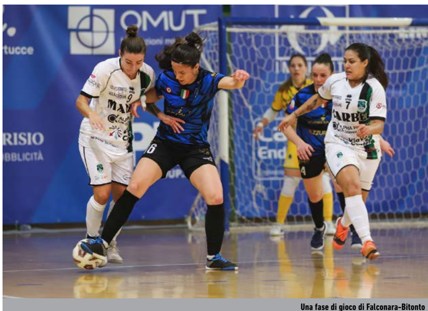
Una fase di gioco di Falconara-Bitonto

stati invece il Corticella, che ha piegato per 3-2 il Cus Pisa al ritorno, e la Lux Chieti, che ha travolto per 7-2 il Reggio Sporting Club - vittorioso per 3-1 all'andata -. Oltre che sul return match dei playoff, valido per la qualificazione alla Final Four in programma a Salsomaggiore Terme il 3 e il 4 giugno, domenica 28 maggio si accenderanno i riflettori anche sul secondo round degli spareggi per la promozione. La 10 Livorno, al PalaAliperti, dovrà difendere - e se possibile migliorare - il 2-1 ottenuto contro la Woman Napoli all'Impianto La Bastia per entrare nel gotha del futsal femminile nostrano; la T&T Royal Lamezia, di fronte ai propri tifosi, proverà infine a far valere il fattore campo sul Pero, ossia la compagine lombarda condotta dalla player-manager Priscila Faria De Oliveira contro cui ha pareggiato per 2-2 alla Vista Vision Arena.