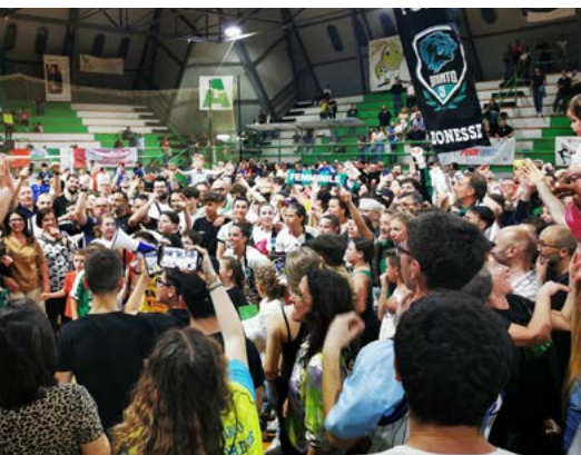
La festa del Bitonto per l'accesso in finale