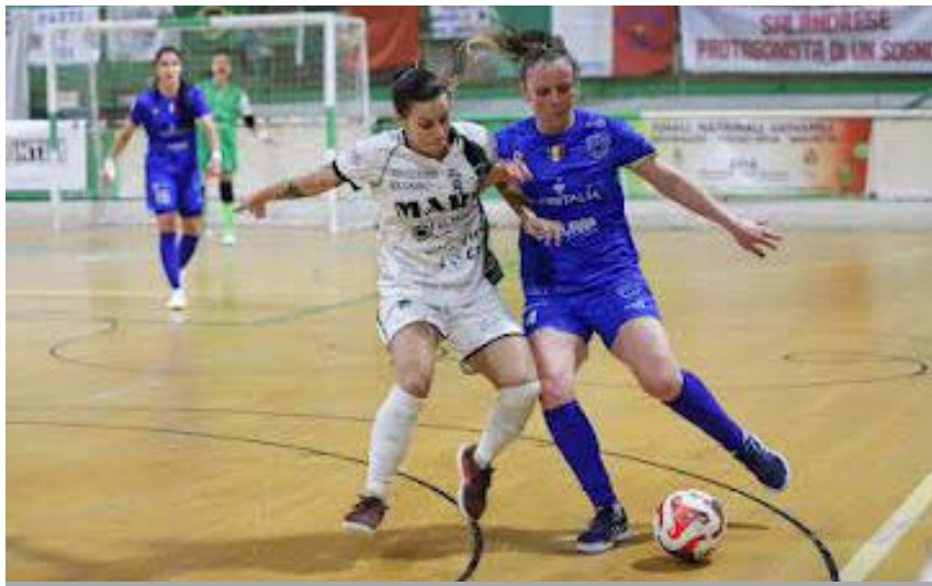
Una fase di gioco di Bitonto-Falconara

Serie A2 - La cadetteria in rosa, nel weekend, ha assegnato le prime due delle quattro promozioni per la massima categoria, edizione 2023-24. A entrare nel circolo delle "grandi" sono state la T&T Royal Lamezia, che ha steso con un 3-1 interno il Pero al ritorno, e La 10 Livorno, forte del successo per 4-3 ottenuto all'extra time al cospetto della Woman Napoli. Sia le lombarde che le partenopee - quest'ultime senza il dimissionario Vincenzo lamunno in panchina - avranno comunque una seconda chance di entrare nell'Olimpo del calcio a 5 femminile italiano, vale a dire le Futsal Finals di Salsomaggiore Terme. Nelle semifinali di sabato 3 giugno, le campane affronteranno l'Atletico Foligno nella sfida delle ore 17, con lombarde, invece, attese all'incontro delle 20 che le vedrà duellare con la Nox Molfetta. L'ultimo atto, infine, verrà giocato l'indomani, ancora una volta all'E-R Arena, allo scoccare delle 16.