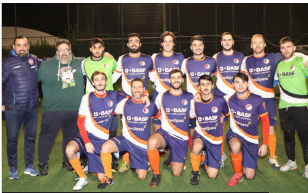
La formazione del Futsal Settecamini

Castromenio - La prossima tappa del calendario offre al Settecamini la sfida casalinga contro il Castromenio. Un incontro importante, che potrebbe consentire di concludere positivamente il 2023: "Il mister ci ha detto di non guardare assolutamente la classifica, perché si è capito che in questo campionato qualsiasi squadra lotta per ottenere punti. Lavoreremo in settimana per vincere e chiudere in bellezza l'anno".