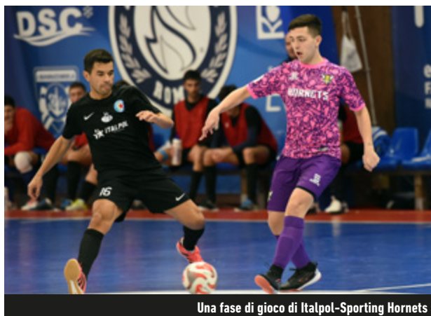
Una fase di gioco di Italpol-Sporting Hornets

Il big match dell'undicesima giornata di A2 Élite tra Petrarca e Pordenone poteva dire molto sul possibile prosieguo della stagione: ciò che è emerso sono le intenzioni, chiarissime, della squadra di Giampaolo, campione d'inverno con due giornate d'anticipo. Destino inverso per il Manfredonia, che, dopo un avvio sprint, si è un po' perso fino a farsi agganciare dal Benevento. Adesso un weekend di sosta: spazio