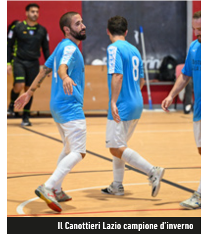
Il Canottieri Lazio campione d'inverno

riguarda la lotta per la permanenza in Serie C1, hanno entrambe chiuso il weekend col sorriso, grazie agli acuti maturati su Gap (1-4) e Santa Severa (4-2). Il tredicesimo round vedrà in scena l'interessante match CCL-PGS.