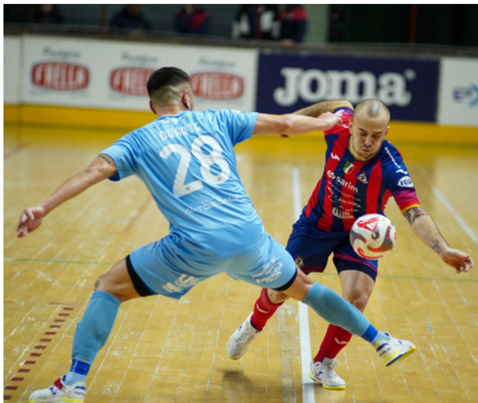
Una fase di gioco del derby Feldi Eboli-Napoli

L'ammucchiata - Poteva essere fuga per l'Olimpus Roma, ma, alla resa dei conti, lassù tutto è rimasto invariato. Al netto di una Feldi che deve recuperare sia la sfida con l'Olimpia Verona sia quel 1'25" che resta da giocare a San Rufo contro lo Sporting Sala Consilina (si ripartirà dal 3-1 per i Draghi gialloverdi), la doppia frenata di Olimpus Roma e L84 ha prodotto un altro ingorgo: le prime cinque sono in otto punti. Il Meta Catania è quella