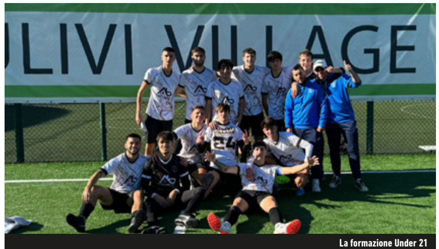
La formazione Under 21