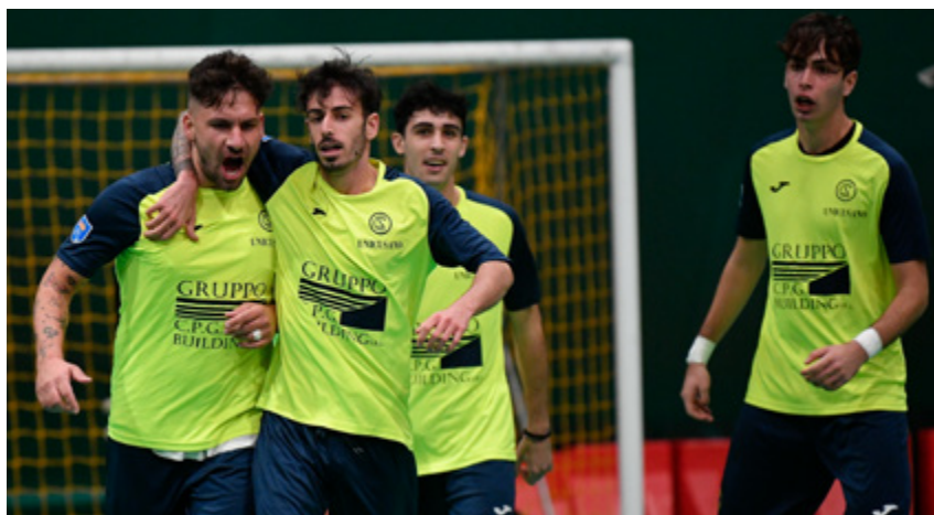
L'esultanza del Club Sport Roma

Gironi D-E-F - I Grifoni ringraziano il vantaggio accumulato nelle scorse settimane e si prendono il lusso di scivolare col Real Rieti, mantenendo un +3 sul Cus Ancona e un +4 sul Recanati. I laziali attaccano la zona playoff del Girone D a discapito dell'Eta Beta, fermata sul pari dall'altra sabina, il Poggio Fidoni. Restando nel Lazio, è il Real Ciampino che continua a dominare il gruppo E: gli aeroportuali salgono sull'ottovolante con l'Elmas e mantengono i quattro punti di distacco sul Club Sport Roma, a segno così come Velletri e Cures. La prima