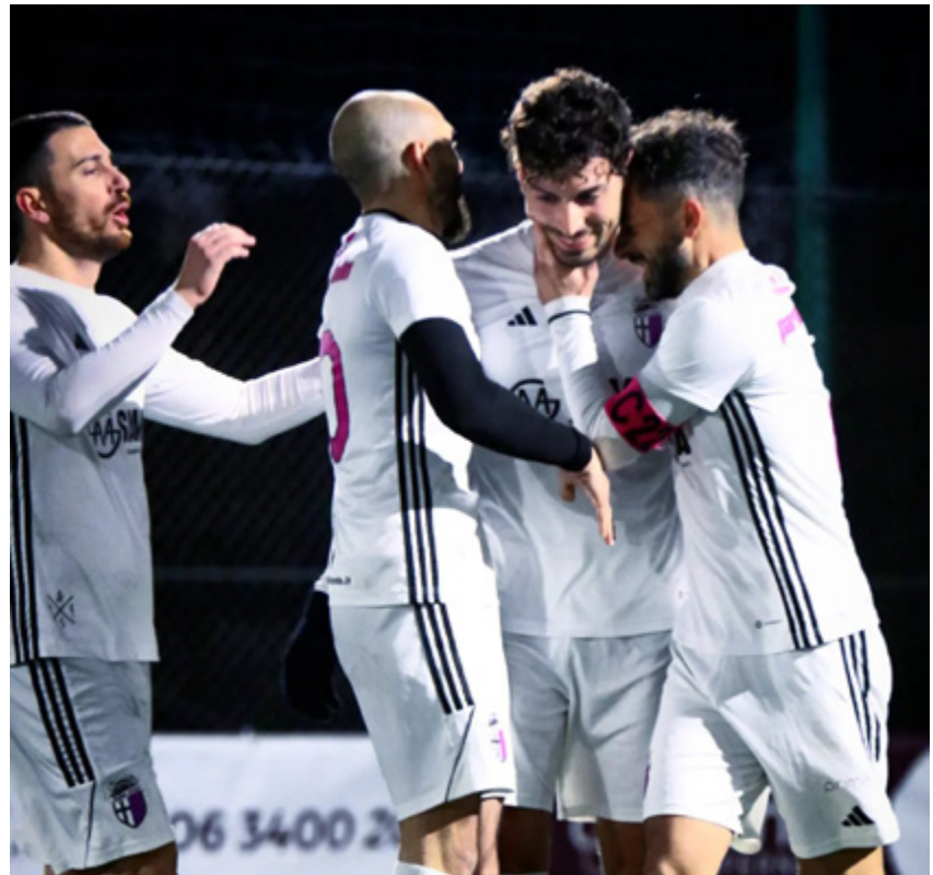
Il Parma Letale campione d'inverno

Girone C - Per quel che concerne l'andata, nessuno può più acciuffare il Parma. Letale, infatti, è stato il 4-3 esterno ai danni del Palmarola. La Ludis, comunque sia, si è