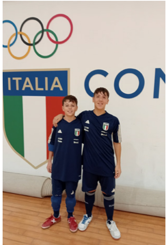
I due giovani giallorossi protagonisti allo stage Futsal+15